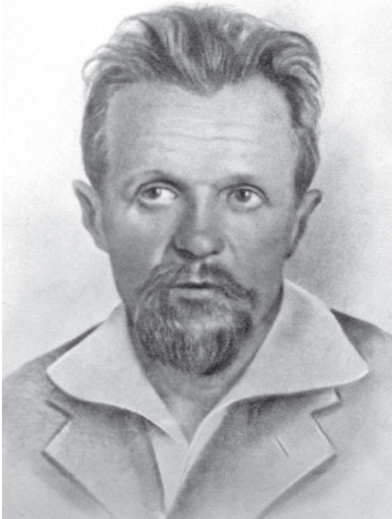
Рис. 1. Мстислав Вацлавович Воеводский. Фото. Кафедра археологии МГУ.

Fig. 1. Mstislav Vatslavovich Voevodsky. Photo. Department of Archaeology of Moscow State University.