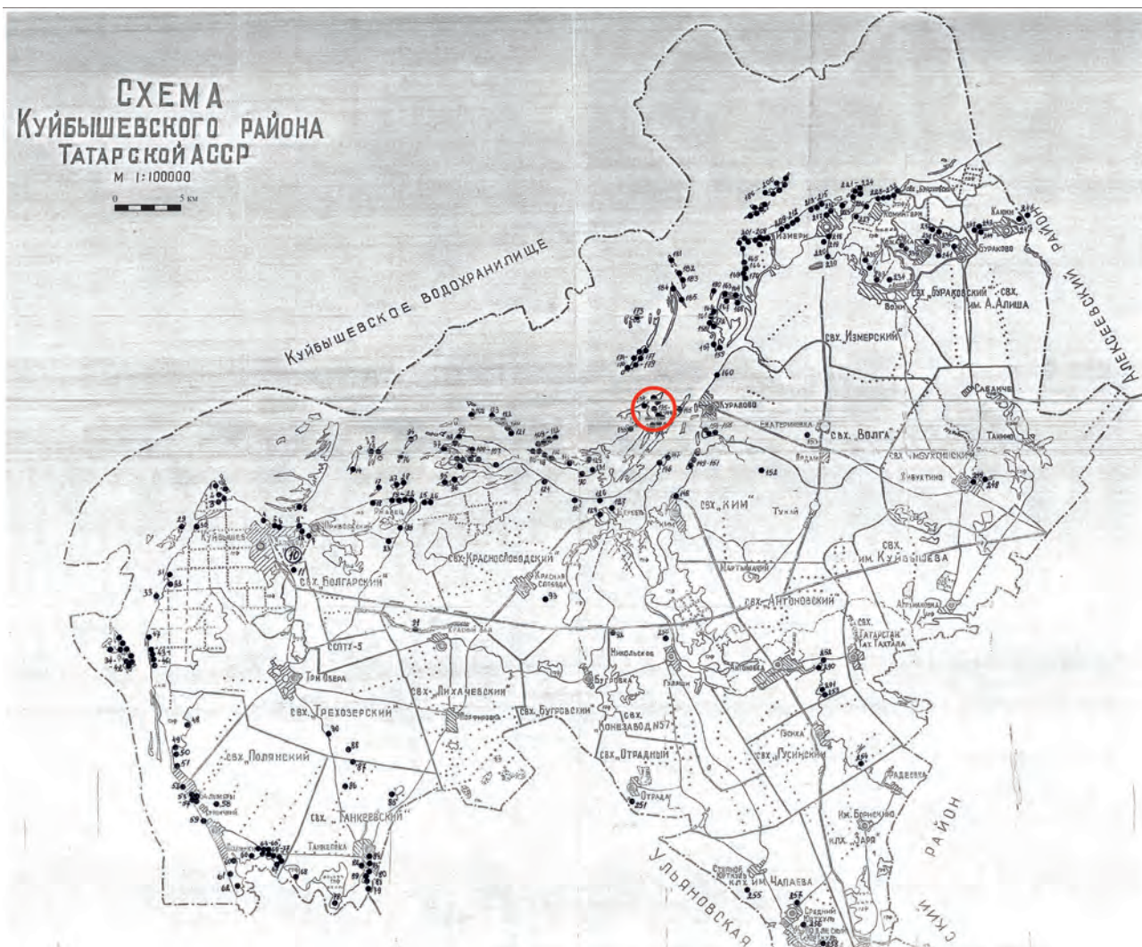
Рис. 4. Фрагмент схемы Спасского района Республики Татарстан с памятниками археологии с указанием Старокуйбышевской группы памятников.