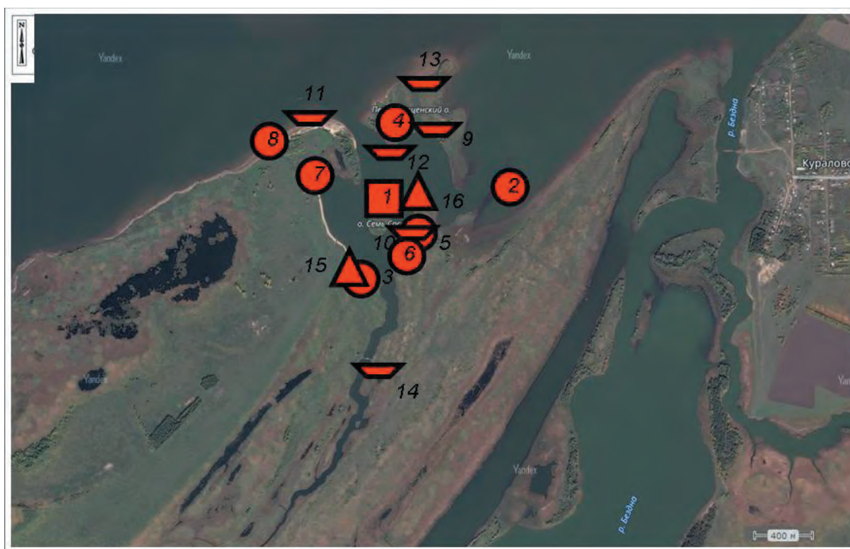
Рис. 3. Космоснимок рассматриваемого района с локализацией Старокуйбышевской группы археологических памятников: 1 – городище, 2 – II селище, 3 – III селище, 4 – IV селище, 5 – V селище, 6 – VI селище, 7 – VII селище, 8 – VIII селище, 9 – I могильник, 10 – II могильник, 11 – III могильник, 12 – V могильник, 13 – VI могильник, 14 – VI (VII) могильник, 15 – II стоянка, 16 – III стоянка.