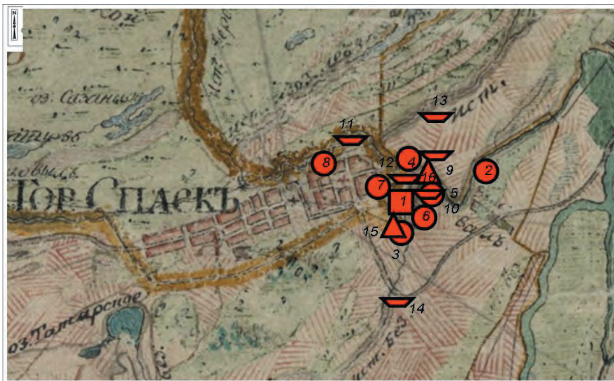
Рис. 2. Увеличенный фрагмент Генерального плана Спасского уезда конца XVIII в. с локализацией Старокуйбышевской группы археологических памятников: 1 – городище, 2 – II селище, 3 – III селище, 4 – IV селище, 5 – V селище, 6 – VI селище, 7 – VII селище, 8 – VIII селище, 9 – I могильник, 10 – II могильник, 11 – III могильник, 12 – V могильник, 13 – VI могильник, 14 – VI (VII) могильник, 15 – II стоянка, 16 – III стоянка.