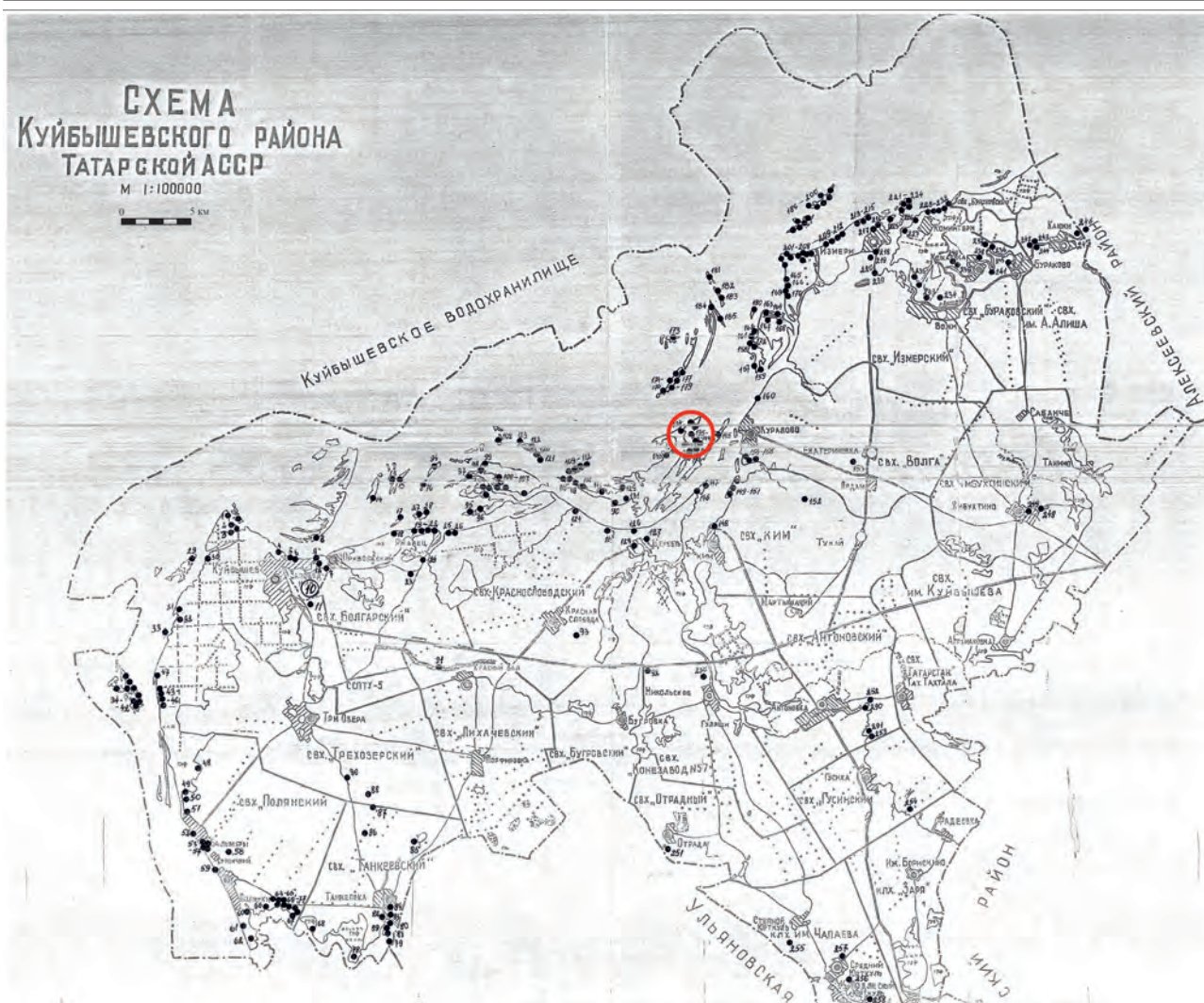
Рис. 4. Фрагмент схемы Спасского района Республики Татарстан с памятниками археологии с указанием Старокуйбышевской группы памятников.