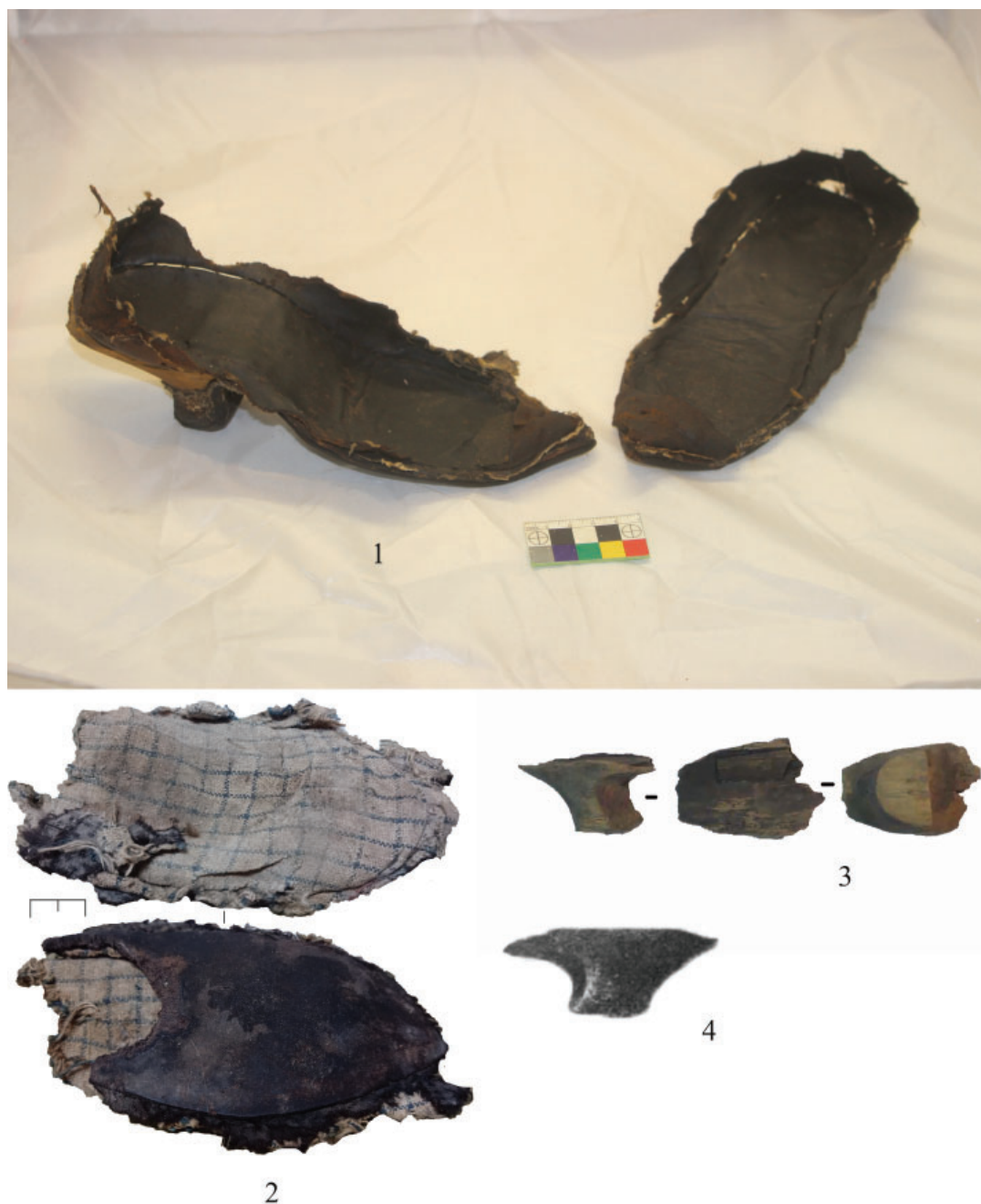
Рис. 1. Кожаная обувь. 1 – пара дамских туфель из Первого кадетского корпуса. Кожа, дерево, шелк, нить (фото К. В. Шмелева); 2 – фрагмент тканевого галуна из Первого Кадетского корпуса. Ткань, кожа. Помещение А.1.07 (фото автора); 3 – деревянный каблук из Первого кадетского корпуса (фото К.В. Шмелева); 4 – деревянный каблук от женской туфли (по: Грач, 1957, табл. XXIV, рис. 3).

Fig. 1. Leather shoes. 1 – pair of ladies' shoes from the 1st Cadet Corps. Leather, wood, silk, thread (photo by K.V. Shmelev); 2 – fragment of fabric galloon from the 1st Cadet Corps. Fabric, leather. Room A.1.07 (photo by the author); 3 – wooden heel from the 1st Cadet Corps (photo by K.V. Shmelev); 4 – wooden heel of a woman's shoe (according to Grach, 1957, table XXIV, fig. 3).