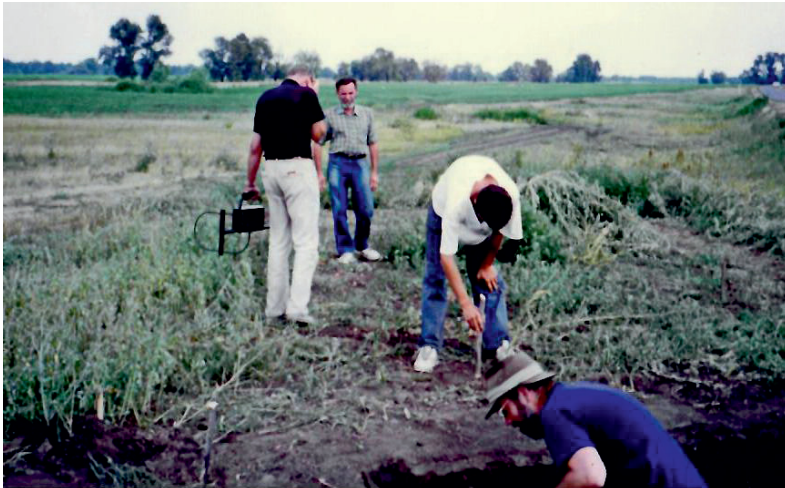
Рис. 5. Могильник Спиридоновка II срубной культуры. Лето 1995 г. Fig. 5. Burial ground Spiridonovka II of the Srubnaya culture. Summer 1995.

при жизни учёного покровские материалы многими исследователями относились либо к отдельной культуре, либо к отдельному типу памятников. После написания статьи прошло много лет, однако её актуальность сохраняется. Позднее И.Б. Васильев связывал происхождение срубной культуры с потаповскими и абашевскими культурными традициями, и в меньшей степени с переработанными полтавкинскими традициями. Но во время подготовки статьи потаповские памятники только начали исследоваться. В работе представлены: характеристика хозяйства, особенности курганных и грунтовых захоронений, поселений. Очень важна мысль И.Б. Васильева о возможном выделении в Поволжье локальных вариантов срубной культуры. Происхождение «срубников» Поволжья фиксируется Игорем Борисовичем в полтавкинской культуре Нижнего и Среднего Поволжья и доно-волжской абашевской (по терминологии А.Д.Пряхина) культуре.