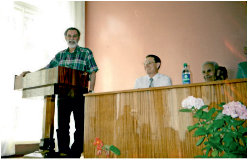
Рис. 4. Международная научная конференция «Абашевская культурно-историческая общность: истоки, развитие, наследие». Чебоксары, май 2003. Чувашский государственный институт гуманитарных наук. Выступление с приветственным словом.

Fig. 4. International scientific conference “Abashevo cultural and historical community: origins, development, heritage.” Cheboksary, May 2003. Chuvash State Institute of Humanities.