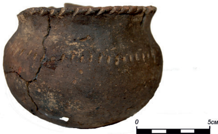
Рис. 3. Сосуд с резным орнаментом. Баяновский I могильник, сектор А. Fig. 3. Vessel with a carved ornament. Bayanovo I burial ground, sector A.

Многорядные линии шнура по шейке и зигзаг или волны по плечу сосуда, выполненный оттиском шнура (5 сосудов, 8,77%);