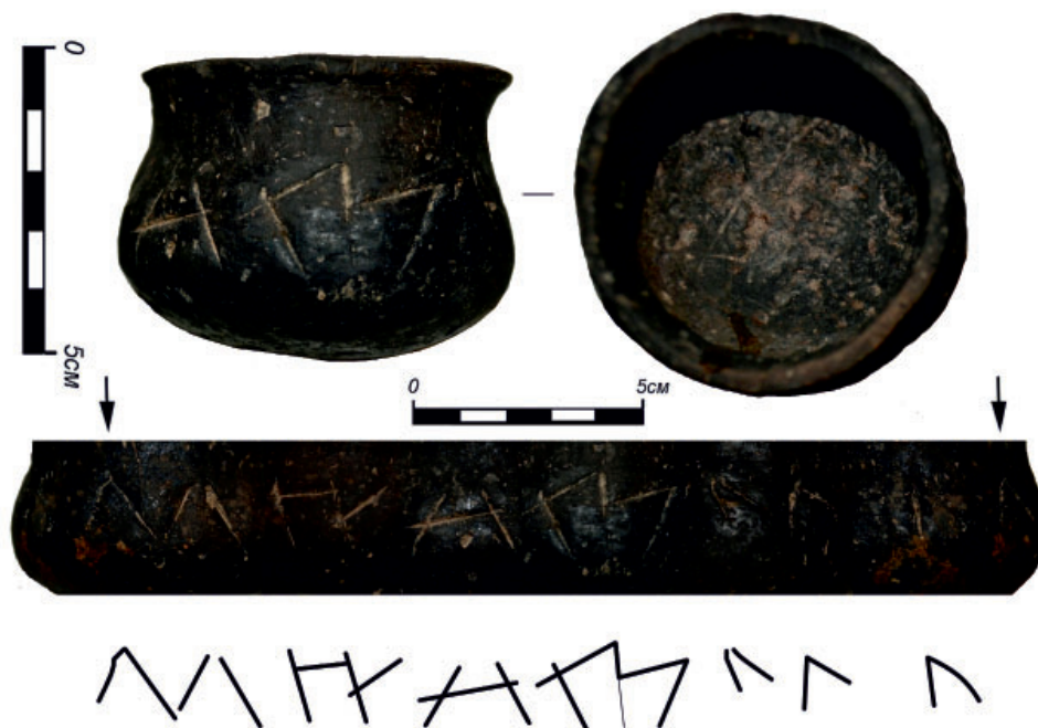
Рис. 4. Сосуд с надписью, нанесенной неаккуратной кириллицей (Данич, 2020).