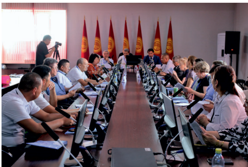
Рис. 9. Открытие первого этапа X Международной археологической школы в Кыргызско-Узбекском международном университете им Б. Сыдыкова, г. Ош, Республика Кыргызстан, 26 июня 2023 г. Fig. 9. Opening of the first stage of the X International Archaeological School at the Kyrgyz-Uzbek International University named after B.Sydykov, Osh, Republic of Kyrgyzstan, June 26, 2023

МИЦАИ) и будет реализовываться ежегодно при поддержке МИЦАИ в одной из стран ее участниц.