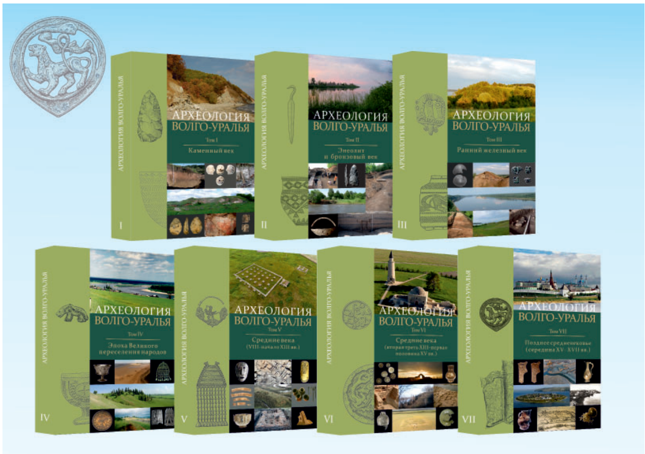
Рис. 3. Обложки семитомной академической монографии «Археология Волго-Уралья». Fig. 3. Covers of the seven-volume academic publication "Archaeology of the Volga-Urals".

Института в личных документах А.Х. Халикова сохранилась неопубликованная рукопись продолжения монографии по материалам раскопок Больше-Тиганского могильника (Ситдииков и др., 2022, с. 5).