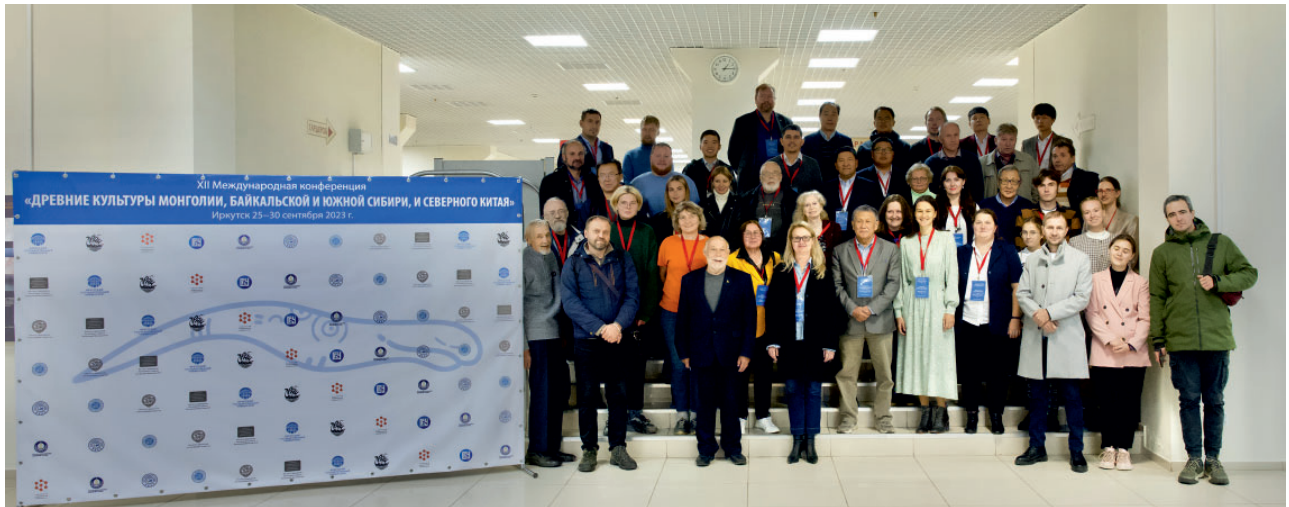
Рис. 4. Участники международной конференции «Древние культуры Монголии, Байкальской и Южной Сибири и Северного Китая», г. Иркутск, 25-30 сентября 2023 г.