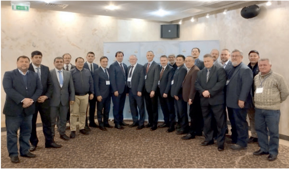
Рис. 8. Участники международного круглого стола «Актуальные проблемы истории и культуры народов степной Евразии», г. Казань, 24-27 ноября 2023 г. Fig. 8. Participants of the international round table "Topical issues of history and culture of steppe Eurasia peoples", Kazan, November 24-27, 2023.

продолжении ее тем в 2024 году запланировано проведение конференции по обсуждению и утверждению международной программы по изучению актуальных проблем истории и культуры народов степной Евразии с привлечением ведущих специалистов из научных центров России и зарубежья.