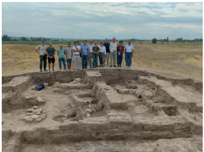
Fig. 6. Participants of the field seminar “Medieval cities on the Eurasian transcontinental trade routes: urban centers of Chuy valley and the Middle Volga region”. at the Keng-Bulung fortified settlement, Kyrgyzstan, August 6-8, 2023.