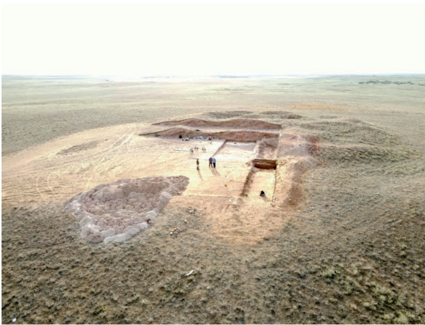
Рис. 5. Археологические исследования мавзолеев эпохи Узбек-хана у с. Лапас, Астраханская обл., июль 2023 г.

Fig. 5. Archaeological studies of mausoleums of the Uzbek-khan time near the village of Lapas, Astrakhan region, July 2023.