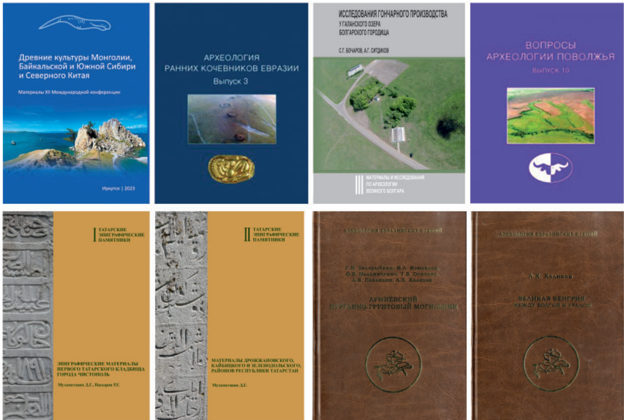
Рис. 1. Обложки монографий, опубликованных сотрудниками Института археологии имени А.Х. Халикова АН РТ в 2023 г.