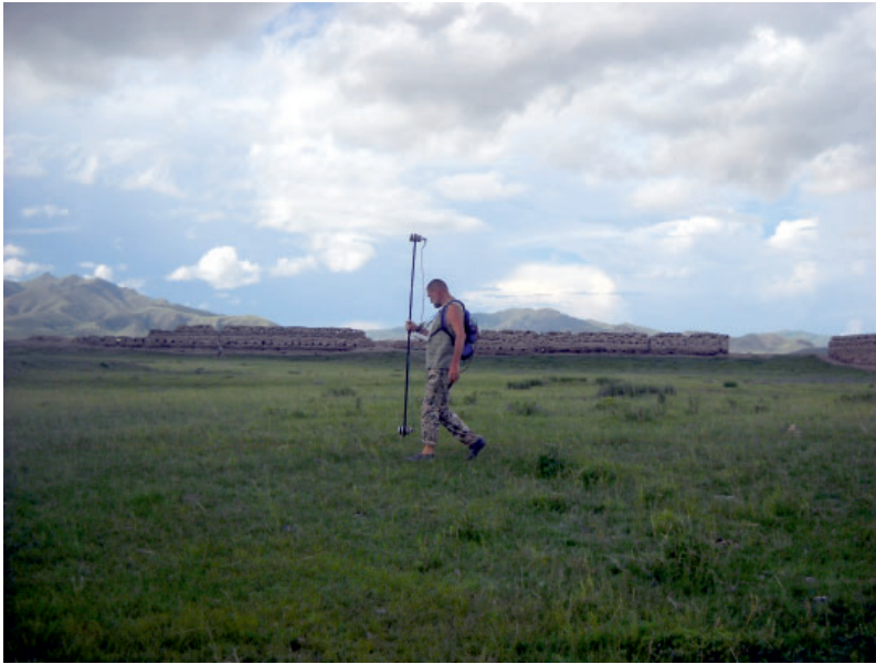
Рис. 7. Исследования северной столицы Уйгурского каганата – Бай-Балык (городище Бийбулаг), Монголия, июль 2023 г.