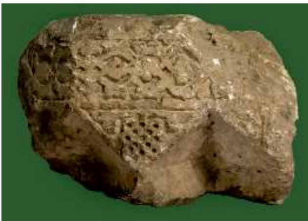
Рис. 2. Капитель каменная от мечети. Наровчатское городище. Fig. 2. Stone capital of the mosque. Narovchat settlement.

известно, этот тип преимущественно связан с болгарской земледельческой традицией, хотя изредка наконечники такого облика встречались на русских памятниках.