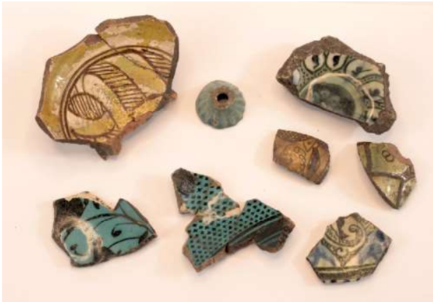
Рис.8. Фрагменты поливной посуды. Никольское селище. Fig.8. Fragments of glazed ware. Nikolskoye settlement.