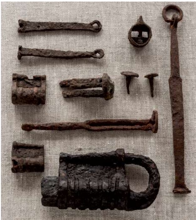
Рис. 5. Замки. Никольское селище. Fig. 5. Locks. Nikolskoye settlement.

лах Биляра, Булгара, Сараев (Руденко, 2006, с. 113).