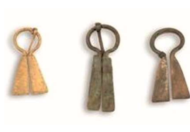
Рис. 9. Сюльгамы. Наровчатское городище. Fig. 9. Sulgams. Narovchat settlement.

ми, но и о присутствии в его составе славян. Среди привозных предметов заметное количество составляют керамические изделия. Это – сфероконусы и сосуды со штампованным орнаментом из Средней Азии, кашинная посуда с Нижней Волги и Ближнего Востока. На золотоордынских памятниках Верхнего Посурья и Примокшанья обнаружены и такие привозные изделия, как зеркала, украшения, изразцы.