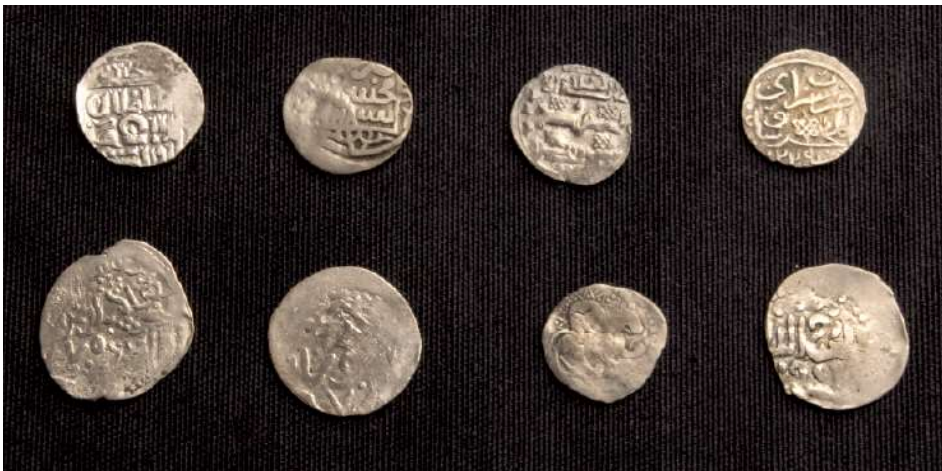
Рис. 7. Серебряные монеты. Никольское селище.