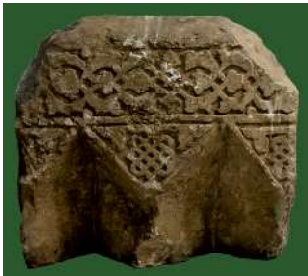
Рис. 3. Капитель каменная от мечети. Наровчатское городище. Fig. 3. Stone capital of the mosque. Narovchat settlement.

На Наровчатском городище и в его окрестностях не было встречено плужных ножей, характерных для плугов усовершенствованных форм. Однако обломок такого ножа был встречен на Никольском селище, в Верхнем Посурье, существовавшем одновременно с городом Мохши.