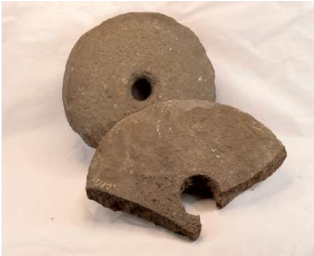
Рис. 4. Жернова каменные. Наровчатское городище. Fig. 4. Quernstones. Narovchat settlement.

О том, что в золотоордынское время в окрестностях города Мохши применялась соха, говорит находка сошной полицы на Старосотенском могильнике (Краснов, 1987, с. 181-182). Та же самая находка косвенным образом подтверждает, что в золотоордынское время в регионе продолжала существовать паровая система земледелия.