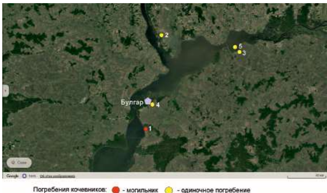
Рис. 1. Город Булгар и его кочевая округа. 1 – Бальмерский; 2 – Рождественское; 3 – Алексеевское; 4 – погребение на Бабьем бугре; 5 – на Песчаном острове.