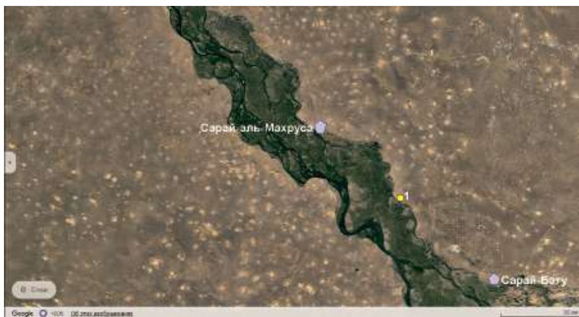
Рис. 4. Городища Селитренное (Сарай-аль-Махруса) и Красноярское (Сарай-Бату) и их кочевая округа. 1 – Дюна Лапас.