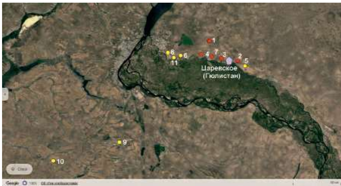
Рис. 3. Царевское городище (Гюлистан) и его кочевая округа. 1 – Ленинское; 2 – Солодовка; 3 – Царевский; 5 – I-III Бахтияровские; 6 – Заплавное; 7 – Маляевка; 8 – Кильяковка; 9 – Тингутинское; 10 – Аксай; 11 – Заяры. Fig. 3. Tsarev ancient settlement (Gulistan) and its nomadic district. 1 – Leninsk; 2 – Solodovka; 3 – Tsarev; 5 – I-III Bakhtiyarovka; 6 – Zaplavnoye; 7 – Malyaevka; 8 – Kilyakovka; 9 – Tingutinskoye; 10 – Aksai; 11 – Zayary.

Можно предположить, что именно волжское левобережье напротив Увека было основной территорией обитания кочевников, обеспечивавших город продуктами степного скотоводства на ранних этапах его существования. Как известно, Увек/Укек – один из наиболее ранних золотоордынских городов Поволжья (Недашковский, 2009, с. 211; Малов, 2018, с. 253). Поэтому до образования и расширения его сельской округи заволжская степь чисто кочевническим «доменом».