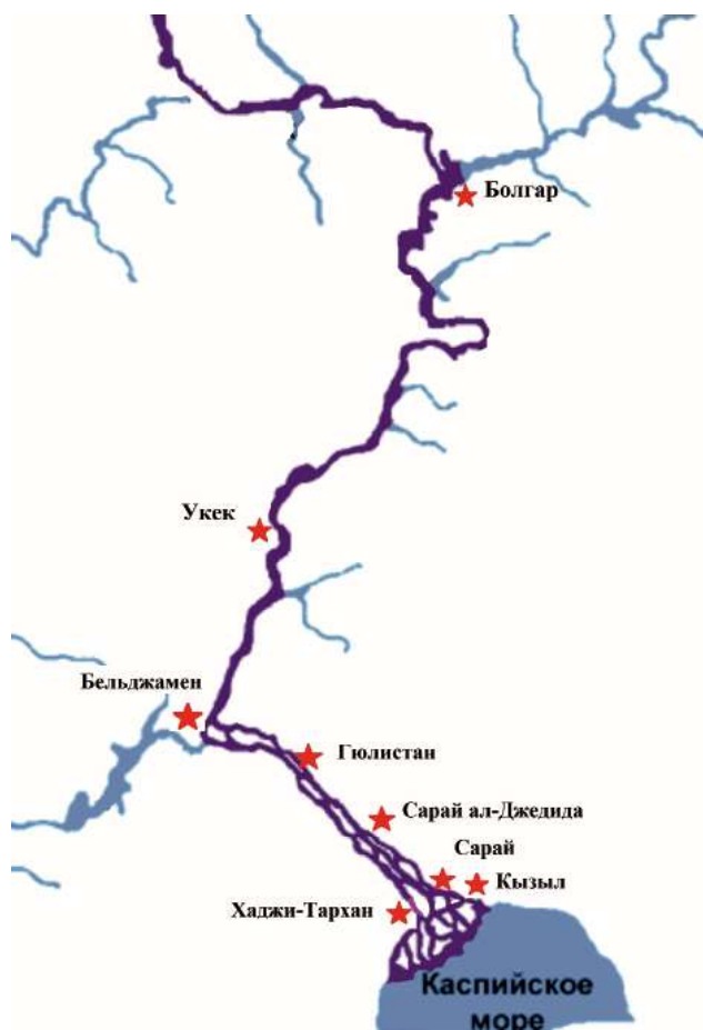
Рис. 2 Нижневолжский центр Улуса Джучи во втором периоде (1320-е гг. – начало XV в.). Fig. 2 Lower Volga center of the Ulus of Juchi in the second period (1320s – early XV century).

Общегосударственные реформы, задуманные ханом Узбеком и его сторонниками, коснулись и территории ханского домена, где им было начато строительство новой столицы Улуса Джучи – города Сарая ал-Джедиды. Кроме того, при хане Узбеке меняется традиционный маршрут перекочевки ханской орды с низовьев Волги на Северный Кавказ, из Сарая в Маджар. Это естественным образом привело к динамичному развитию на правом берегу города Бельджамен (Водянское городище) и отрицательно повлияло на развитие города Укек и его округи.