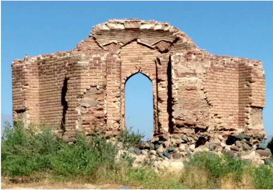
Рис. 4. Остатки восьмигранного мавзолея. Fig. 4. Remains of an eight- sided mausoleum.

прочность стены так, что в некоторых местах ширина основания стены достигает 3–4 м в зависимости от местности. Плиты толщиной до 1 м придают стене величественный монолитный вид (рис. 4; 3).