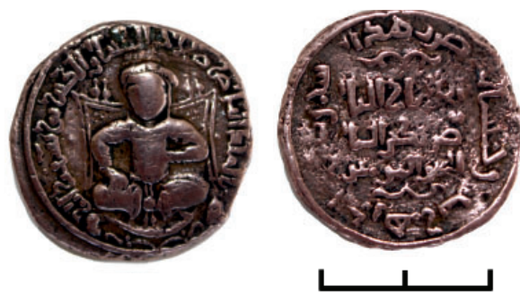
Рис. 5. Медная монета Насираддина Артука Арслана (1201–1239) из Артукидов Мардина.

В истории города Аза было много важных исторических событий – это и войны, и бедствия. Однако тяжкие периоды сменялись периодами расцвета, во время которых строились мавзолеи, шестиарочный мост и соборная мечеть, известная высоким минаретом. Город Аза, находившийся на международных