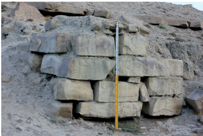
Рис. 3. Остатки оборонительной стены цитадели города Аза. Fig. 3. Remains of the defensive wall of the inner fortress of Aza.

ной 2 м, ближе к вершине замка. Северная оборонительная стена длиной 15 м является продолжением третьей восточной оборонительной стены. Она, поворачиваясь полукругом, соединяется с западной оборонительной стеной цитадели. В этой части западной оборонительной стены находится самая большая башня. Башня выступала из стены замка на отвесную сторону на 12,5 м и соединялась с другой башней с южной стороны. К второй башне с юга присоединена третья башня. Ширина первой и второй башен составляет 9 м, а ширина третьей башни – 6 м. Все башни построены из довольно крупных камней. От третьей башни оборонительная стена шириной 4 м продолжается в южную сторону на 8,2 м. Поворачиваясь на 90 градусов на восток, через 11 м она соединяется с четырехугольным помещением, стены которого шириной 1 м. Длина помещения 8,4 м, ширина 4,8 м. К югу от этой комнаты находятся остатки еще двух башен, соединенных вместе. Первая башня имеет ширину 8,2 м и длину 9,6 м, вторая башня – ширину 7,4 м и длину 10 м. Оборонительная стена между башнями имеет ширину 2 м. Причина такого плотного расположения башен в северо-западной части цитадели заключается в том, что эта часть горы относительно невысокая.