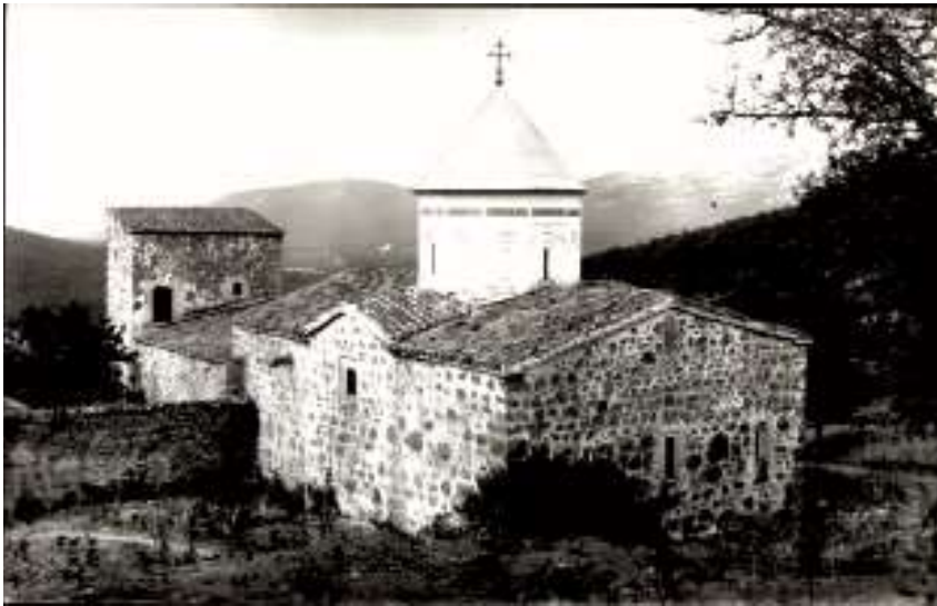
Рис. 2. Монастырь Сурб Хач. Вид на храм Сурб Ншан (1358 г.) и притвор с юго-востока. 1900-е гг.