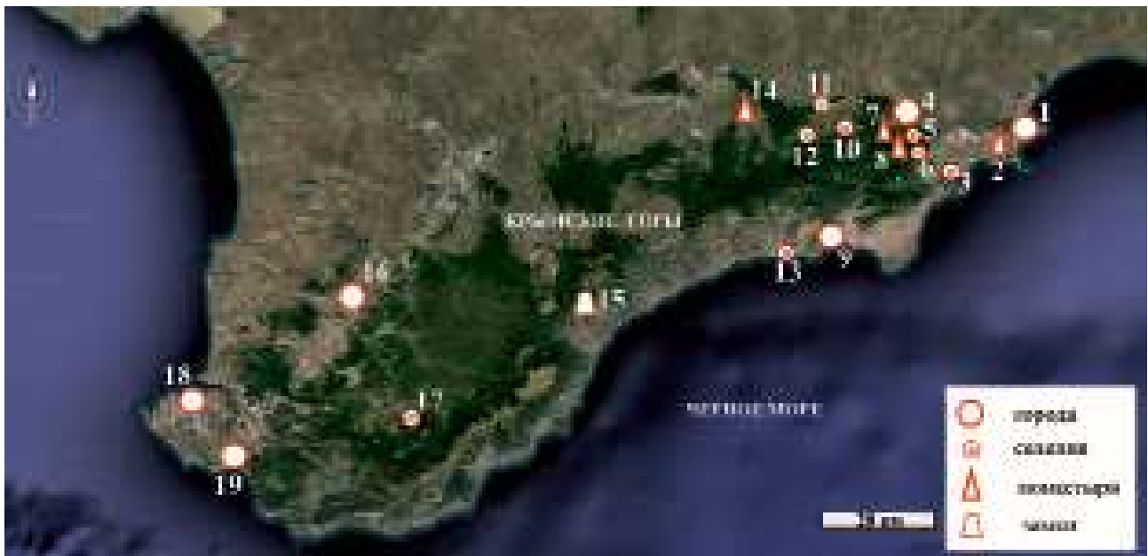
Рис. 1. Спутниковая карта Google Earth южной и юго-восточной части Крымского полуострова с указанием, упоминаемых в статье средневековых городов (1 – Каффа; 4 – Солхат-Крым; 9 – Сугдея-Солдайя; 16 – Бахчисарай; 18 – Херсон; 19 – Чембало), селений с храмами (3 – Падилкой; 5 – Эски-Юрт; 6 – Алан-Тепе 2; 10 – Сала; 11 – Кишлав; 12 – Топлы; 12 – Ай-Фока; 17 – Богатыр), монастырей (2 – св. Иоанна Предтечи; 8 – Сурб Хач; 9 – Сурб Степанос; 14 – св. Спасителя) и замков (15 – Фуна).