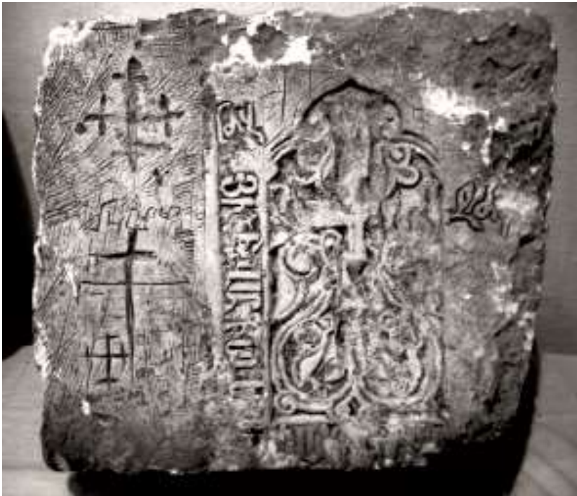
Рис. 5. Храм монастыря Сурб Степанос. Раскопки 1994 г. Строительный блок с рельефным изображением процветшего креста (хачкар) с надписью 1460 гг., врезными крестами и граффити (фонды ЛХМ). Известняк. Размеры: высота 0,33 м, ширина 0,4 м, толщина 0,24 м. Рельеф 0,2–0,3 см. Fig. 5. Church of the St. Stepanos monastery. Excavations in 1994. Building block with a relief image of a flourishing cross (khachkar) with an inscription of 1460, carved crosses and graffiti (funds of LHM). Limestone. Sizes: height 0.33 m, width 0.4 m, thickness 0.24 m. Relief is 0.2–0.3 cm.

которыми они частично были перекрыты. Прекращение функционирования последних стратиграфически привязывается к прослойке пожара, перекрывшей значительную часть двора и датированной по монетам Крымского ханства не ранее 1740 г. 13 (рис. 4: А, З). Выше нее в слое зафиксирован материал конца XVIII – XIX вв. (Домбровский, Сидоренко, 1978, с. 95–99). Выводы, сделанные учеными, подтвердились и по результатам раскопок 1993 г., проведенных Ф.С. Бабаян в верхнем ярусе центрального двора на участке, не затронутом предшествующими исследованиями. По итогу работ в толще культурных напластований было выделено два самостоятельных слоя. В верхнем из них залегала