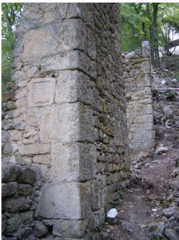
Рис. 1 Вид на «надпись топотирита». Fig. 1. View of the “topoteretes’ inscription”.

надпись IOSPE 3 V 172. Она находится in situ на западной стене (внешняя сторона) башни укрепления А.ХІ (Главная линия обороны) в балке Табана-Дере (рис. 1; 2; 3) 1 . Греческий текст надписи гласит (в нормализованной орфографии): + Ἐκτίσθη ὁ τῦχος [sc. τοῖχος] τ(οῦ)τος ὑπὸ ἡμερῶν [sc. ἡμερῶν] τ[ο]πτηρίτου Τζουλαβηγη υ(ιο)ῦ Πολετα. Ἔτος ,ζωγ´ [resp. ,ζωγ´] :— Перевод: «+ Построена эта стена во дни топотирита Цулавиги, сына Полеты. Год 6503 [или 6803]».