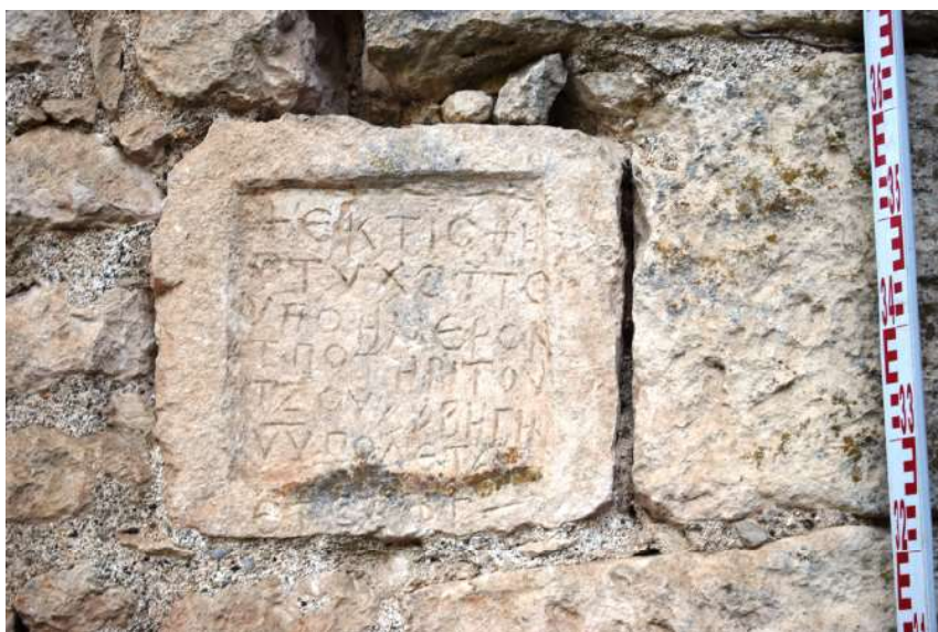
Рис. 2. «Надпись топотирита».