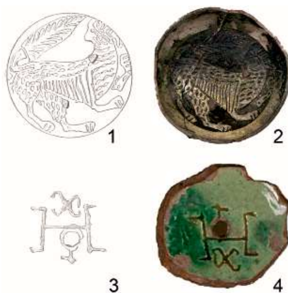
Рис. 2. Поливная керамика из раскопок скита на м. Виноградный. 1, 3 – прорисовки 1896 г. (по К. К. Костюшко-Валюжиничу); 2, 4 – фото из коллекции Государственного Эрмитажа (по В. Н. Залесской).

В то же время отдельного рассмотрения заслуживают письменные источники, отчетливо фиксирующие разрушение города в конце XIII в., наиболее полно рассмотренные А.И. Айбабиным (Айбабин, 2022, с. 55–66) и В.Л. Мышом (Мыщ, 2016, с. 73–78). Слои пожара XIII в., фиксирующиеся на большей части городища, с начала XX в. исследователи связывали с одним из исторических событий того периода, из чего и следовали дальнейшие интерпретации событий истории Херсона. В рамках данной работы выдвигается гипотеза о наличии двух слоев разрушения Херсонеса в третьей и четвертой четвертях XIII в. В качестве иллюстрации слоев, предположительно связанных с разрушением 1298/9 г., можно предложить первый (после современных напластований) и второй слои помещения № III из раскопок И.А. Антоновой 1966 г. у внутренней стороны оборонительной стены портового района. Первый слой представлял собой остатки разрушения оборонительной стены над уровнем выявления помещений, и, согласно отчету, представленные на иллюстрации сосуды, кроме двух-трех фрагментов, «характерны для самых поздних лет существования Херсонеса» (Антонова, 1966, л. 20). В иллюстрациях отчета (рис. 2: 1, 2) представлены две группы материалов. Первая