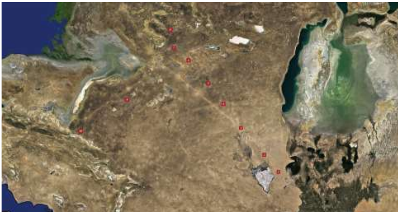
Рис. 1. Расположение караван-сараев Устюрта. 1 – Учкудук; 2 – Ажикелди; 3 – Косбулак; 4 – Белеули; 5 – Чурук; 6 – Кусшы; 7 – Коптам; 8 – Коскудук; 9 – Уали; 10 – Ман ата.