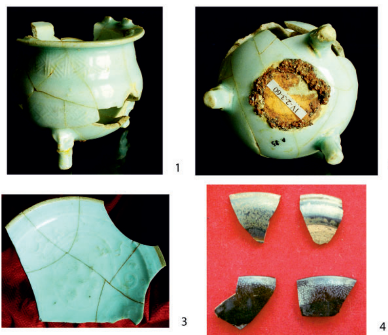
Рис. 4. Образцы глазурованной посуды из чжурчжэньских памятников Восточного Ся в Приморье: 1,2 – фарфоровый трипод сорта иньцин из Ананьевского городища; 3 – тарелка сорта иньцин из Шайгинского городища; 4 – фрагменты чашек сорта цзяньяо (теммоку) из Шайгинского городища