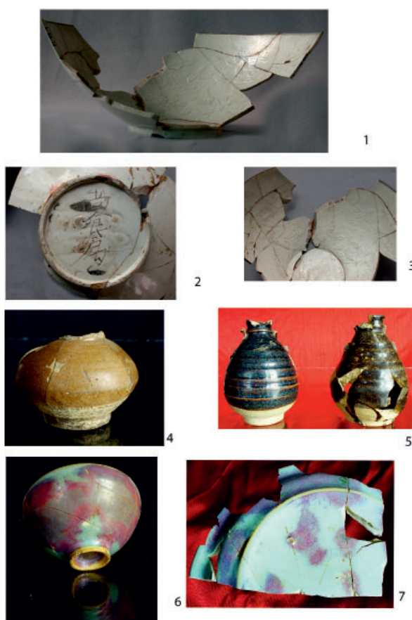
Рис. 2. Образцы глазурованной посуды из чжурчжэньских памятников Восточного Ся в Приморье: 1-3 – чаша сорта диньяо из Ананьевского городища; 4 – миниатюрный сосуд с коричневой глазурью из Ананьевского городища; 5 – образцы темноглазурованной керамики из Ананьевского (слева) и Красноярского (справа) городищ; 6,7 – чаша и блюдо сорта цзюньяо из Ананьевского городища Fig. 2. Samples of glazed ceramics from the Jurchen sites of the Eastern Xia in Primorye: 1-3 – bowl of the Ding wares from the Ananyevka hillfort; 4 – miniature vessel with brown glaze from the Ananyevka hillfort; 5 – samples of dark-glazed vessels from the Ananyevka (left) and Krasny Yar (right) hillforts; 6,7 – bowl and dish of the Chün wares from the Ananyevka hillfort

около 30% от всех глазурованных изделий из памятников Восточного Ся (Гельман, 1999). На Ананьевском и Шайгинском городищах они найдены в каждом четвертом жилище. Наиболее часто встречались бутылевидные небольшие сосуды и горшочки с двумя ручками, миниатюрные шаровидные сосуды, реже чаши и блюда, кувшины, вазы, бутылевидные сосуды, корчажки и корчаги (рис. 2: 4, 5). Темноглазурованная посуда как сопутствующая продукция выпускалась в разных печах: Гуаньтайяо провинции Хэбэй (где выпускалась в основном продукция цычжоу), Цыцуньяо провинции Шаньдун, Гангуаньтунь провинции Ляонин и др. Поэтому эти изделия сложно относить к тем или иным печам, но значительная доля небольших бутылевидных сосудов с ручками и горшочки с открытым устьем встречались в печах Гуаньтайяо (Печи цычжоу, 2009).