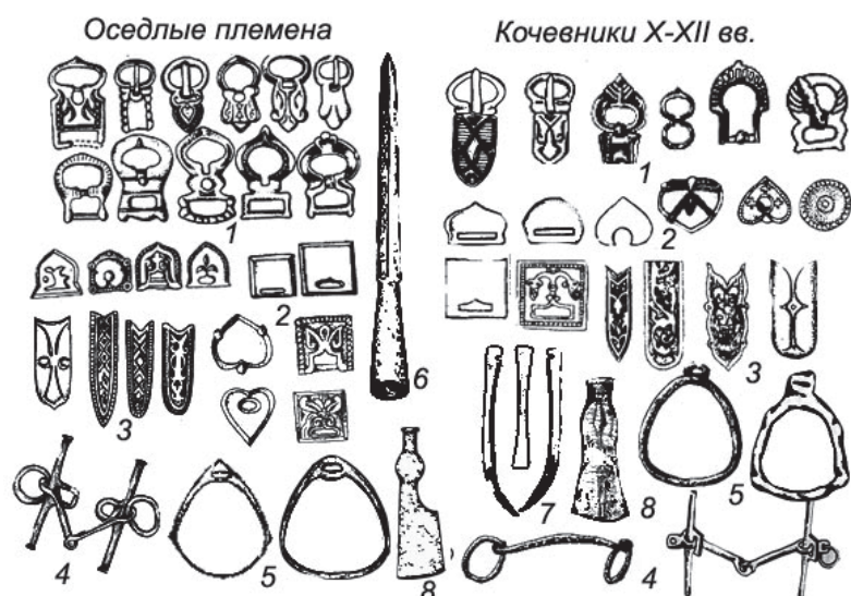
Рис. 1. Похожие элементы материальной культуры финнов, финно-пермяков и кочевников (печенегов, огузов, кипчаков/половцев) Волго-Уралья X–XII вв.

1 – поясные пряжки; 2 – поясные накладки; 3 – наконечники ремня; 4 – удила; 5 – стремена; 6 – копьё (пика); 7 – костяные накладки лука; 8 – топор.