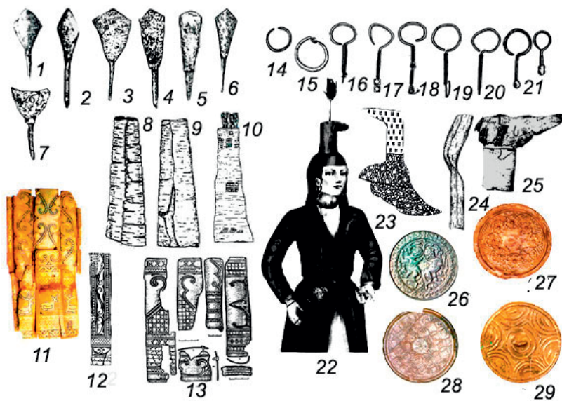
Рис. 3. Элементы «имперской культуры» Золотой Орды XIII-XIV вв. 1-7 – наконечники стрел-срезни; 8-10 – берестяные колчаны; 11-13 – костяные накладки колчана; 14-21 – серьги; 22-23 – реконструкция головного убора – бокка; 24-25 – детали бокка; 26-29 – бронзовые зеркала.

Fig. 3. Elements of the Golden Horde "imperial culture" of the XIII-XIV centuries. 1-7 – heads of cutting arrows; 8-10 – birch bark quivers; 11-13 – bone plate of the quiver; 14-21 – earrings; 22-23 – reconstruction of the headdress – Gugu hat; 24-25 – details of the Gugu hat; 26-29 – bronze mirrors.