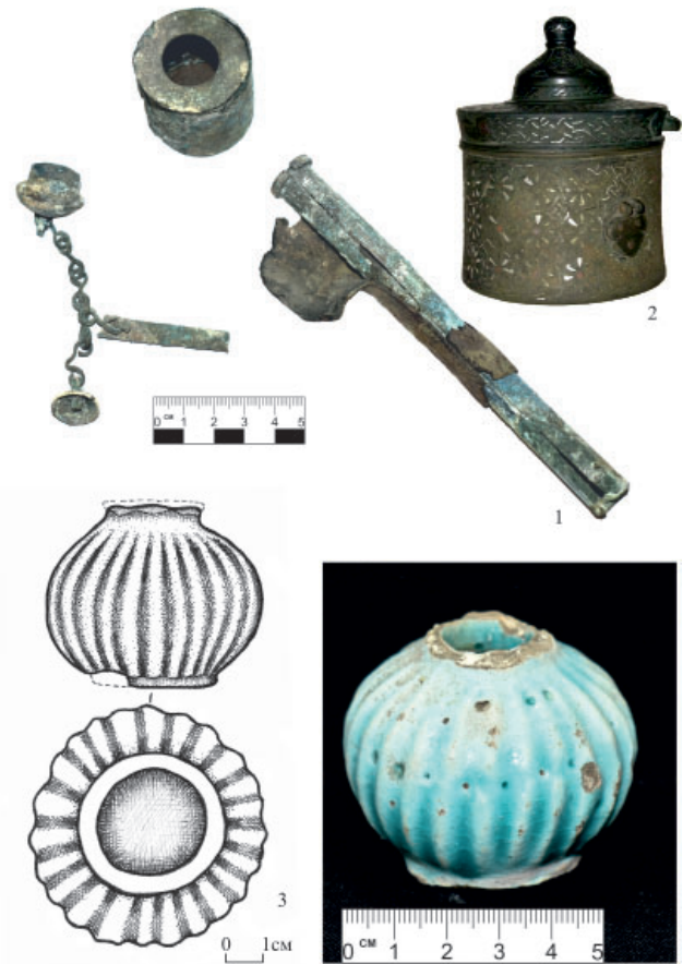
Рис. 3. 1 - набор писца из Свердловского КМ (Тептяри). Курган 6, погребение 5; 2 - чернильница найденная в окрестностях д. Карышкино Баймакского района Республики Башкортостан (Гарустович, Валиулин, 2008); 3 - чернильница обнаруженная на развалинах мавзолея (курган - 5) курганного могильника 3 у с. Озерки.

Наличие письменных принадлежностей, обнаруженных в мавзолеях,шний раз подтверждает, что кирпичные мемориаль-