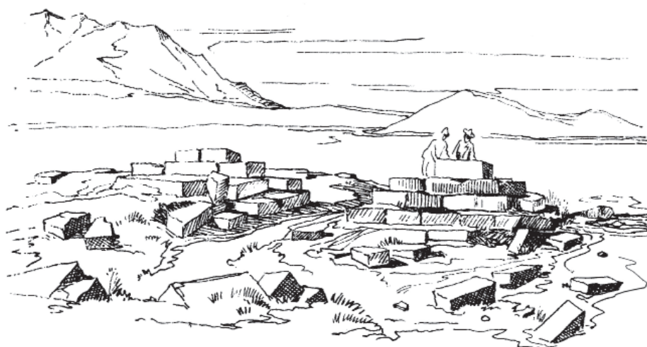
Рис. 1. Акыртас. Рисунок М.С. Знаменского. Fig. 1. Akyrtas. Drawing by M.S. Znamensky.

щениями и тремя айванами, и хозяйственную, состоящую из пяти узких длинных помещений. Третья часть представляет собой 13 помещений вокруг двора. Четвертая часть – жилая, состоит из 18 комнат, двух айванов и трех узких помещений (Байпаков, 2018, с. 124–125).