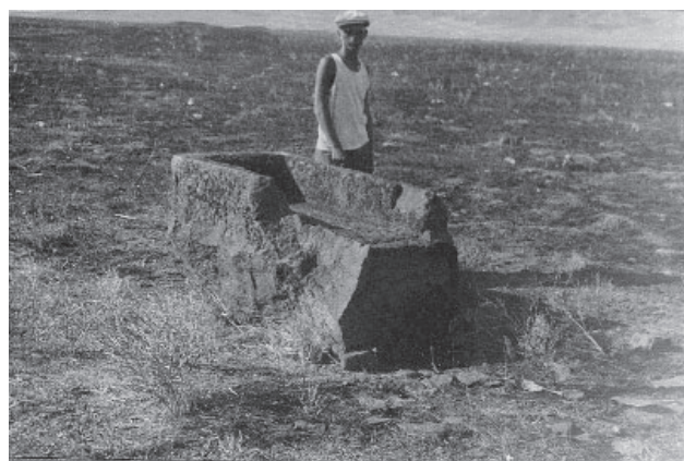
Рис. 3. Каменное корыто. Fig. 3. Stone basin.

Исследователь архитектуры Средней Азии и Ближнего Востока С.Г. Хмельницкий поддерживал точку зрения Б. Брентьеса о том, что Акыртас строился по западно-исламскому образцу и являлся резиденцией Кутейбы. «В любом случае Акыр-Таш нельзя признать ни доисламским храмом или буддийским монастырем, ни караван-сараяем», – писал ученый (Хмельницкий, 1992, с. 214–216).