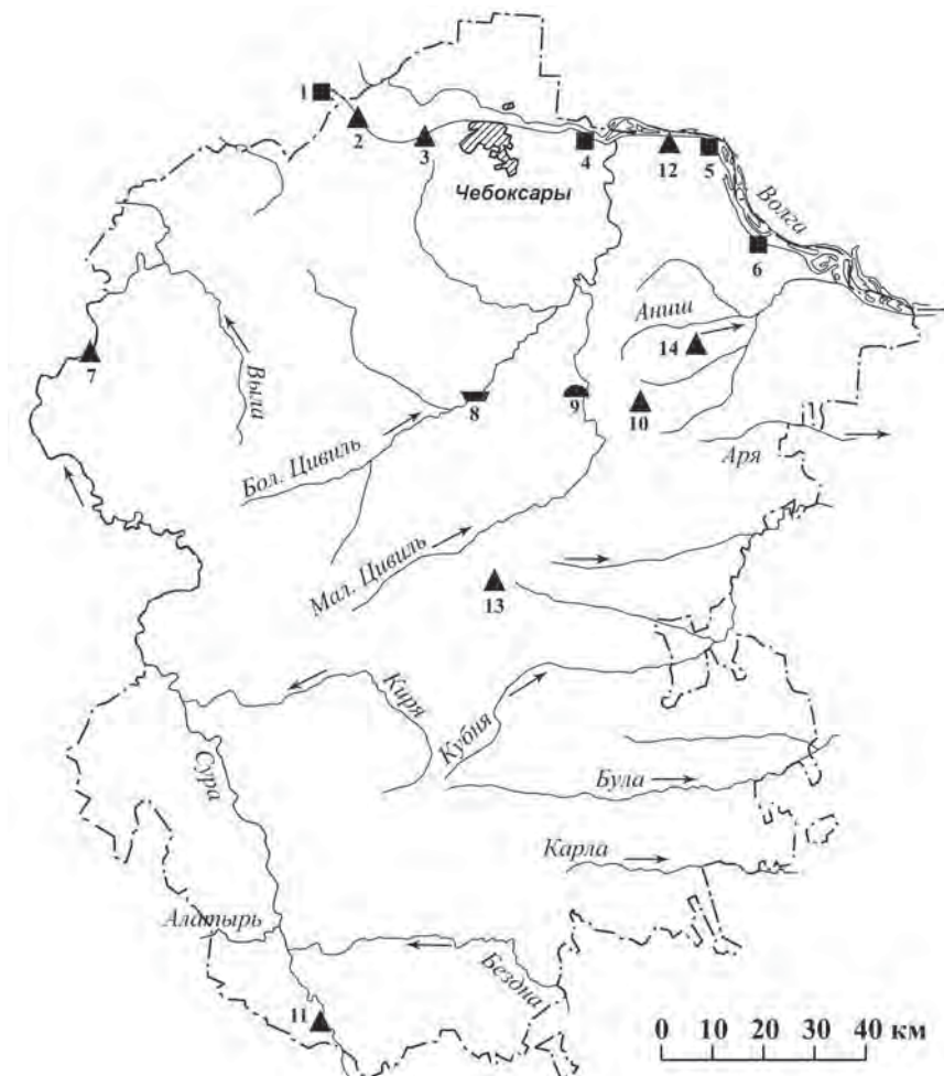
Рис. 1. Карта случайных находок и археологических памятников АКЦИО Чувашии: 1 – г-ще Малахай; 2 – Шашкарская пристань; 3 – пос. Сюктерка; 4 – Ельниковское г-ще; 5 – Демёшкинское г-ще; 6 – Карабашское (Звениговское) г-ще; 7 – Питишевское г-ще; 8 – Убеевский м-к; 9 – Чурачикский курган; 10 – д. Тюлькой; 11 – Макеевское селище; 12 – Мариинско-Посадский р-н; 13 – д. Нов. Чурашево; 14 – д. Андреево-Базары.