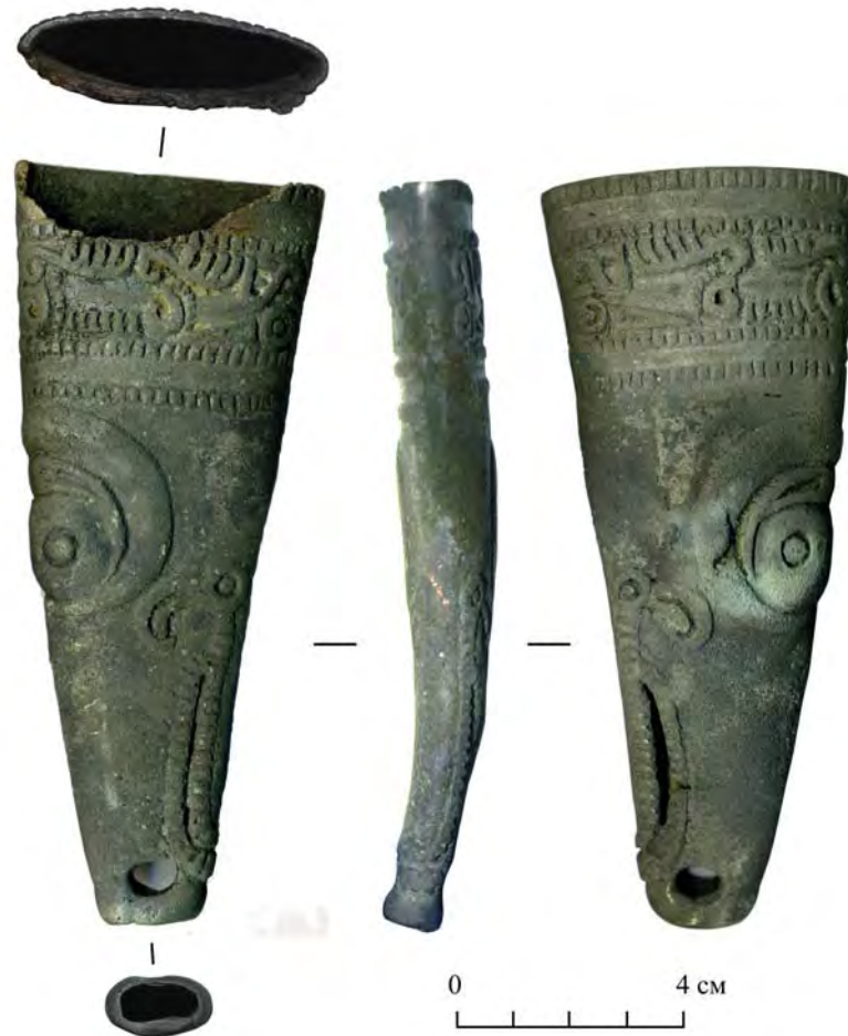
Рис. 4. Ножны, найденные у д. Андреево-Базары (?).