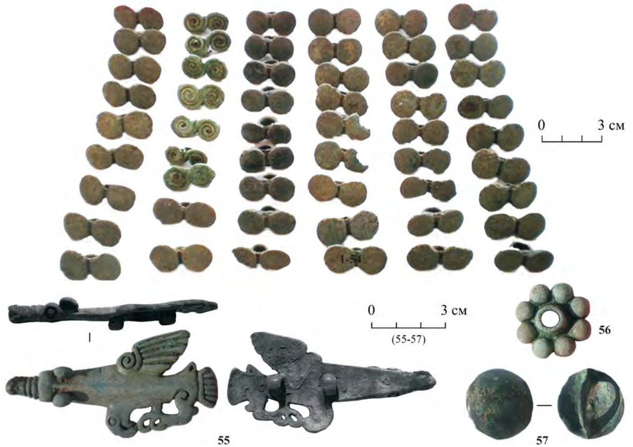
Рис. 3. Поясной набор (?), найденный у д. Нов. Чурашево (?).