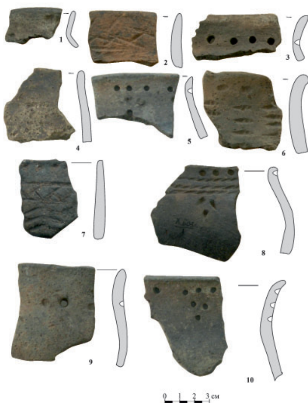
Рис. 7. Керамика постмакласhevской культуры. Fig. 7. Ceramics of the post-Maklashevka culture.

коллекции памятника составляет 1,5 %. Эта керамика характеризуется наличием органики в составе формовочной массы и орнаментом, выполненным гладким штампом. В декоре посуды луговской культуры Базяковской X стоянки чётко выражен мотив косой решётки (рис. 6: 2). Толщина стенок сосудов составляет 0,7 см.