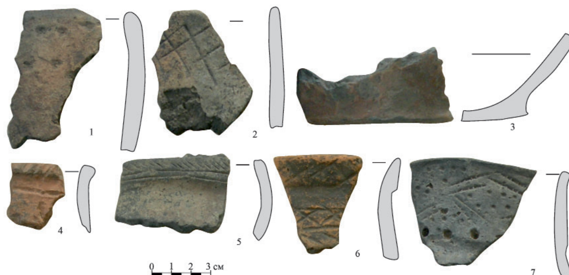
Рис. 6. Керамика эпохи бронзы: 1 – срубной культуры; 2 – луговской культуры; 3-6 – атабаевского этапа маклашевской культуры; 7 – маклашевского этапа маклашевской культуры. Fig. 6. Bronze Age ceramics: 1 – Srubnaya culture; 2 – Lugovoye culture; 3-6 – Atabayevo phase of the Maklashevka culture; 7 – Maklashevka phase of the Maklashevka culture.

на внешней стороне, которой присутствует фрагментарная отжимная краевая ретушь (рис. 4: 6).