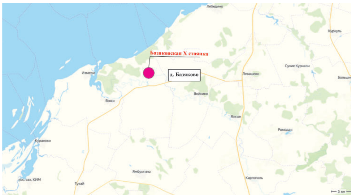
Рис. 1. Расположение Базяковской X стоянки на карте Республики Татарстан.