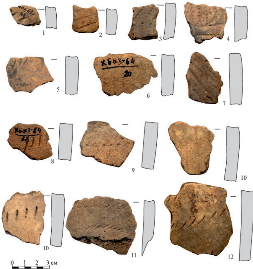
Рис. 3. Керамика камской неолитической культуры (продолжение). Fig. 3. Ceramics of the Kama Neolithic culture (continuation).