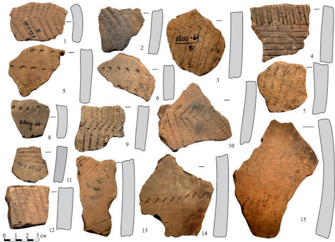
Рис. 2. Керамика камской неолитической культуры. Fig. 2. Ceramics of the Kama Neolithic culture.