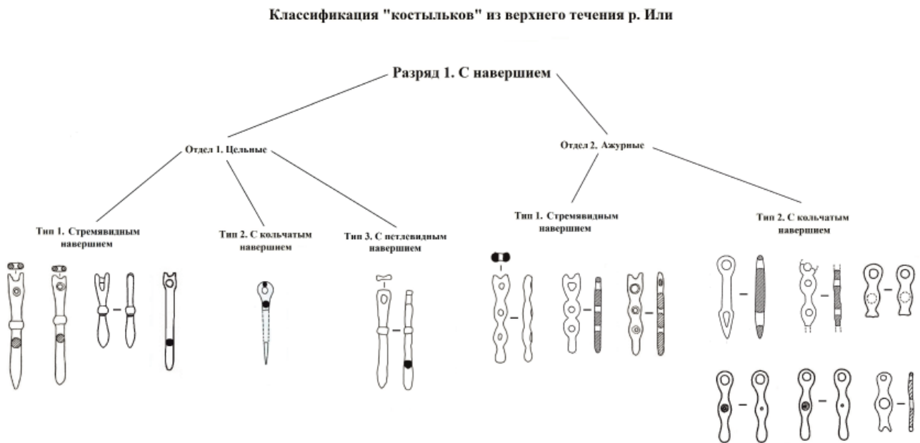
Рис. 2. Классификация металлических костыльков из сакских погребальных памятников из района верхнего течения реки Или