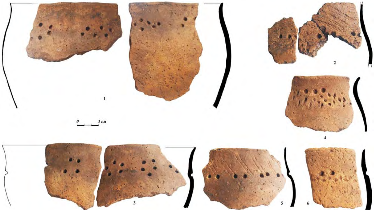
Рис. 2. Керамика Андреевского селища. Сборы А.П. Шокурова 1958 г. Октябрьский краеведческий музей.