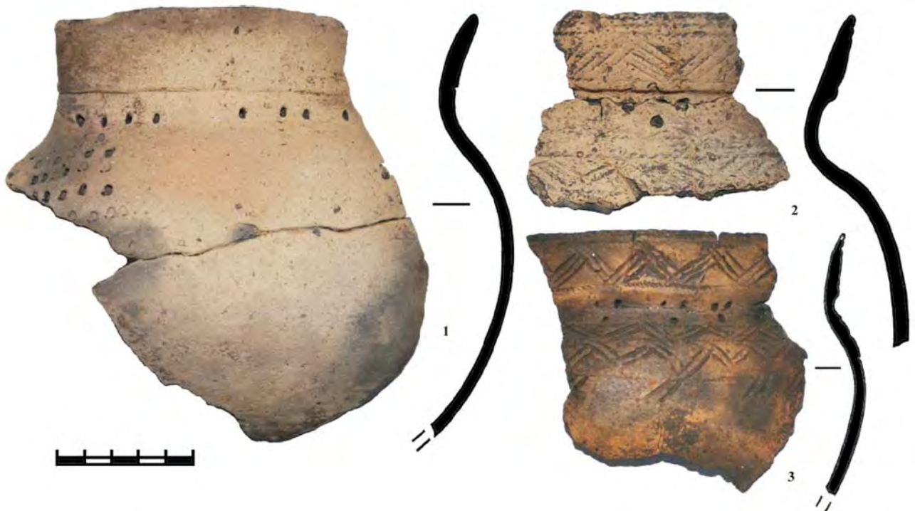
Рис. 4. Керамика Ново-Байрамгуловского I (Бакшай) поселения (по: Рафикова, 2013).