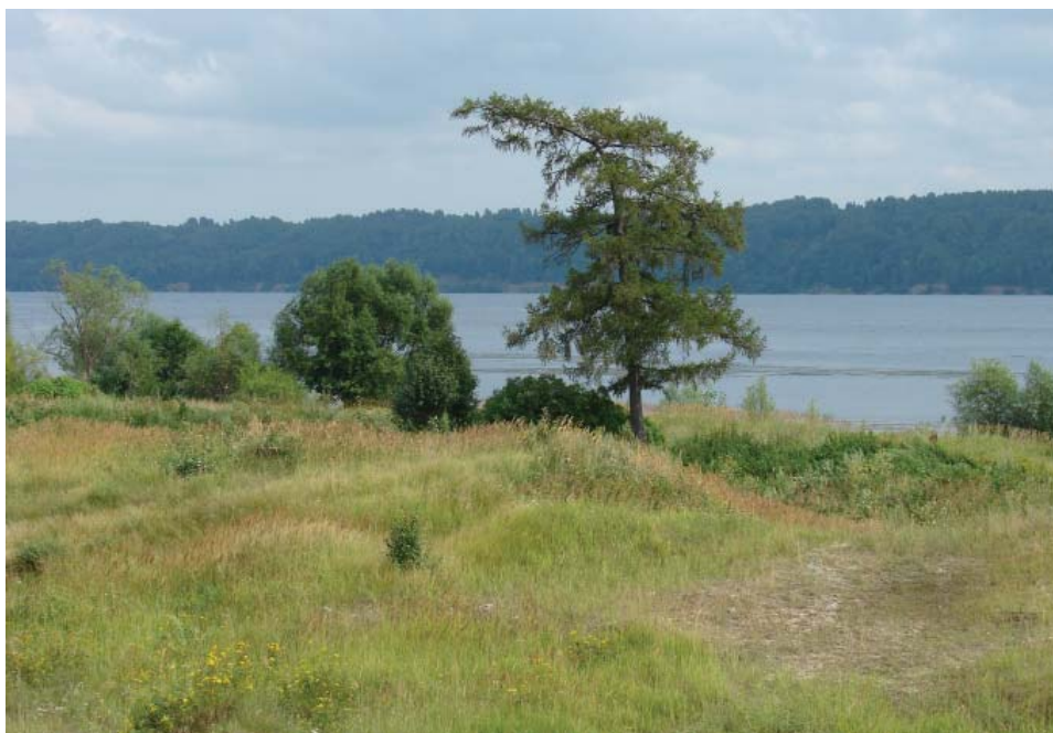
Рис. 1. Дюна «Красный Выселок». Общий вид с северо-запада.

Shalakhov Evgeny G. Sheremetev Castle State Budgetary Institution of Culture of the Republic of Mari El (Yurino, Republic of Mari El, Russian Federation); shalahof@yandex.ru