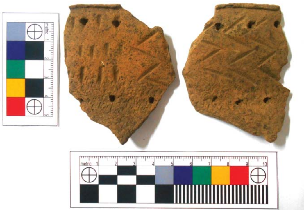
Рис. 3. Фрагменты верхней части сосуда с «текстильными» отпечатками на поверхности. Археологическая коллекция Юринского музея (№ 1101/1-2).