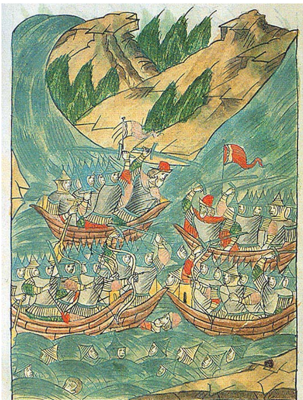
Рис. 9. Речное сражение между флотами русских и казанцев. 1467 г. Миниатюра Лицевого летописного свода. Вторая половина XVI в. РГАДА.