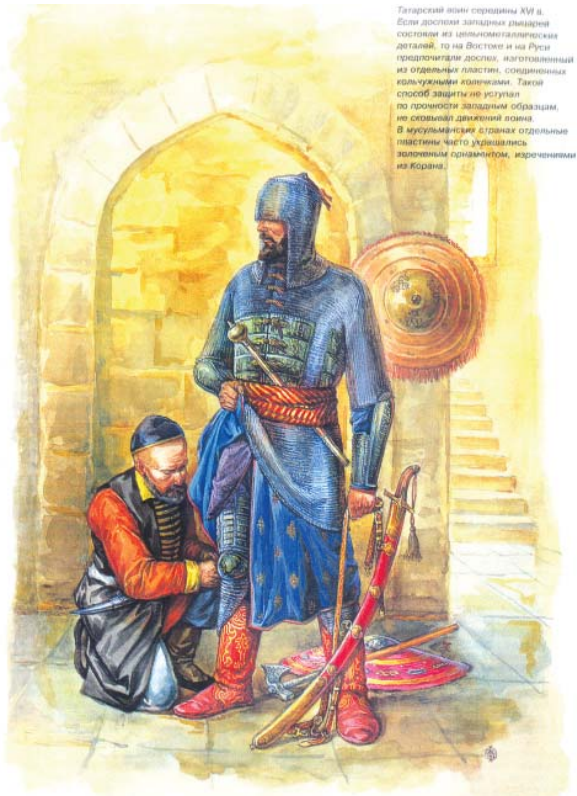
Татарский воин середины XVI в. Если доспехи западных рыцарей состояли из цельнометаллических деталей, то на Востоке и на Руси предпочитали доспехи, сложенные из отдельных пластин, соединенных кольчужными или цепными. Такой способ защиты не уступал по прочности западным образцам, но скрывал движения воина. В мусульманских странах отдельные пластины часто украшались золоченой орнаментикой, изречениями из Корана.