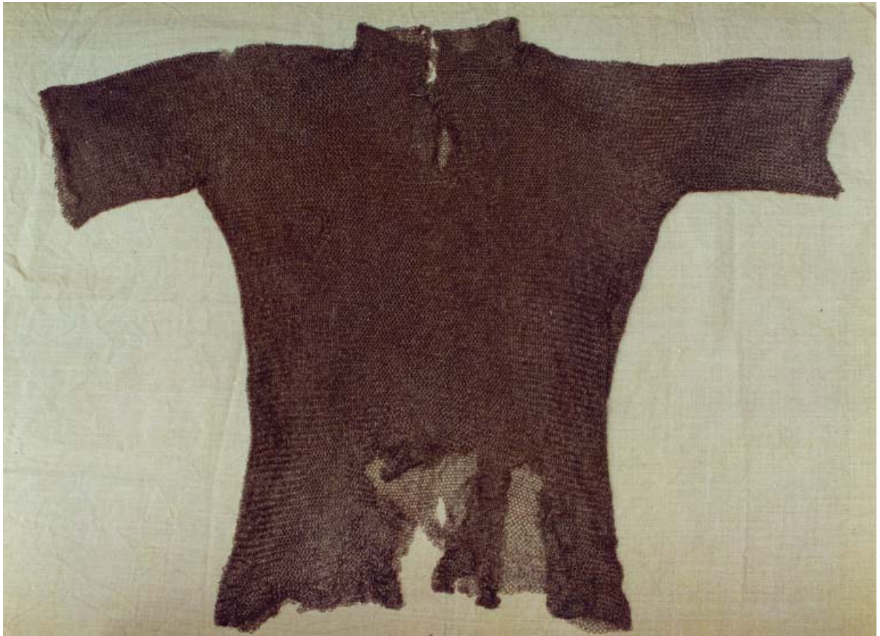
Рис. 4. Кольчуга. XVI-XVII вв. Поволжье. НМ РТ.