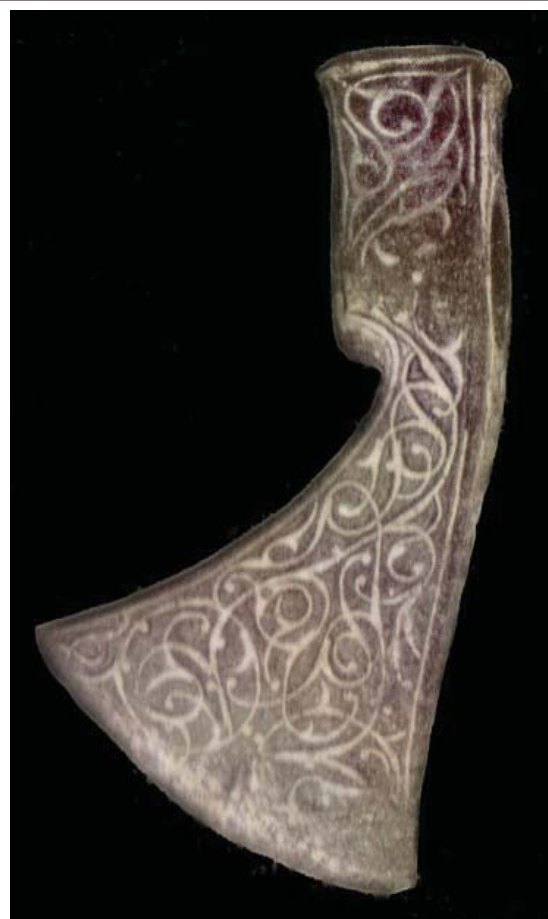
Рис. 2. Парадный орнаментированный топорик. XV-XVI вв. Казанское ханство. НМ РТ.