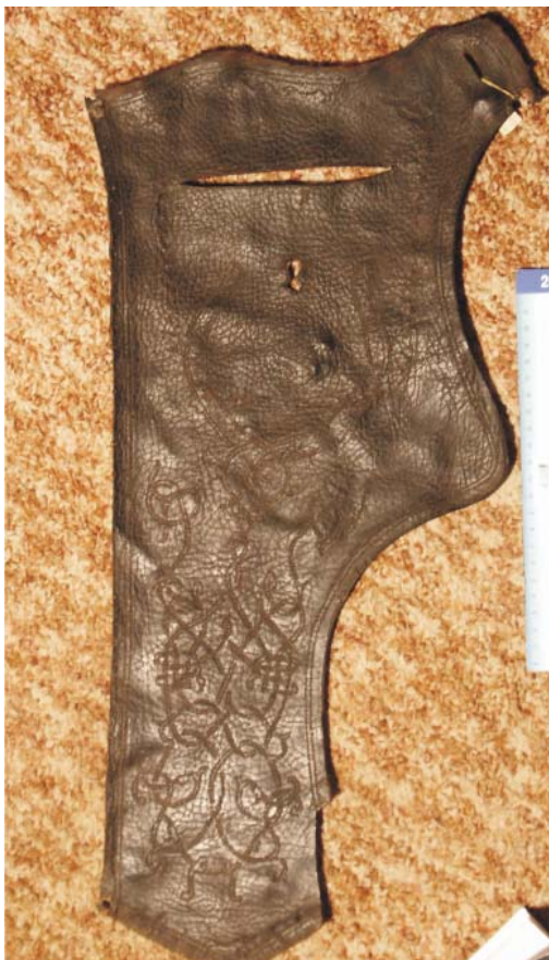
Рис. 5. Саадак. Узорная кожа. Казанский Кремль. XV-XVI вв. Раскопки Н. Набиуллина.