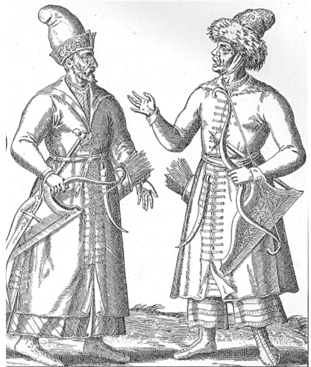
Moscovita habitu militari. Tartarus gentili more armatus