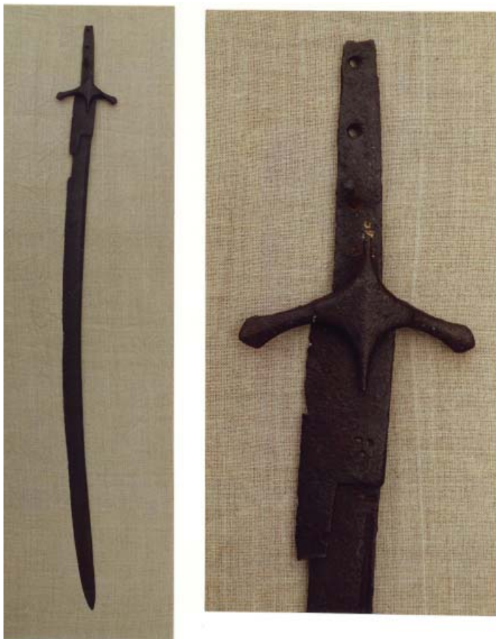
Рис. 1. Сабля. XV-XVI вв. Поволжье. НМ РТ.