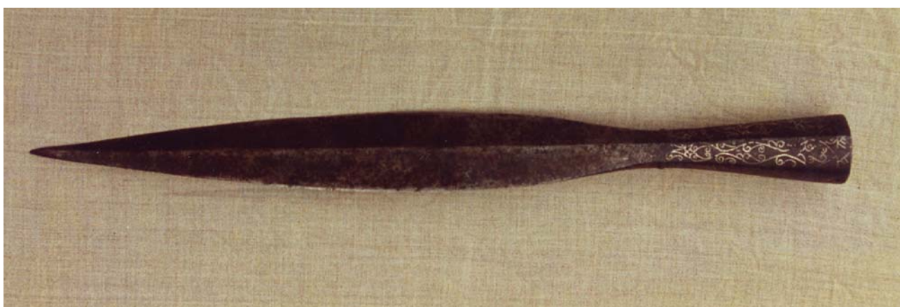
Рис. 3. Рогатина. XV-XVI вв. Казанское ханство. НМ РТ.