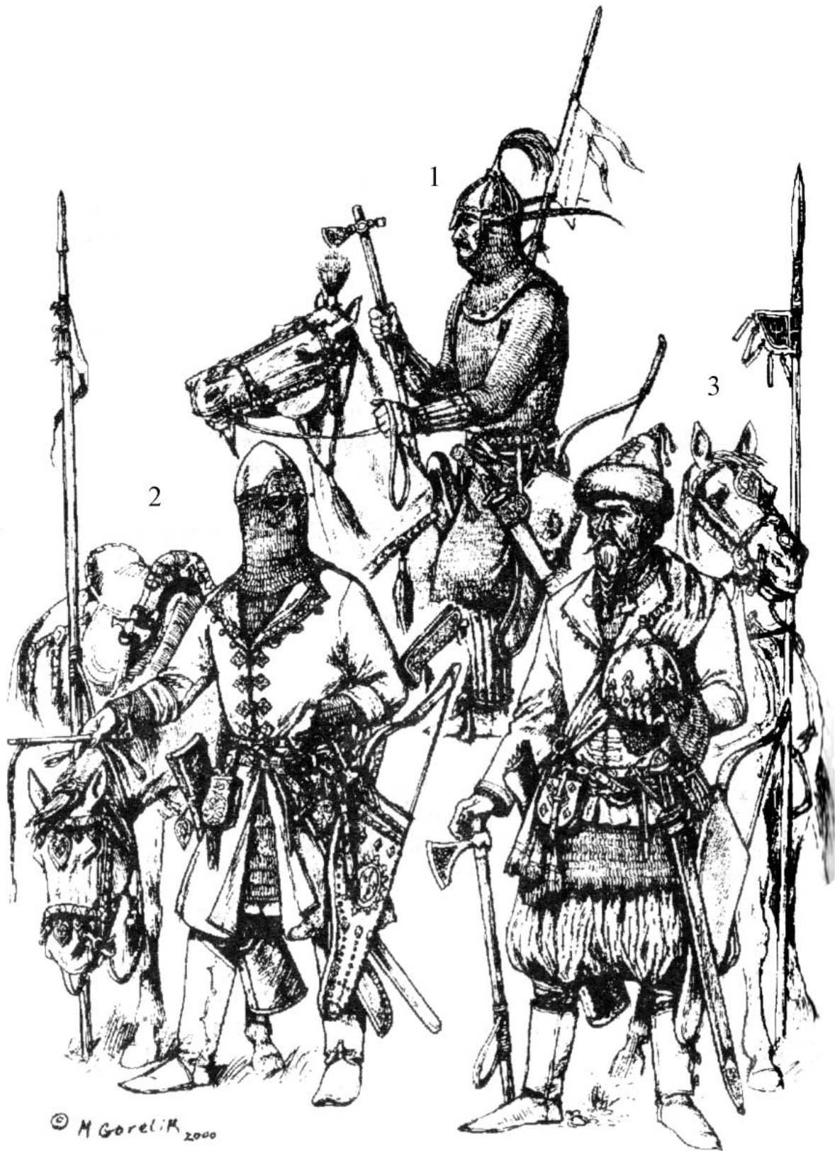
Рис.3. Знатные воины Среднего Поднепровья кон. IX – 1-й пол. X вв. (реконструкция и рисунок М.В. Горелика): 1 – кабарский воин; 2 – венгерский воин; 3 – воин-рус.