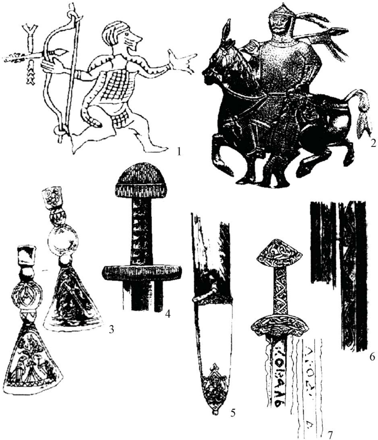
Рис.2 Изображения кабарских воинов и оружие Кабарии – Угри – Руси: