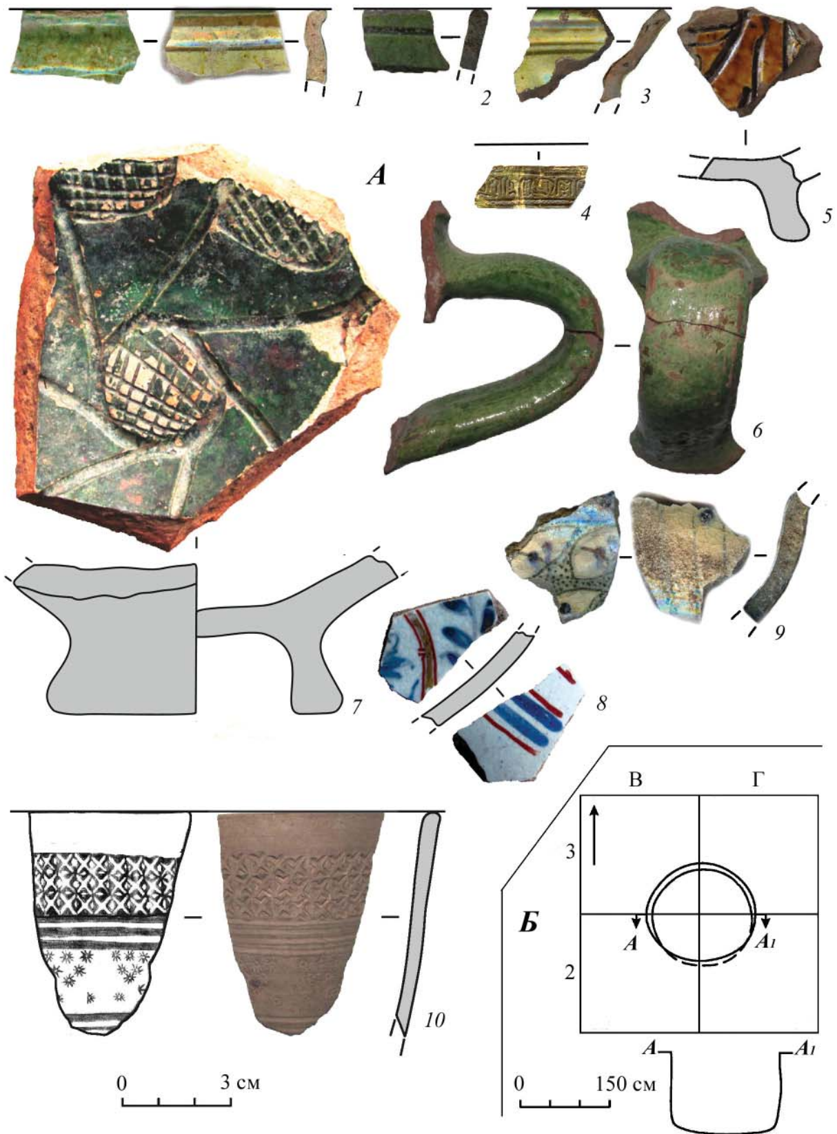
Рис. 2. Ратский археологический комплекс. А – находки. 1–3, 9 – раскоп 1, культурный слой; 4 – подъемный материал; 5, 6, 10 – раскоп 1, яма 4; 7, 8 – раскоп 2, культурный слой; Б – раскоп 1, яма 4. 1–3, 5–10 – керамика, 4 – бронза.