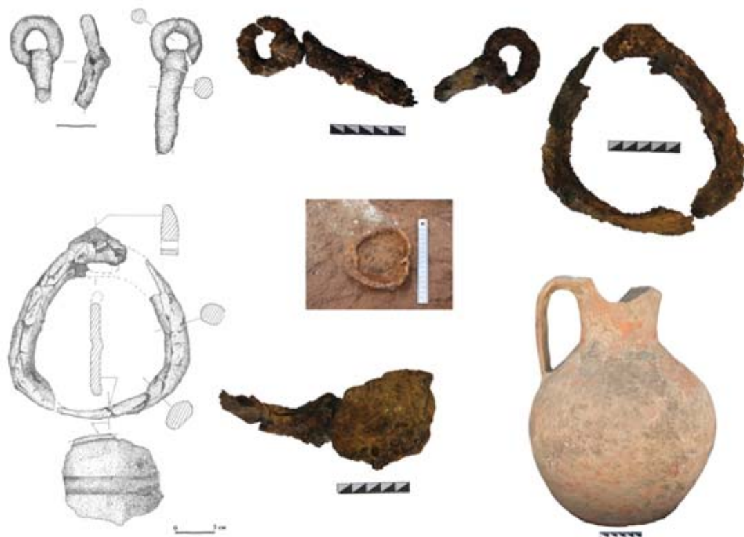
Рис. 4. Погребальный инвентарь погребения 1, кургана 3: удила, стремена, кувшин.