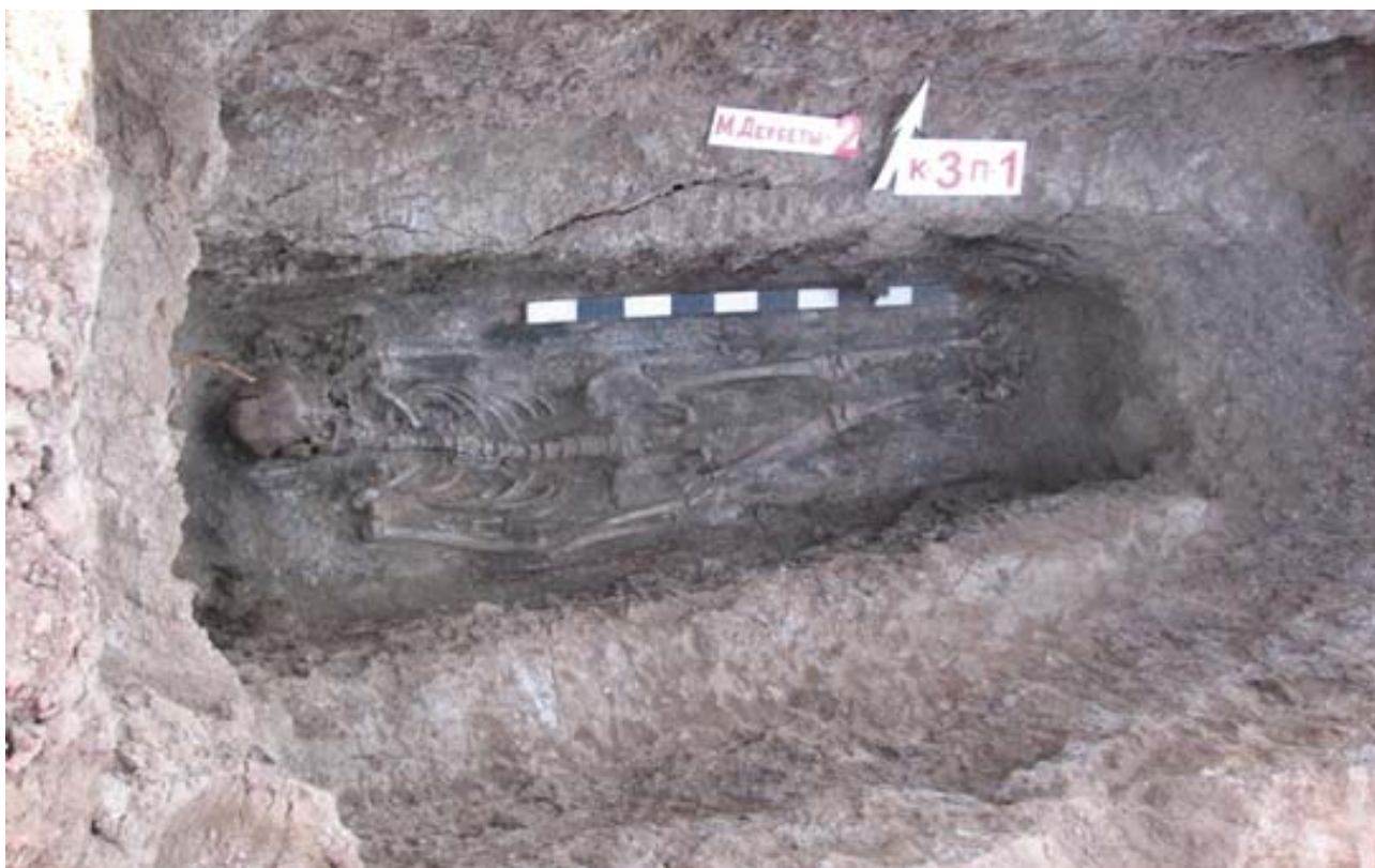
Рис. 3. Курган 3, погребение 1.