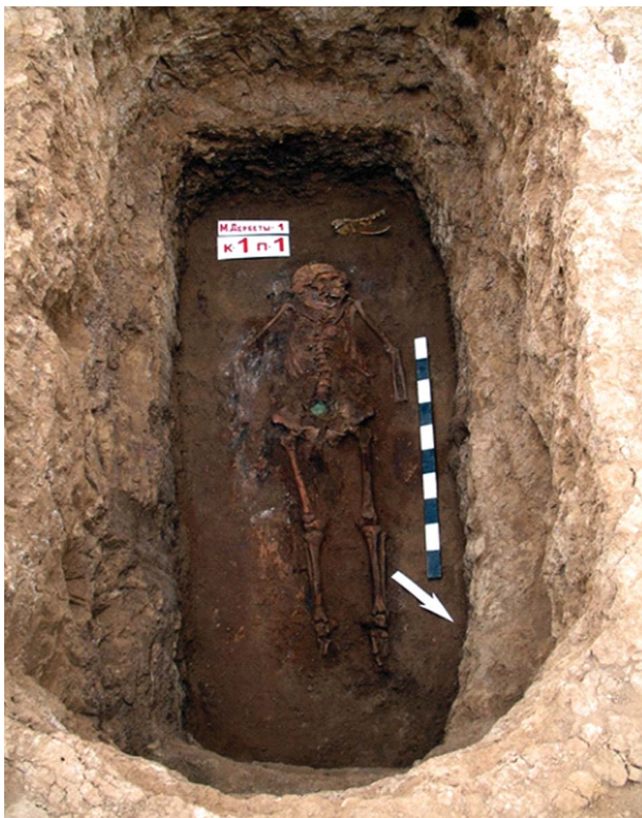
Рис. 1. Курган 1, погребение 1.