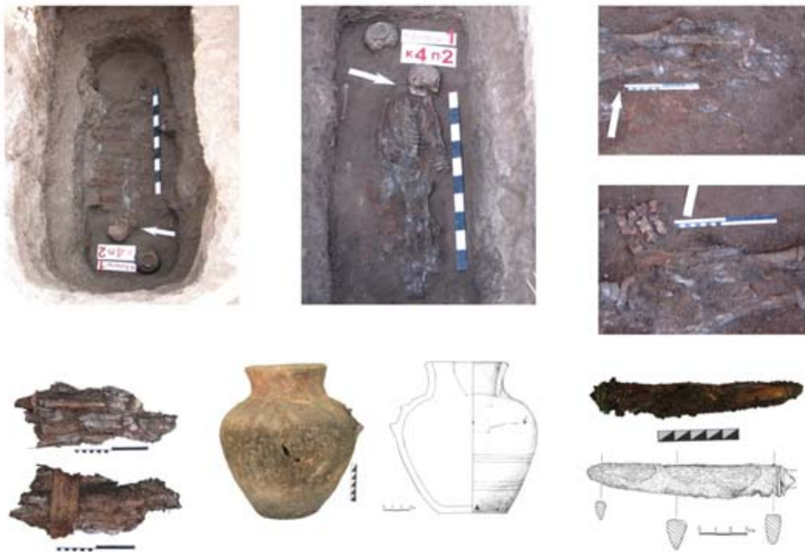
Рис. 7. Погребальный инвентарь погребения 2, кургана 4.