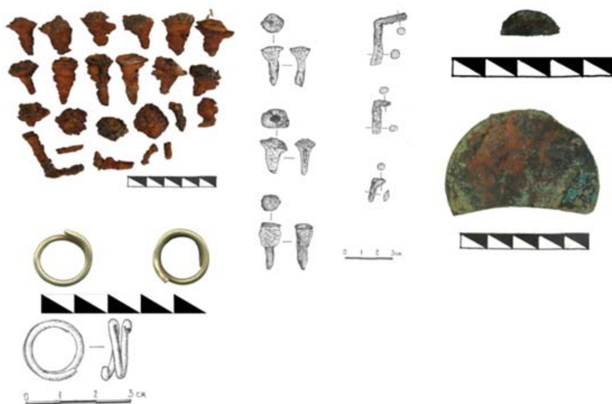
Рис. 2 Курган 1, погребение 1: железные гвоздики, бронзовое зеркало, серьги.