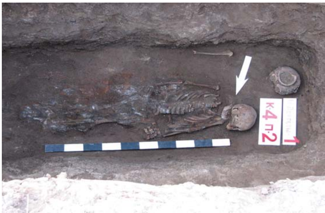
Рис. 6. Курган 4, погребение 2.