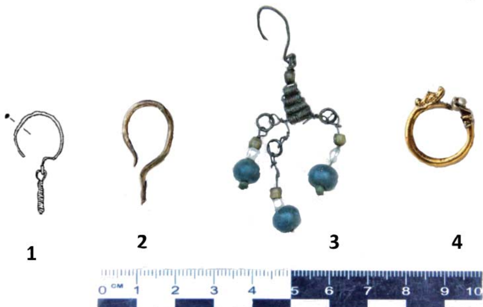
Рис.2. Ювелирные изделия из раскопок крепости Чембало.