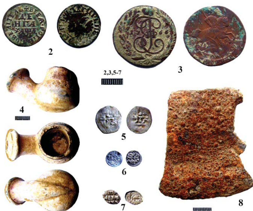
Рис. 1. Поселение «Суворовская поляна»: 1 – карта окрестностей Красного леса (1 – место расположения поселения), 2–8 – предметы из поселения, случайные находки; 2,3 – бронза, 4 – керамика, 5–7 – серебро, 8 – железо.