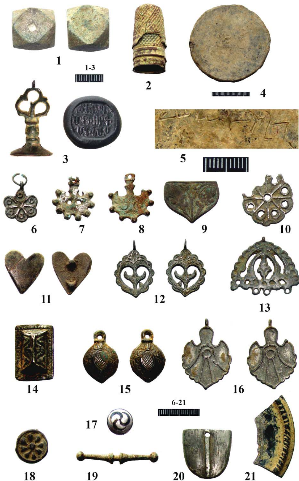
Рис. 2. Поселение «Суворовская поляна»: 1–21 – предметы из поселения, случайные находки; 1,4 – свинец, 2,3,5–16,18–21 – бронза, 17 – серебро.