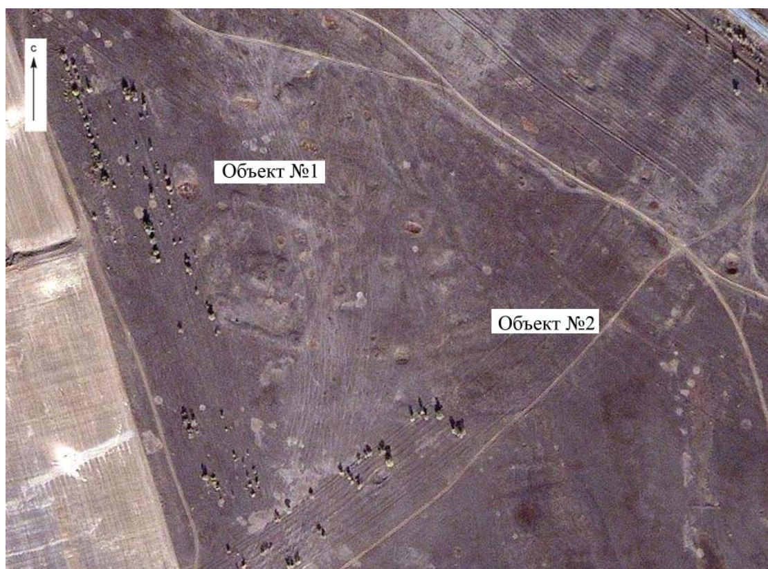
Рис.1. Объект №1 (“дом с бастионами”) и объект №2 на космоснимке части территории Зубовского городища.