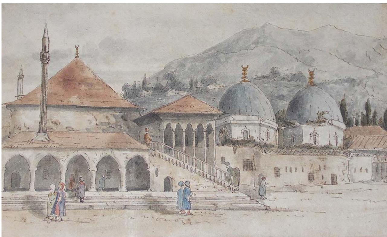
Рис. 2. Р.-У. Хэй. Бахчисарай (вид на большую ханскую мечеть и ханское кладбище)