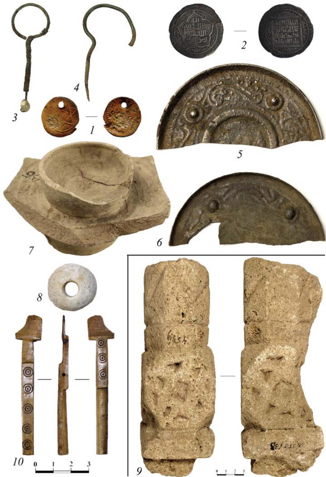
Рис. 1. Предметы из коллекции В.А. Гордцова. 1—монета с отверстием (оп.В184/325), 2—серебряный динар (оп. В184/237), 3,4—серьги в виде «знака вопроса» (оп.В184/19–20), 5,6—зеркала (оп.В184/487–488), 7—подсвечник (?) (оп.В184/135), 8—пряслице из известняка (оп.В184/466), 9—фрагмент колонны из известняка (оп.В555/38), 10—костьяная деталь весов (оп.В184/471).