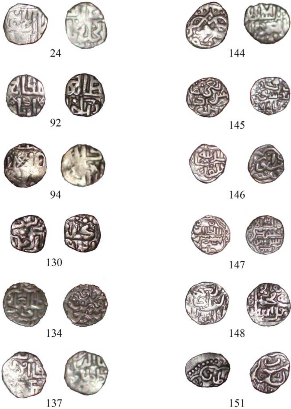
Рис. 1. Монеты клада из д. Уньба