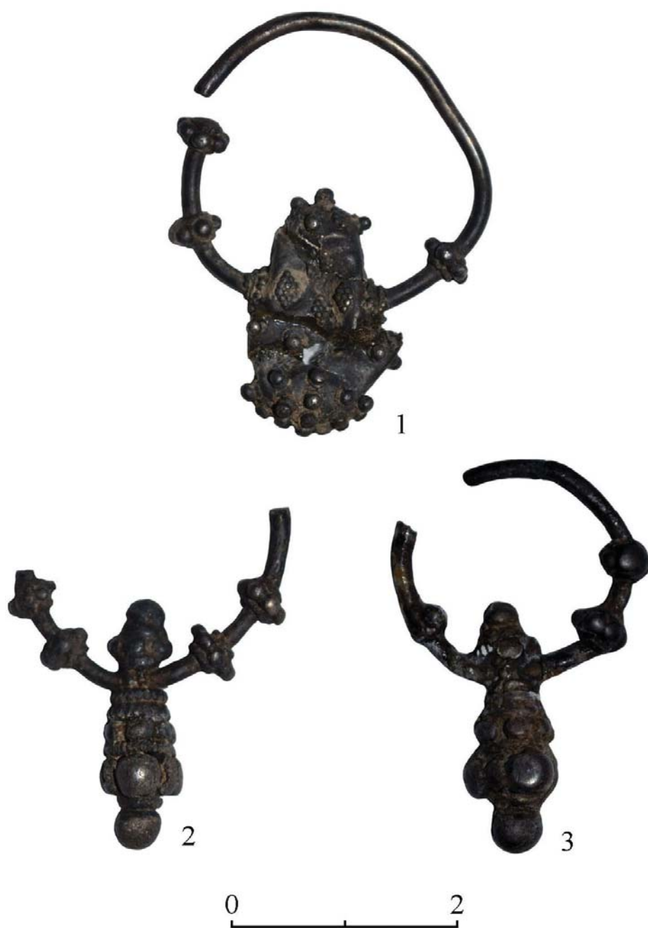
Рис. 2. Чома. Серьги экимауцкого типа.