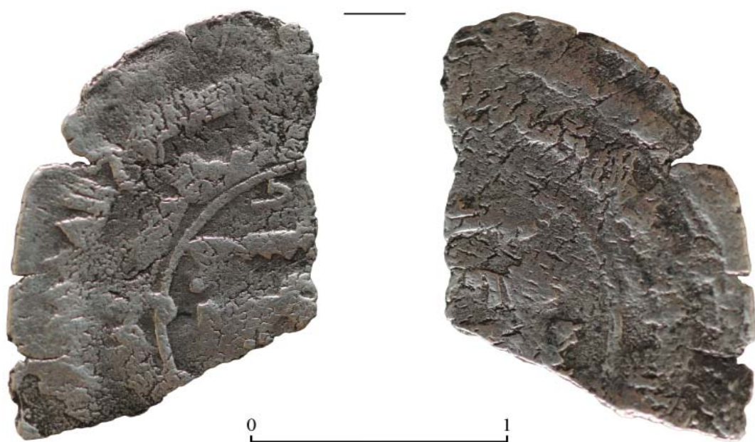
Рис. 1. Чома. Арабский дирхем.