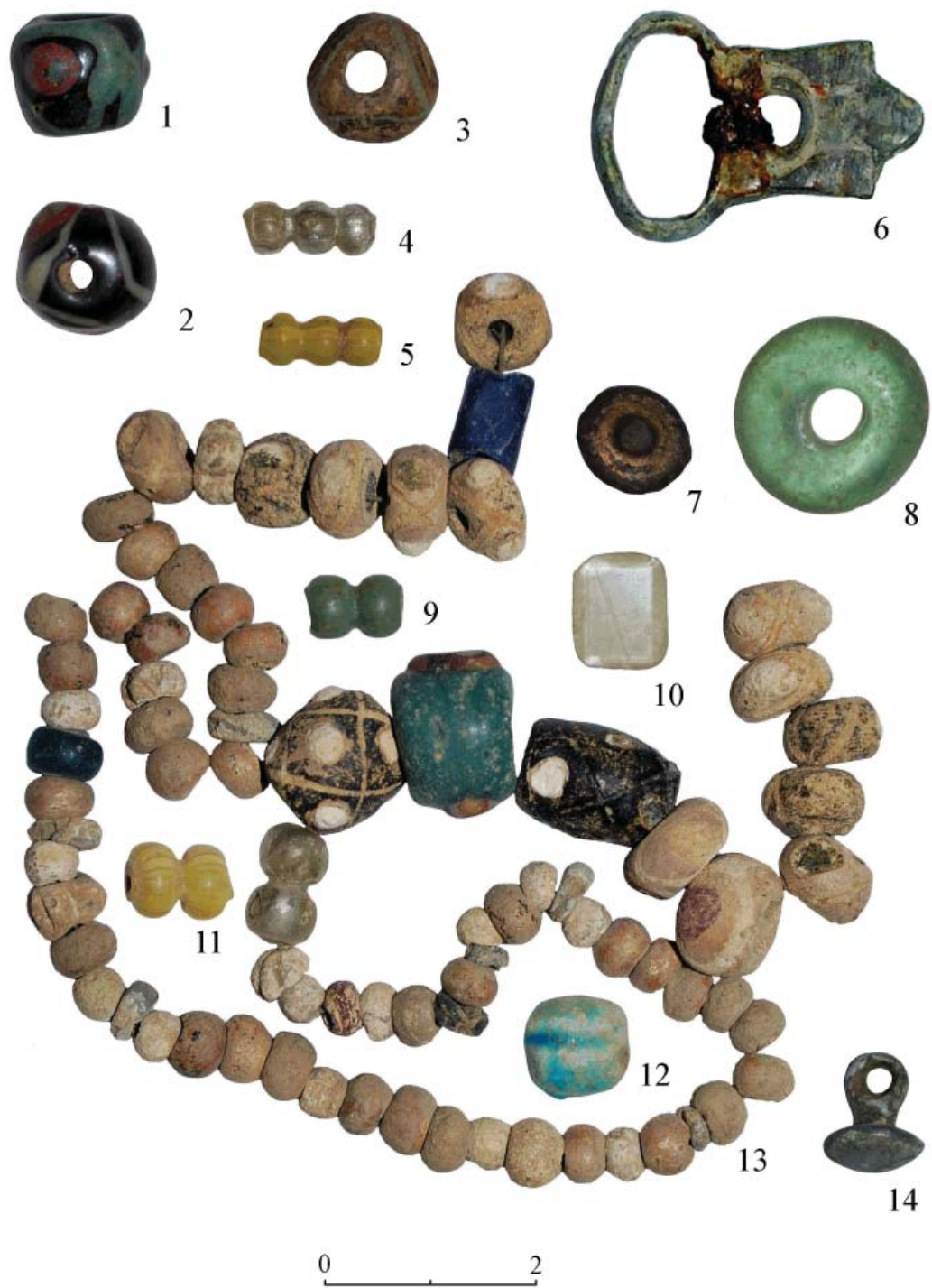
Рис. 4. Чома. Украшения и элементы одежды.