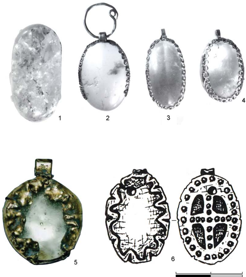
Рис. 2. Хрустальные и стеклянные медальоны и заготовка: 1–4 – находки с городища у с. Городище близ Шепетовки (Хмельницкая обл., Украина); 5 – хрустальный медальон в золотой оправе из кургана у с. Родионовка (Запорожье, Украина); 6 – медальон из синего стекла из Звенигорода (Львовская обл., Украина). Масштабы разные. (1–4 – фото из ФО НА ИИМК РАН: О. 2572.67; 5 – по Комар, 2009, фото на с. 474; 6 – по Свешников, 1995, рис. 2: 5)