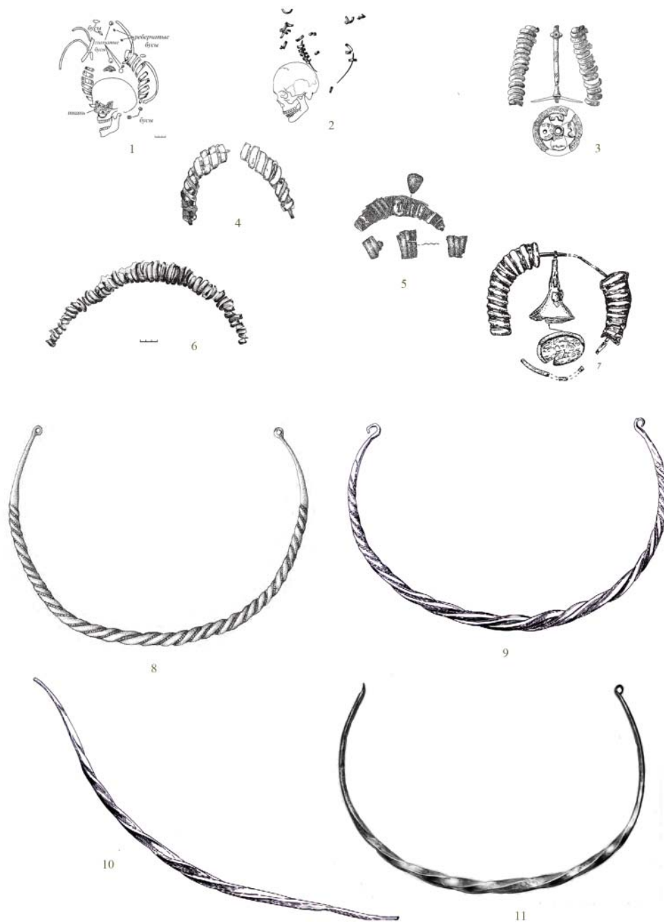
Рис. 3. Фрагменты рогообразных уборов (1-7) и гривны (8-11). Масштабы разные. 1, 4 – Пришиб 1/7; 2 – Темижбекская 6/4; 3 – Лучки 1/1; 5 – Пришиб 2/34; 6 – Новоивановка 1/1; 7 – Таврия I – 2/5; 8 – Банкут (Bánkút), Венгрия; 9 – Лучки, кург. 1 (1/1 по Чхаидзе) (Среднее Поднепровье); 10 – Скворцовка (Северное Причерноморье); 11 – Среднее Поднепровье (из раскопок Н.Е. Бранденбурга). (1-7 – по Чхаидзе, 2014, с. 221, рис. 2; 8 – по Pálóczi Horváth, 2014, о. 146, fig. 104; 9 – по Плетнева, 1973, с. 9, рис. 2; 9; 10 – по Комар, 2009, с. 477; 11 – по Плетнева, 1973, с. 8, рис. 1: 18)