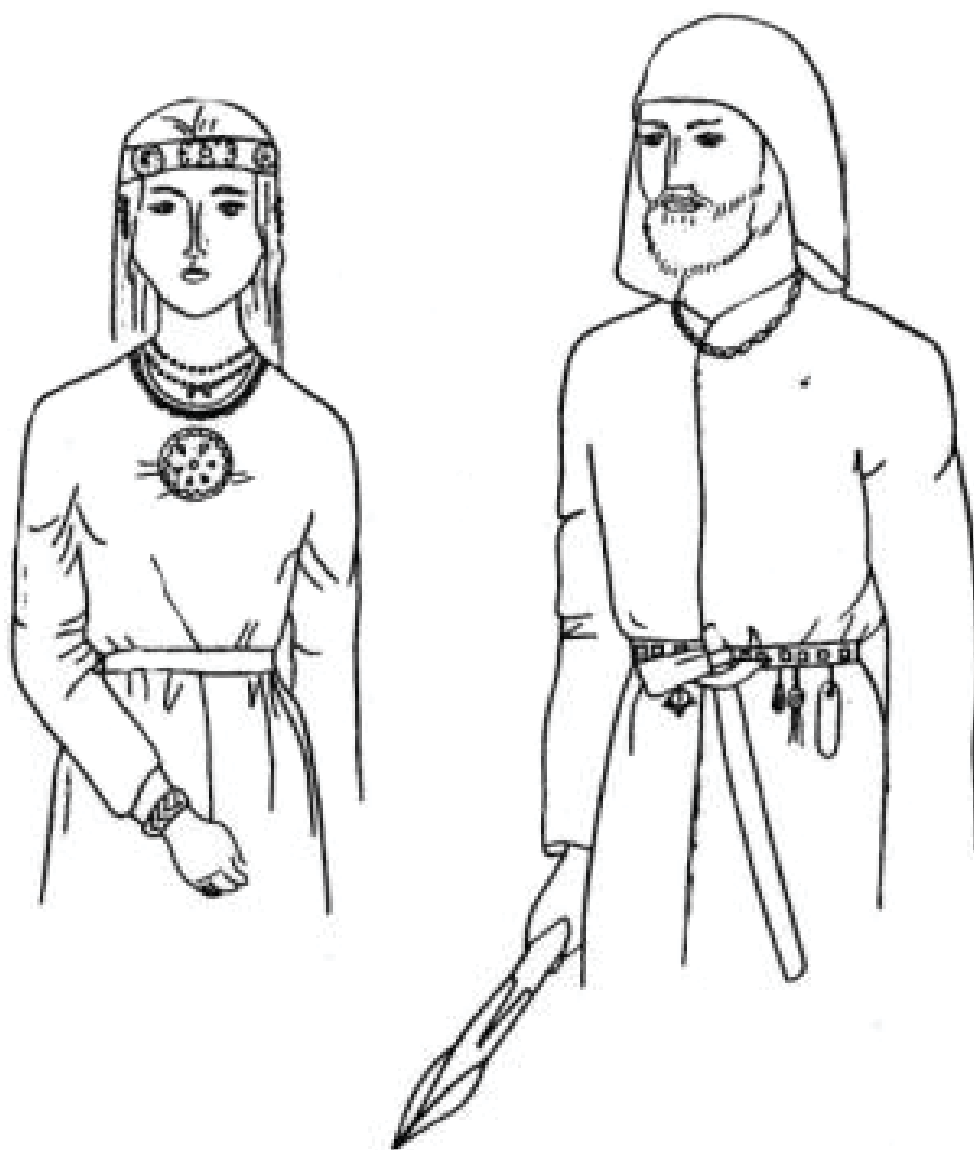
Рис. 1. Реконструкция костюмов Старшего Ахмыловского могильника (1- женский костюм с наиболее типичным набором украшений; 2 – мужской костюм по материалам погребения 900).