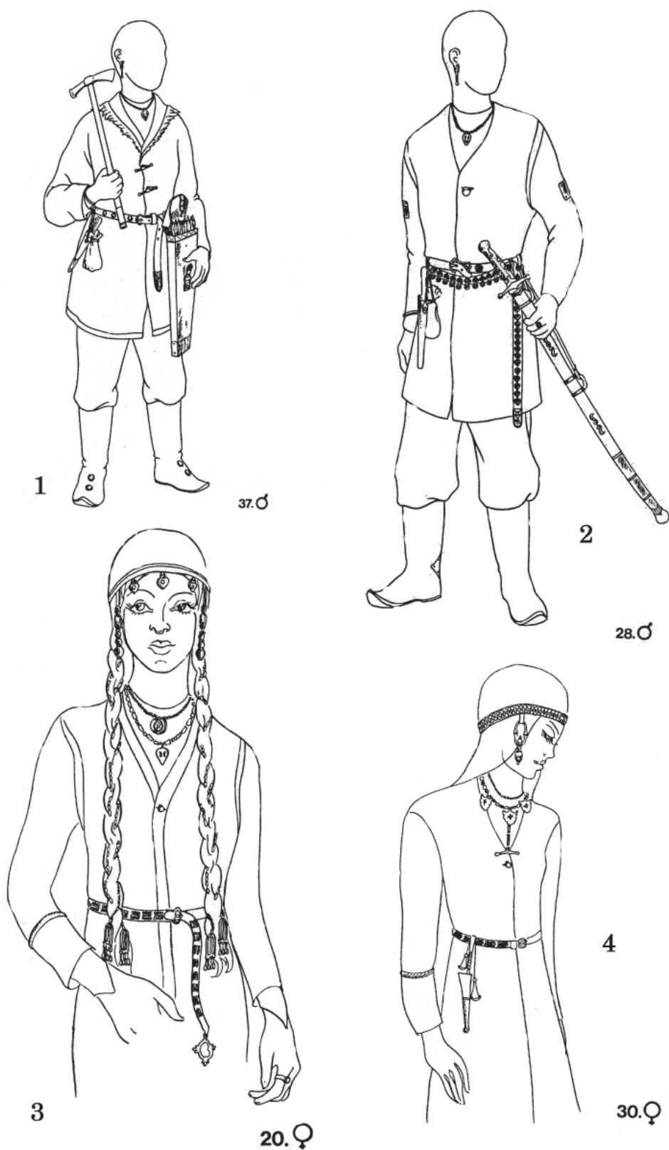
Рис. 1. Реконструкция мужского (1,2) и женского (3,4) костюма по раскопкам Больше-Тиганского могильника. 1 - погр. 37; 2- погр.28; 3- погр.20; 4- погр.30 (по: Chalikowa, Chalikow, 1981, s. 32, 40, 41, 44, abb., 20, 30,32,34).