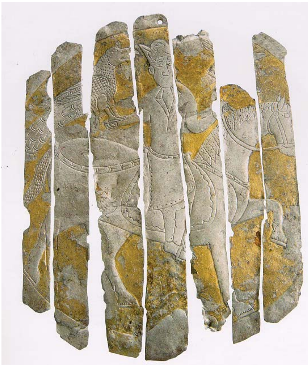
Рис.4. Серебряное блюдо с изображением сокольничего. Урало-венгерский центр. IX в. МВК им. И.С. Шемановского ЯНАО. (по: Сокровища, 2003, с. 53, 57, кат.19).