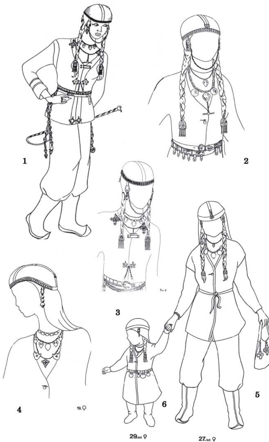
Рис. 2. Реконструкция женского костюма по раскопкам Больше-Тиганского могильника. 1- погр. 7; 2- погр. 17; 3- погр. 7 (деталь); 4 - погр.19; 5 - погр. 27; 6 - погр. 29 (по: Chalikowa, Chalikow, 1981, s. 19, 29, 31, 37, abb., 7,8, 22, 24, 33).