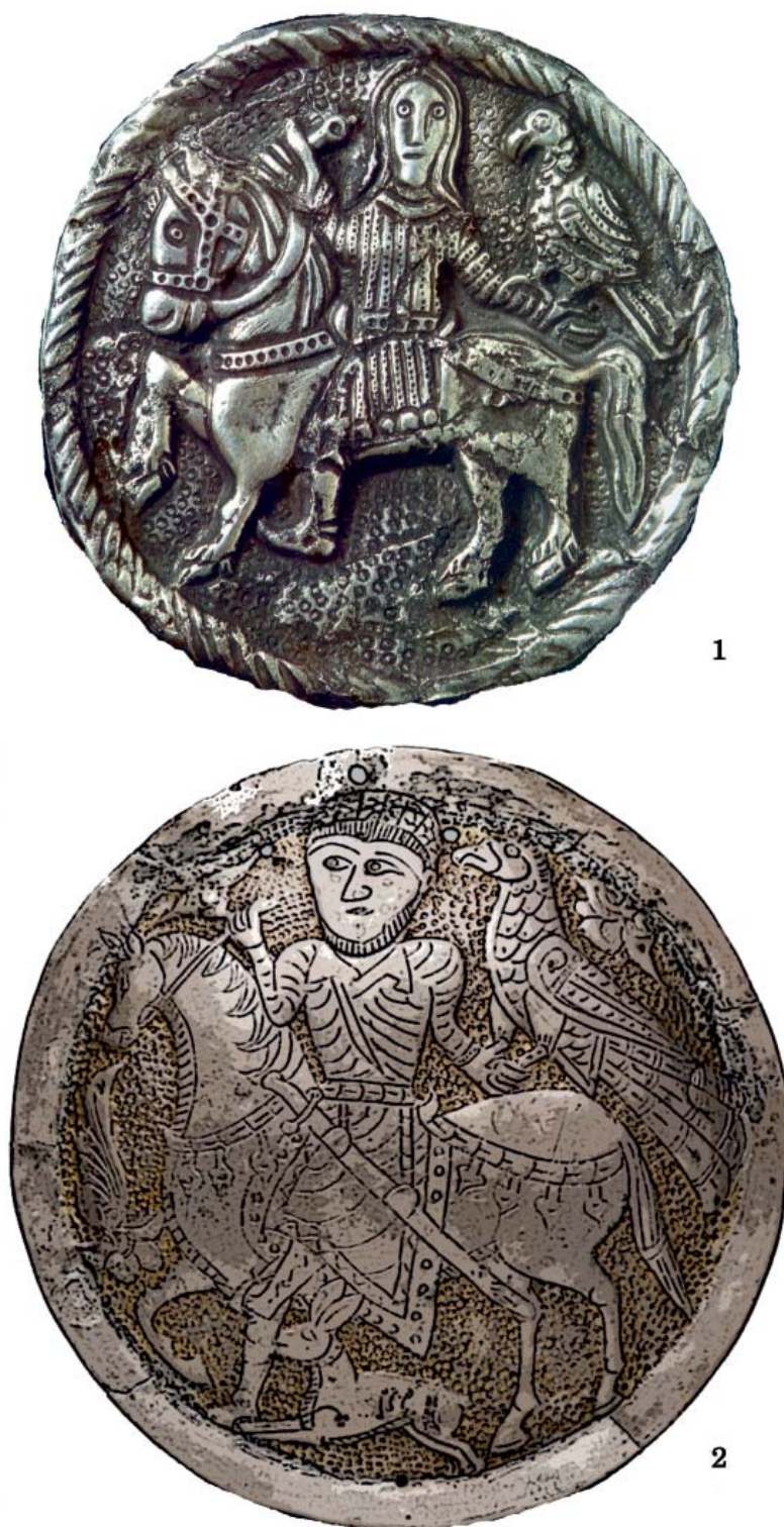
Рис. 3. Украшения с изображением «сокольничего». 1- серебряный медальон Старое Место, Великая Моравия, 2-я пол. IX в. (по: Декан, 1976, ил. 131); 2- серебряная накладка, Урало-венгерский центр. IX в. Собрание Фонда Ш. Марджани (ФМ, инв. №Им/м-397).