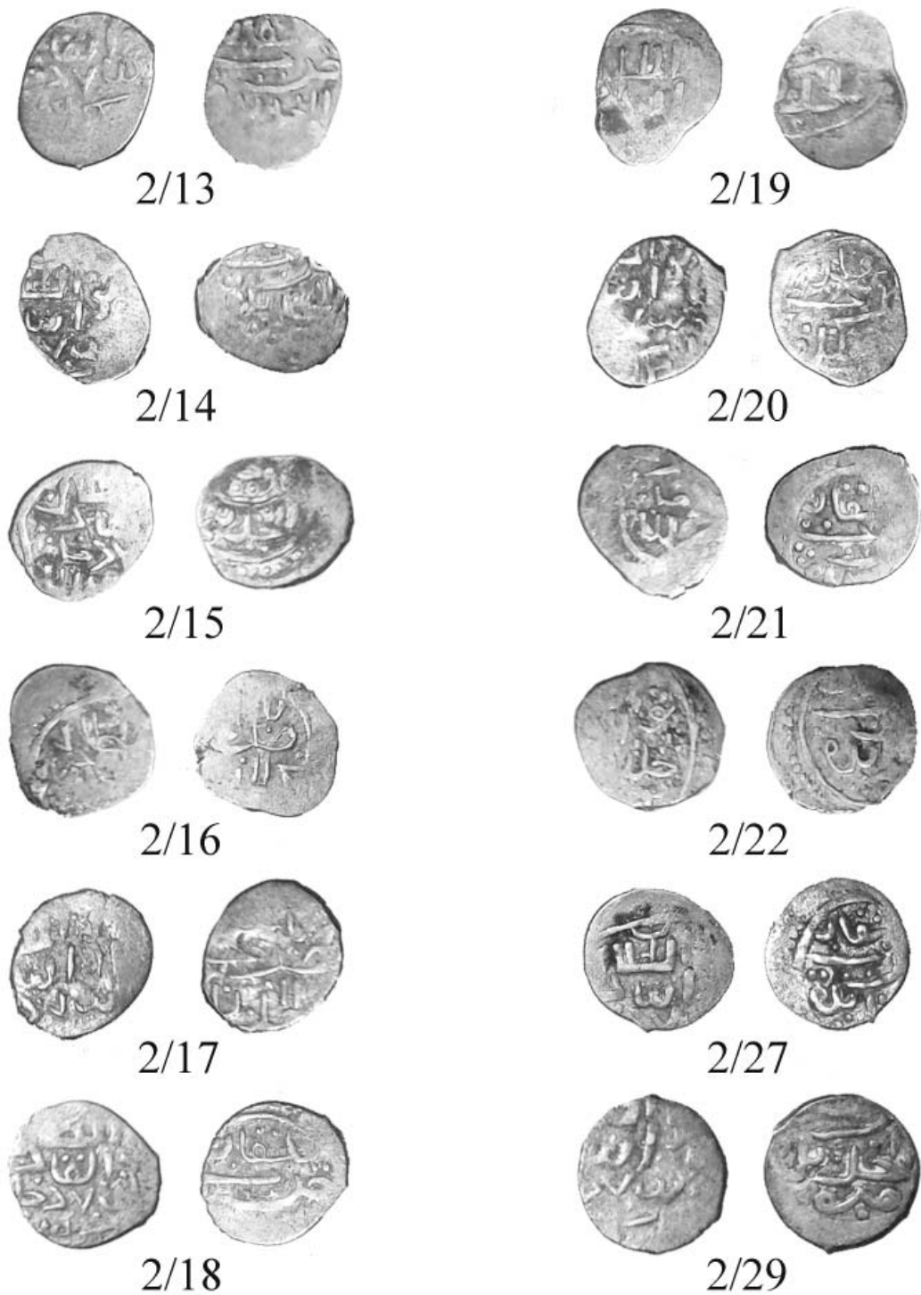
Фототаблица. Монета Пулада чеканки Булгар ал-Джадид