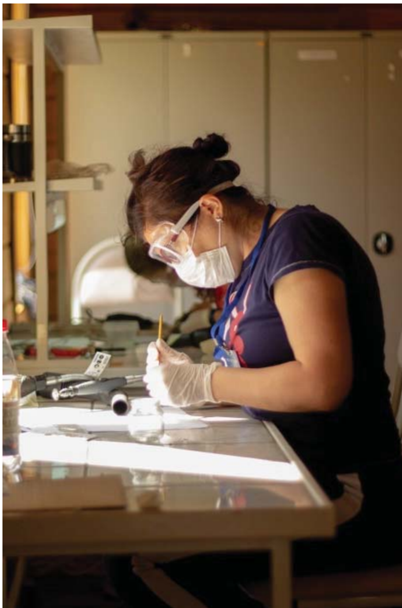
Рис. 6. Слушатель секции «Стабилизация и консервация археологического железа» за расчисткой археологической находки из железа