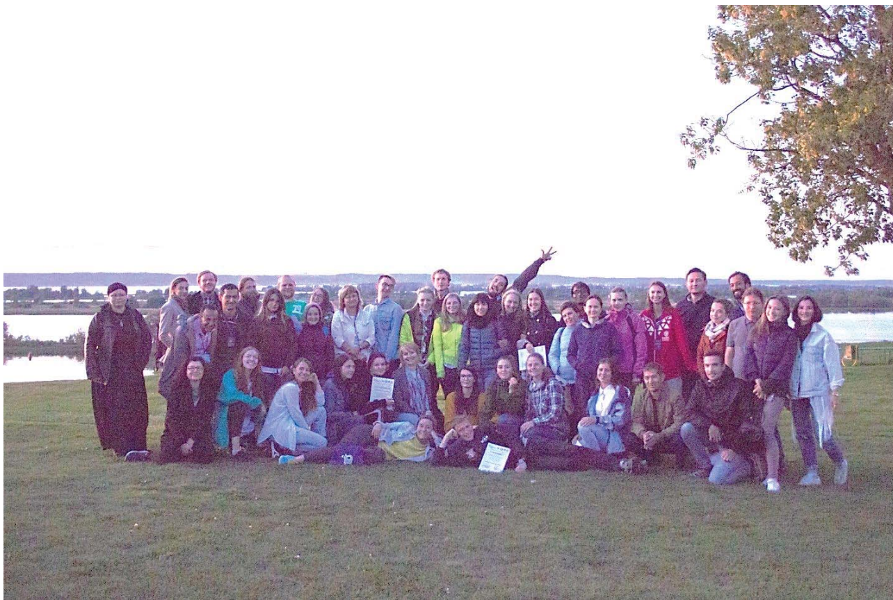
Рис.11. Слушатели VI Международной археологической школы