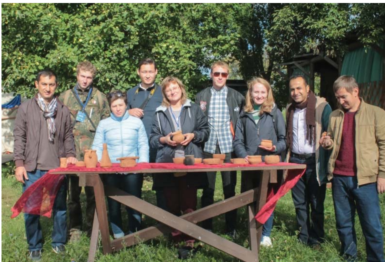
Рис.2. Группа слушателей секции «Древняя керамика: история и реставрация» подготовила экземпляры керамической посуды для обжига.