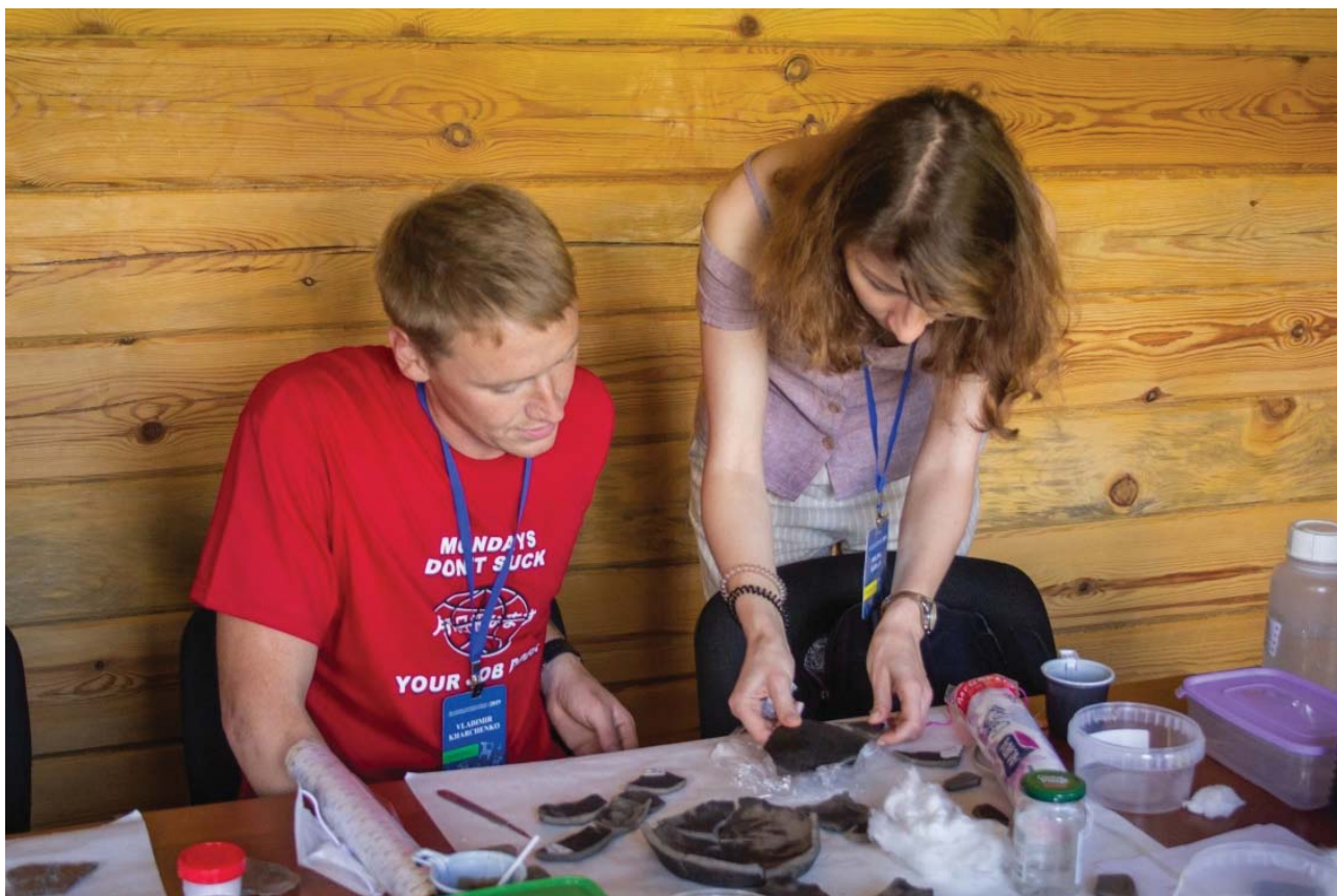
Рис. 4. За реставрацией керамического сосуда