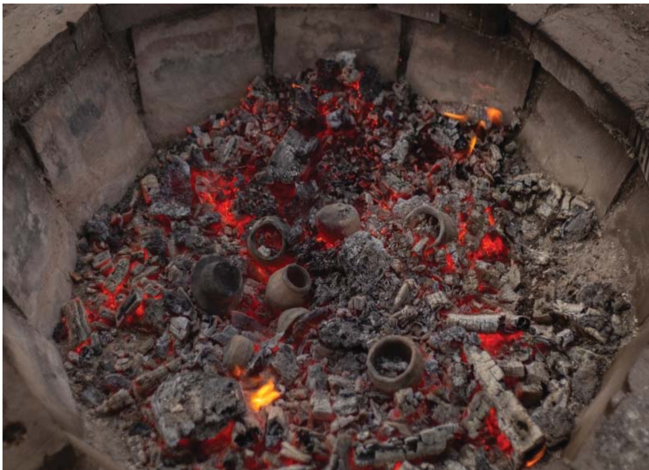
Рис.3. Процесс обжига керамики