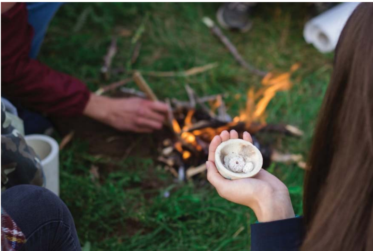
Рис.1. Практические занятия секции «Археологическое стекло»