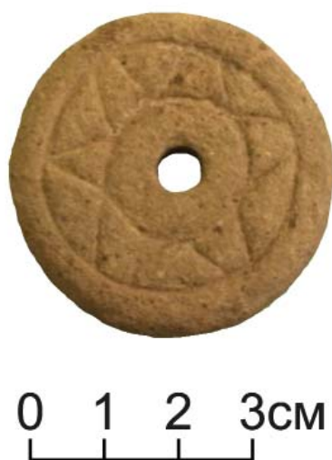
Рис. 5. Напрясло.