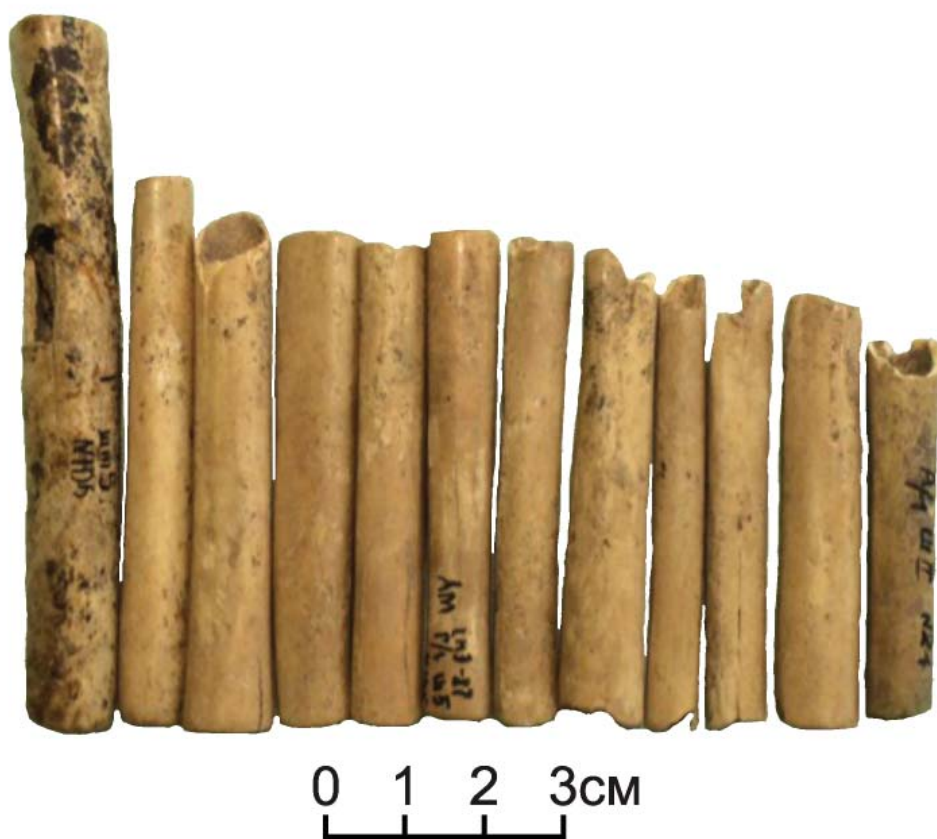
Рис. 4. Свирель.