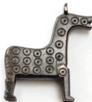
Рис. 5. Характерные типы болгарских изделий. 1 – бронзовая матрица (Золотаревское городище, ЗМЗ); 2 – костяная запястная пластина с зооморфным изображением (Билярское городище, НМ РТ); 3 – железный топор (Болгарское городище, МБЦ); 4 – бронзовый замочек (Болгарское городище, МБЦ).