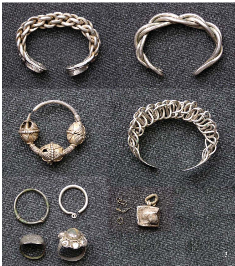
Рис. 4. Характерные болгарские украшения. 1 – золотое височная подвеска (НМ РТ); 2 – серебряное височная подвеска (НМ РТ); 3 – набор золотых украшений из Золотаревского городища (по Г.Н. Белорыбкину).