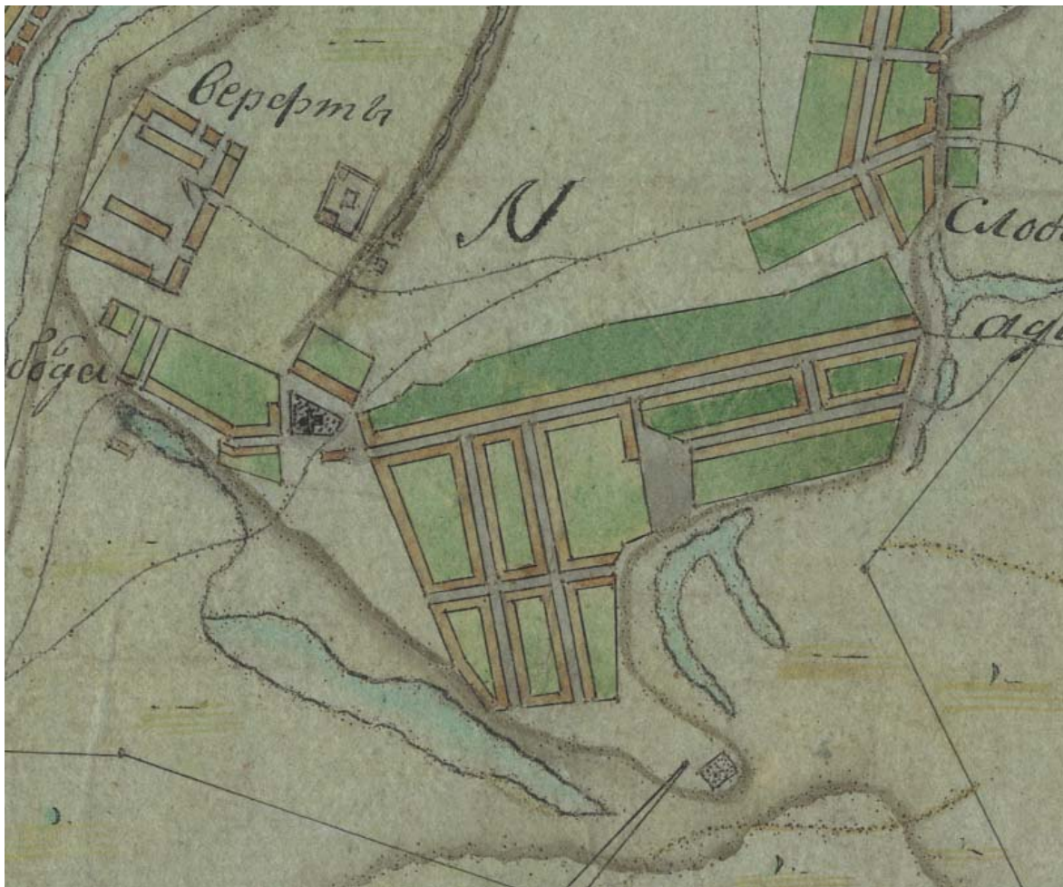
Рис. 8. РГАДА. Ф.1356. Оп.1. Казанская губерния. Д.1301. План города Казани со слободами и деревнями. XVIII в. Часть плана.