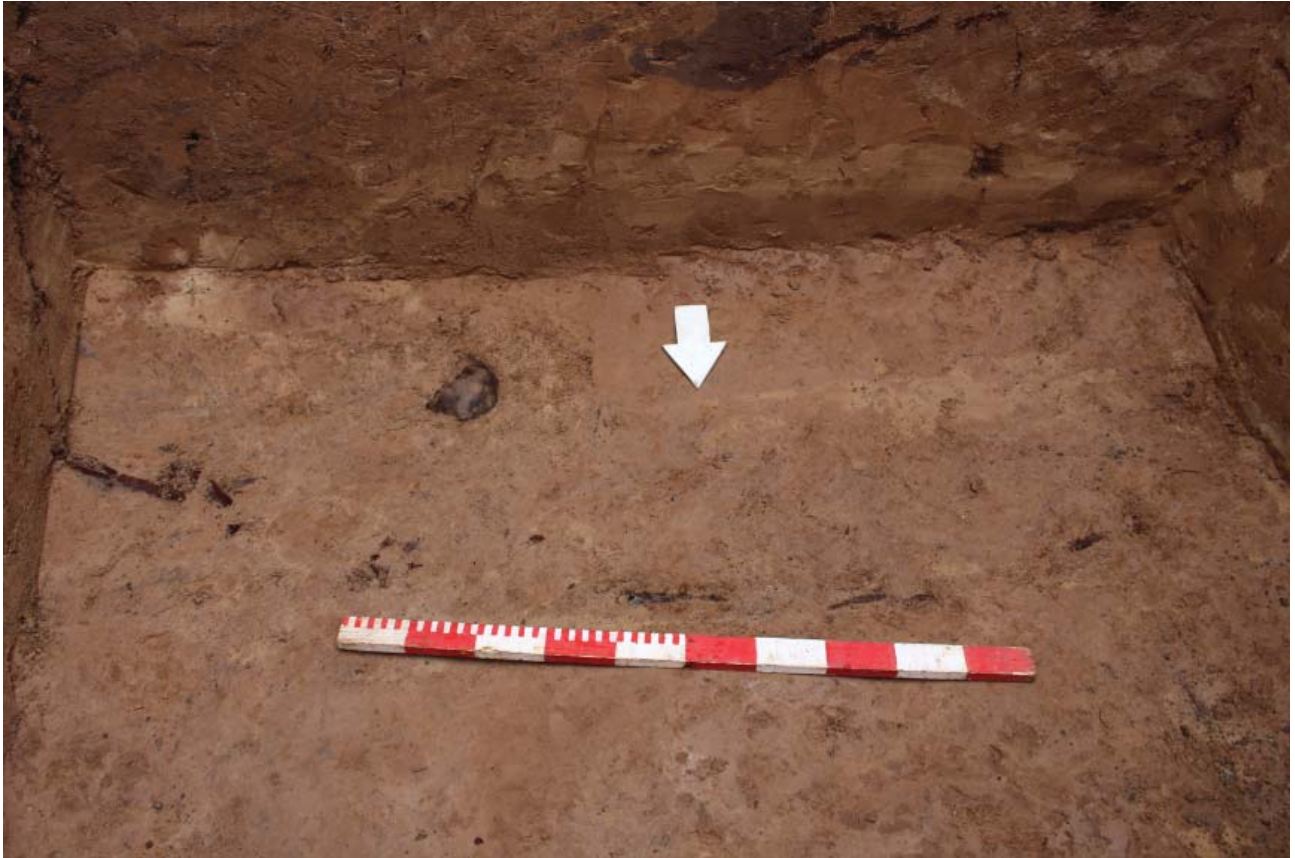
Рис. 2. Шурф 2, план на уровне материка. Погребения 1,2.