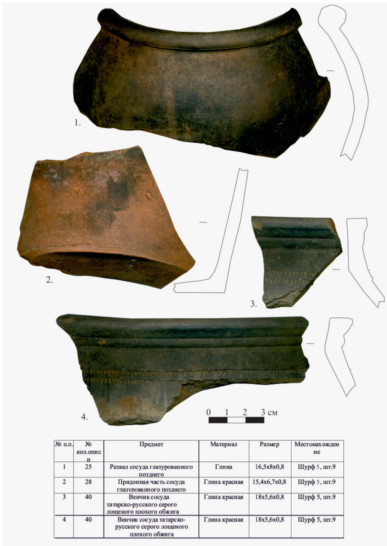
Рис. 5. Находки 1