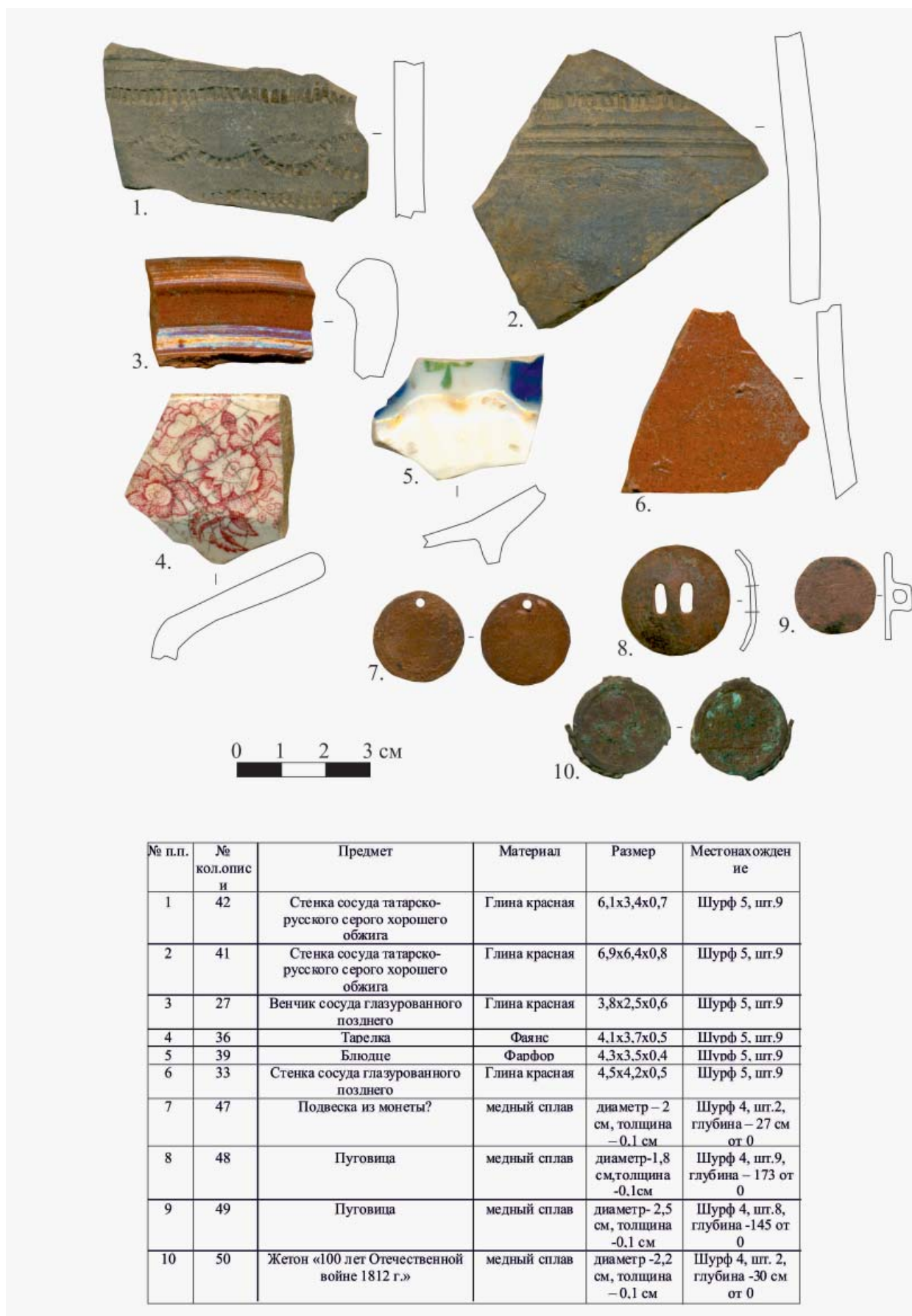
Рис. 6. Находки 2