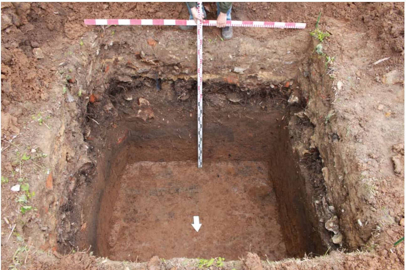
Рис. 3. Стратиграфия шурфа 3. Погребения 1,3.