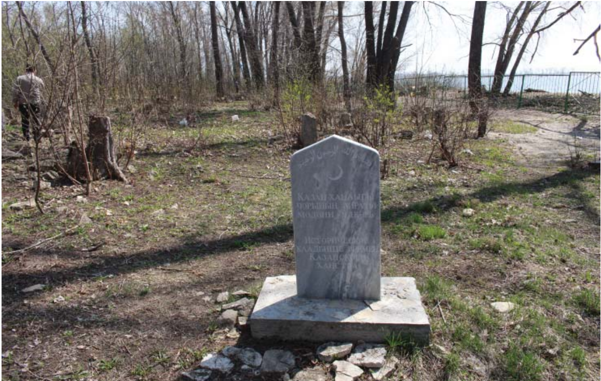
Рис. 7. Информационный знак на территории кладбища