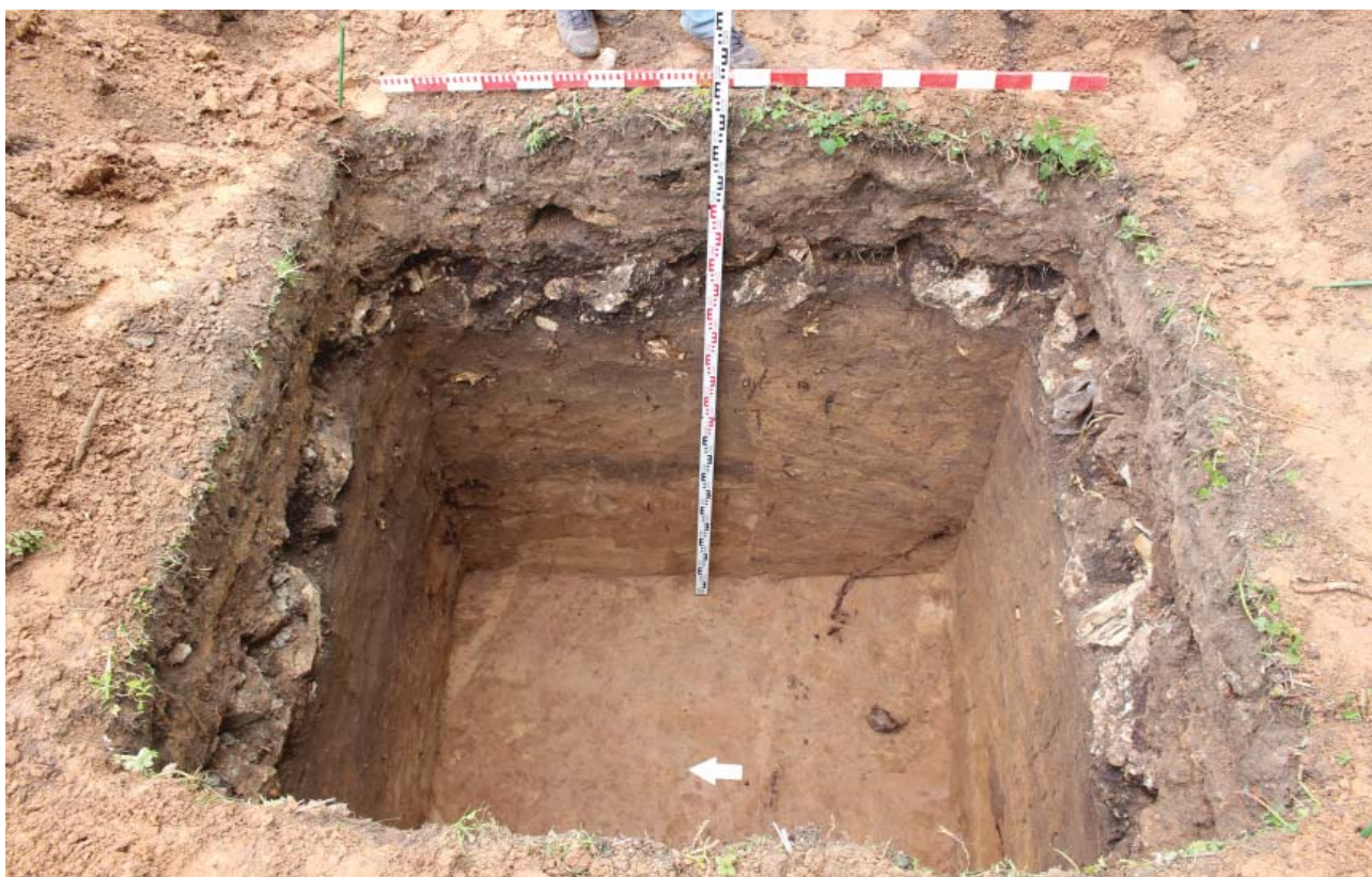
Рис. 1. Восточный профиль шурфа 2. Погребения 1,3.