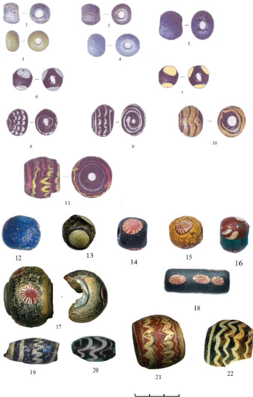
Рис. 2. Стекланные подвески из погребений кочевников XIII–XIV вв.