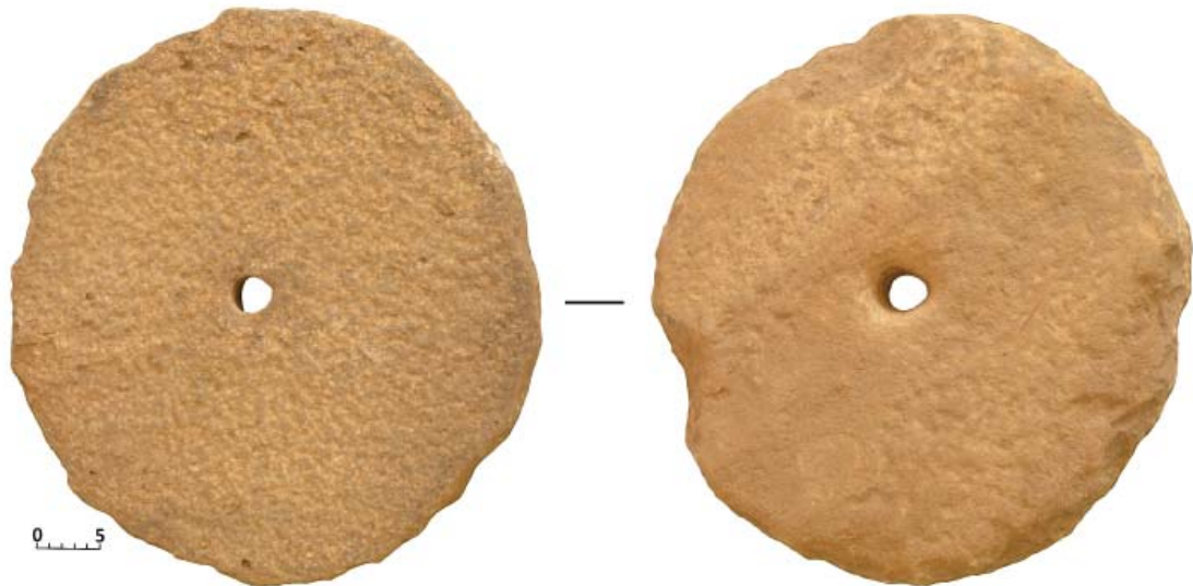
Рис. 1. Ручной жёрнов. Городище Маджары. Сборы Ю.Обухова Fig. 1. Manual millstone. Madjary Settlement. Collected by Yu. Obukhov