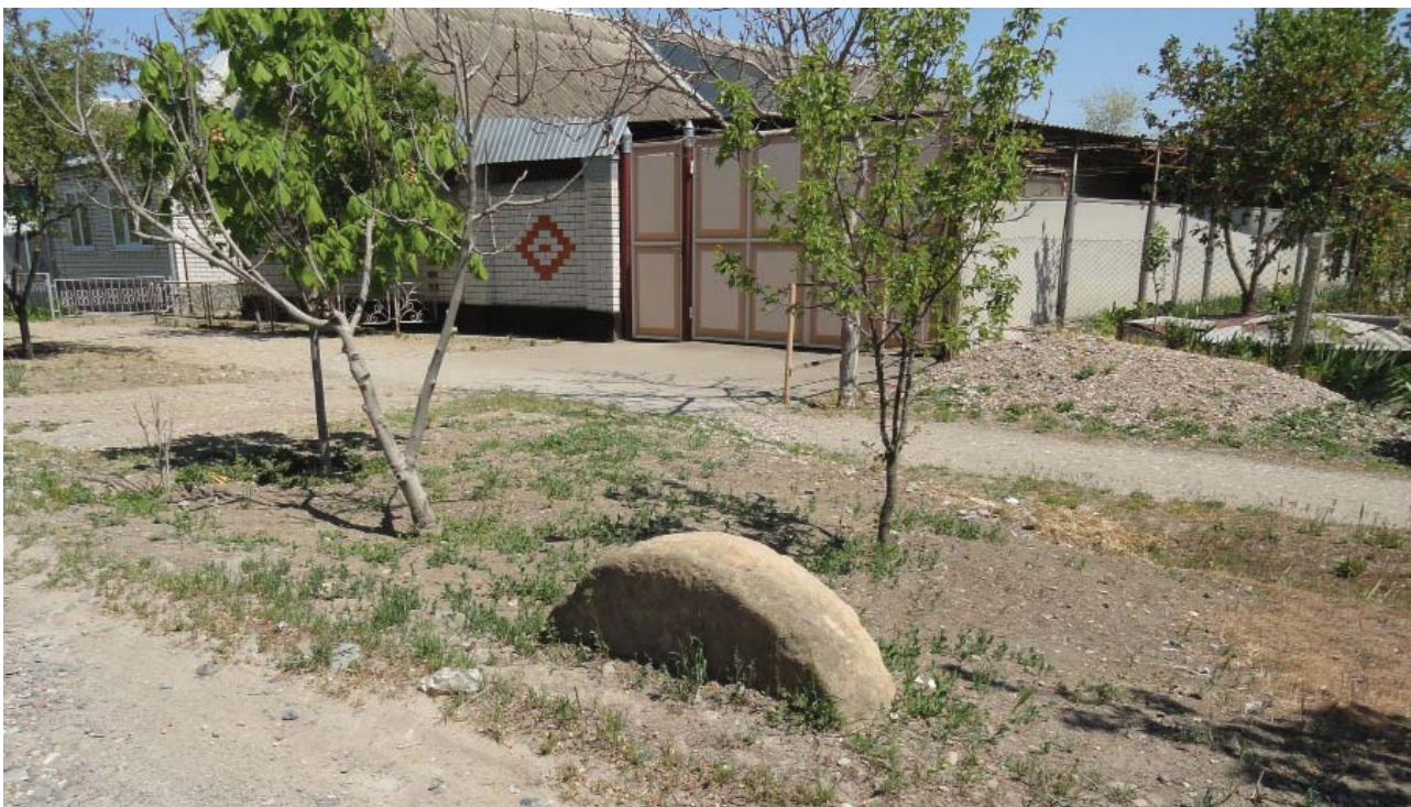
Рис. 4. Вероятный «Постав» большого жёрнова. Село Прасковья Будённовский муниципальный округ 2019 г. Fig. 4. Probable “foundation” of a large millstone. Praskoveya village of the Budennovsky municipal district, 2019

нии которых растительная пища, мука и крупы занимали определённое место (Пигарев, 2009, с. 63), но и другой категории потребителей.