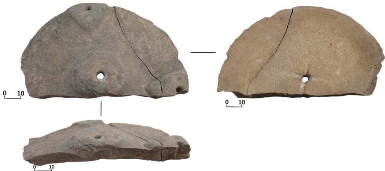
Рис. 2. Большой жернов «Бегун» тщательной отделки, приводимый в движение живую силою. Городище Маджары. Сборы Ю. Обухова Fig. 2. Large “Runner” millstone, of thorough finish, set in motion by living force. Madjary Settlement. Collected by Yu. Obukhov

общими признаками, а именно расположенными в верхней части тремя технологическими глухими отверстиями, в виде колена выходящими в боковую поверхность жернова для крепления рычагов либо продевания веревок. О находке таких же жерновов при археологическом исследовании на Маджарском городище в 1907 г. писал в своём отчете В.А. Городцов.