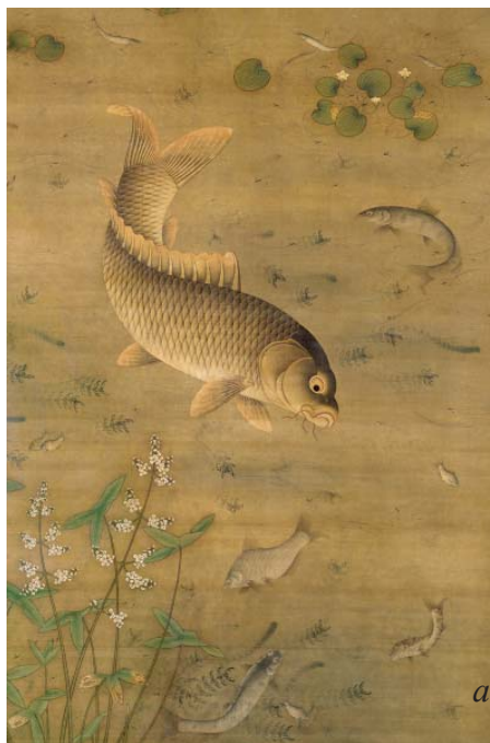
Fig. 3. Fish images in Chinese painting: a – Liu Kai. Fish swimming among falling flowers (circa 1075). Saint Louis Art Museum. https://en.wikipedia.org/wiki/File:Goldfish_in_Fish_Swimming_Amid_Falling_Flowers_by_Liu_Cai_(cropped).jpg ; б – МяоФу. Fish and aquatic grass. 15th c. Ming dynasty. The Palace Museum, Taipei (Taiwan).

Рис. 3. Изображения рыб в китайской живописи: a – Лю Кай. Рыбы, плавающие среди опадающих цветов (ок. 1075). Saint Louis Art Museum. https://en.wikipedia.org/wiki/File:Goldfish_in_Fish_Swimming_Amid_Falling_Flowers_by_Liu_Cai_(cropped).jpg ; б – МяоФу. Рыба и водная трава. 15th c. Династия Мин. Дворцовый музей, Тайбей (Тайвань).