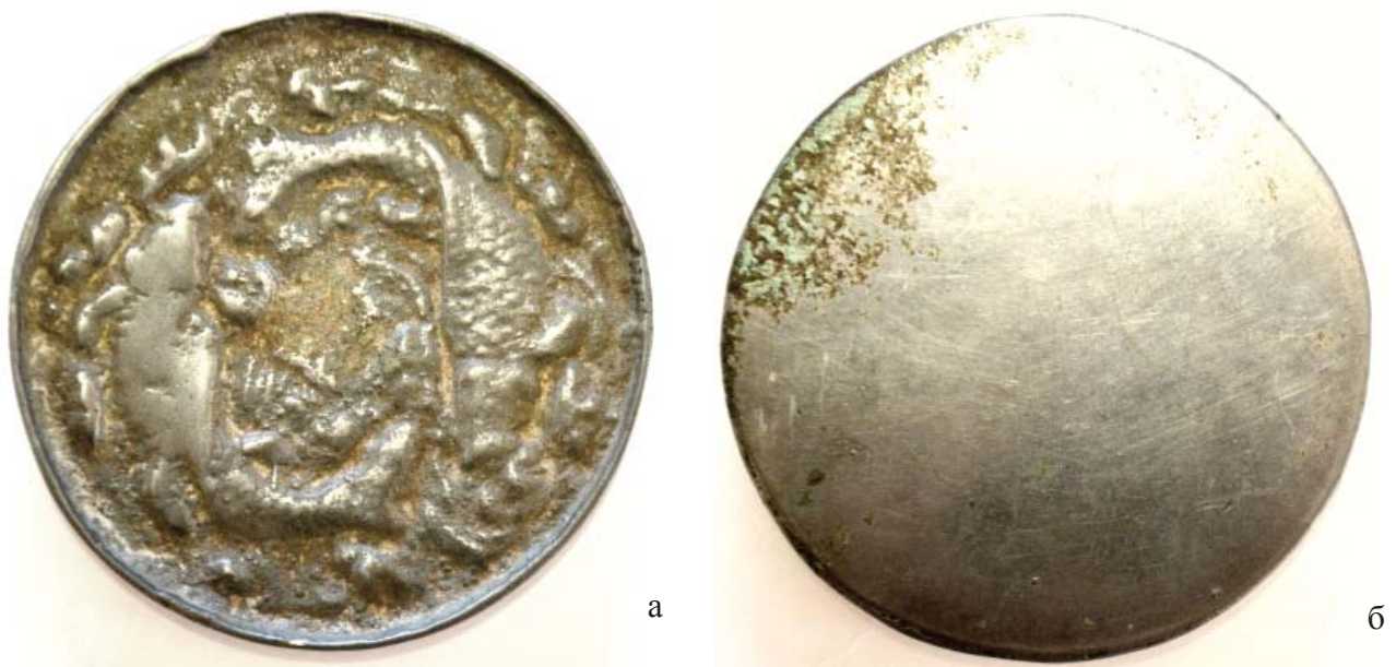
Рис. 2. Фото зеркала из Сарлы (а – сторона с рельефом, б – зеркальная сторона). Fig. 2. Photo of a mirror from Sarly (a - relief side, б - mirror side).