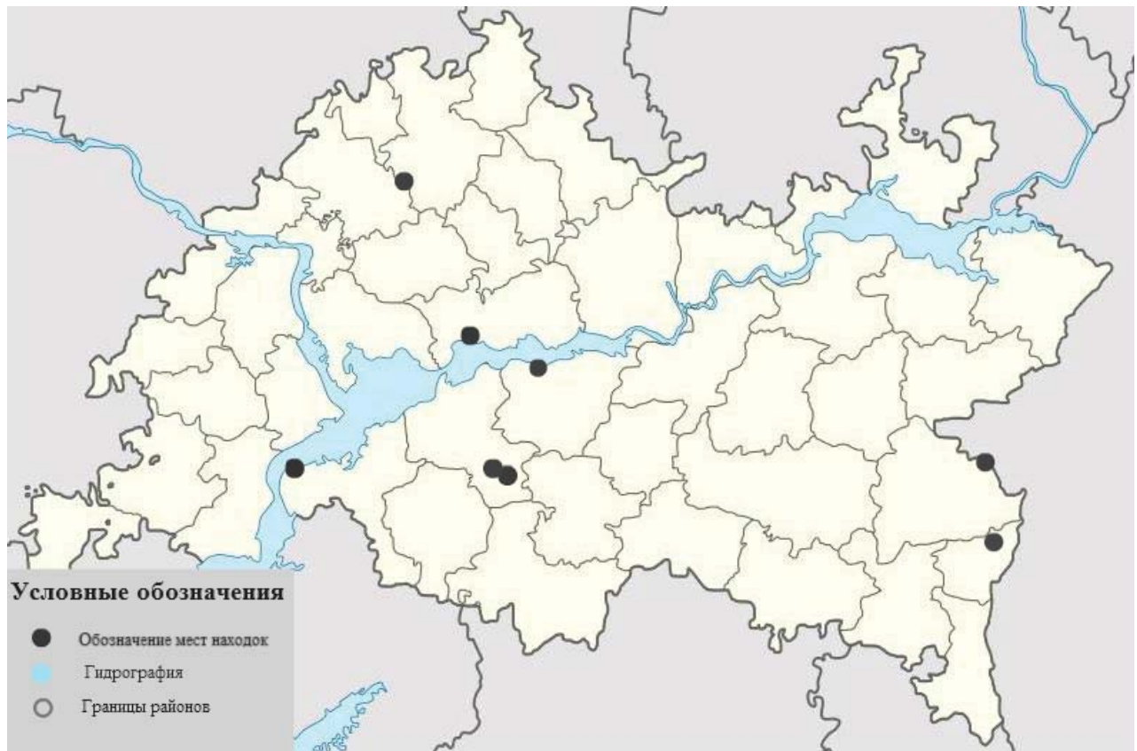
Рис. 5. Карта с обозначением мест находок зеркал данного типа в Волго-Камье. Fig. 5. Map indicating the locations where this type of mirrors have been found in the Volga-Kama region.