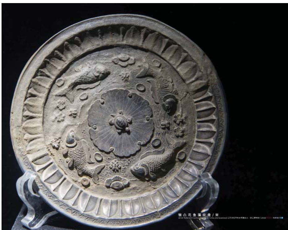
Рис. 4. Зеркало эпохи Сун. (960-1279). Музей Чжэньцзян (провинция Цзянсу, Китай). https://i.pinimg.com/originals/0e/7d/5c/0e7d5cdd4db7f4b8cb62b58995397ebf.jpg

Fig. 4. Mirror of the Song period. (960-1279). Zhenjiang Museum (Jiangsu Province, China). https://i.pinimg.com/originals/0e/7d/5c/0e7d5cdd4db7f4b8cb62b58995397ebf.jpg