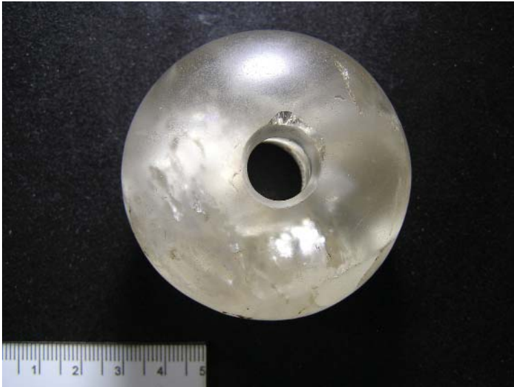
Рис. 5. 12. Кизильский могильник. Курган 2. Погребение 2. Навершие булавы из горного хрусталя. 1971 г. Fig. 5. 12. Kizilsky burial ground. Barrow 2. Burial 2. Mace head made of rock crystal. 1971.

наших студентов в исследовании этой группы памятников археологии – самый ранний факт присутствия археологии в вузе (рис. 4).