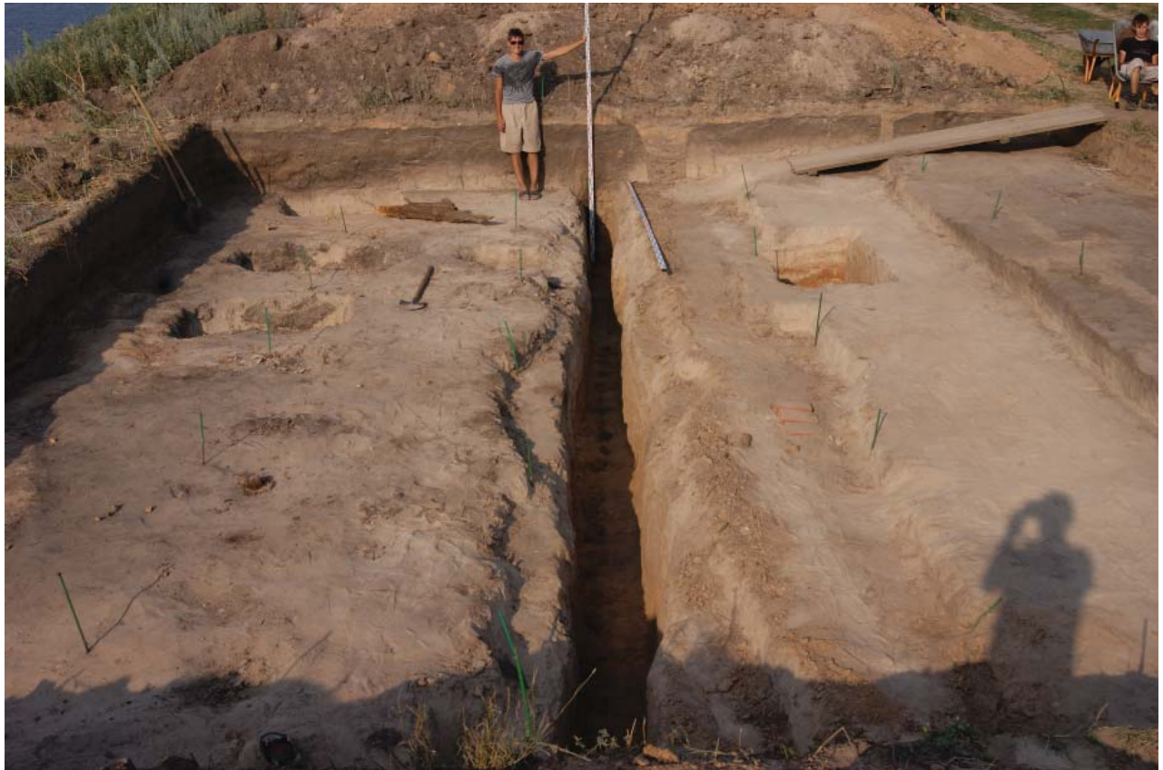
Рис. 6. Остатки тыновой ограды в северо-западной части Свиязска. Раскоп 3. Вид с юго-запада. Fig.6. Remains of a lath fence in the north-western part of Sviyazhsk. Excavation 3. View from the south-west.