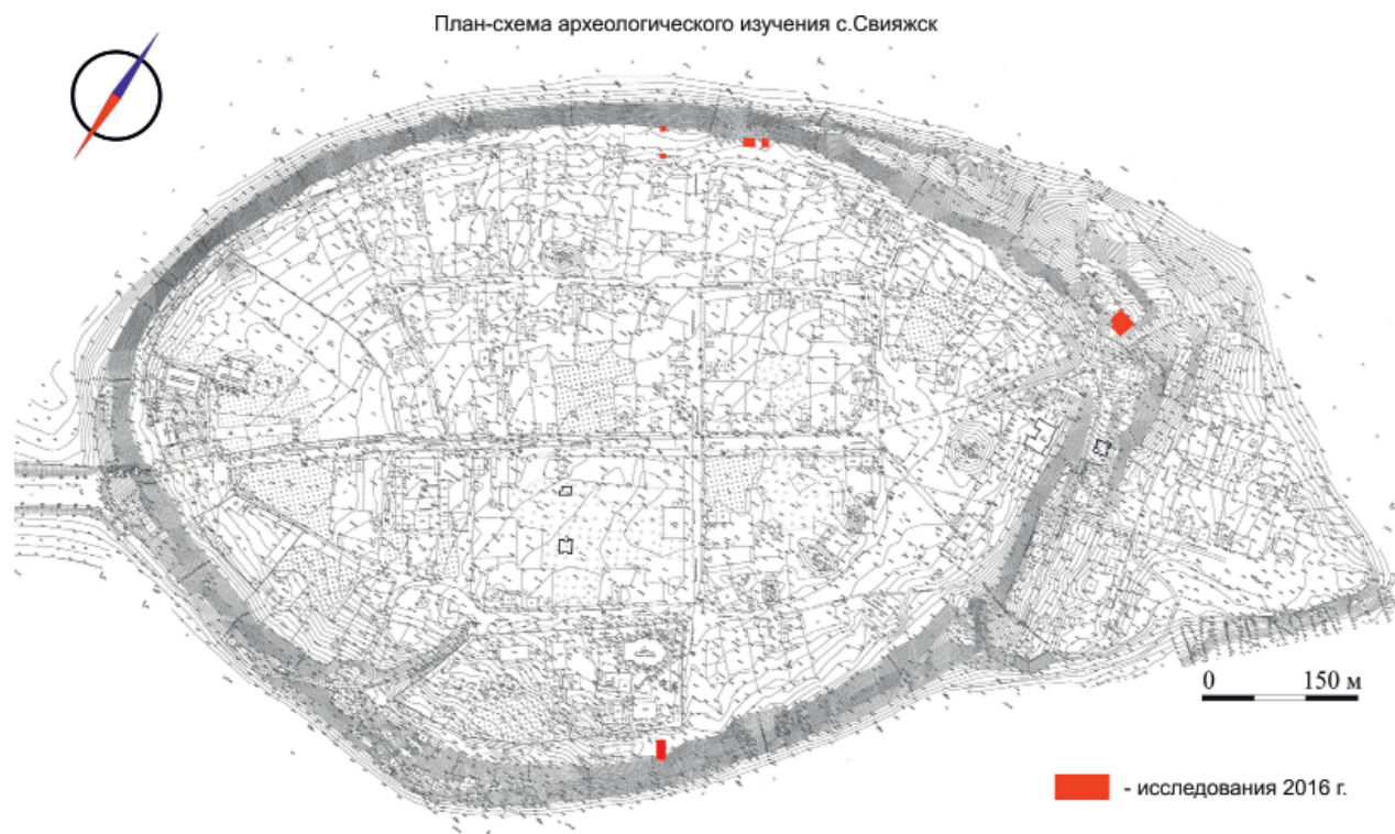
Рис. 4. План Свияжска с раскопами. Fig.4. Plan of Sviyazhsk with excavations.