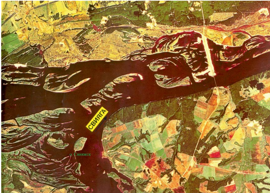
Рис. 1. Расположение острова–града Свияжск. Fig.1. Location of the Island Town of Sviyazhsk.