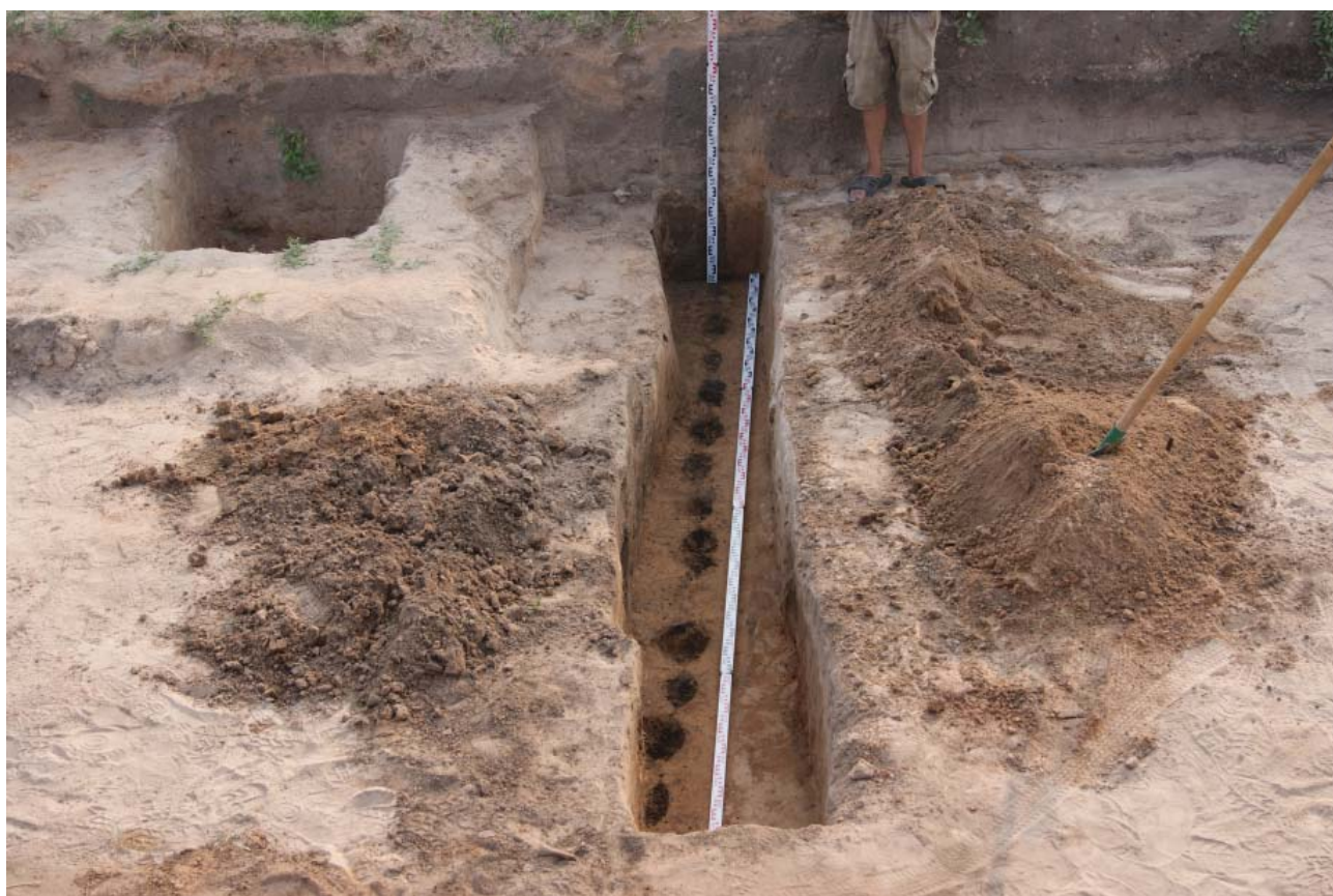
Рис. 5. Остатки тыновой ограды в северо-западной части Свияжска. Раскоп 2. Вид с северо-востока. Fig.5. Remains of a lath fence in the north-western part of Sviyazhsk. Excavation 2. View from the north-east.