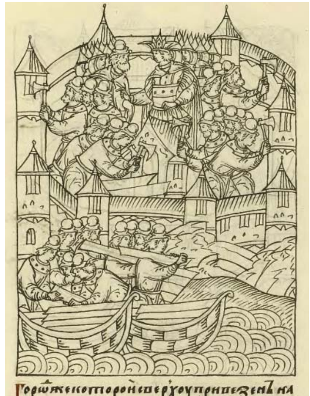
Рис. 3. Миниатюра из Лицевого летописного свода XVI в. С. 475. Fig. 3. Miniature painting from the Illuminated Compiled Chronicle of the 16th century. P. 475.