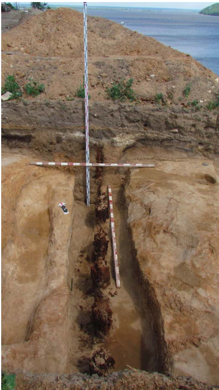
Рис. 8. Остатки тыновой ограды в юго-восточной части Свяжска.