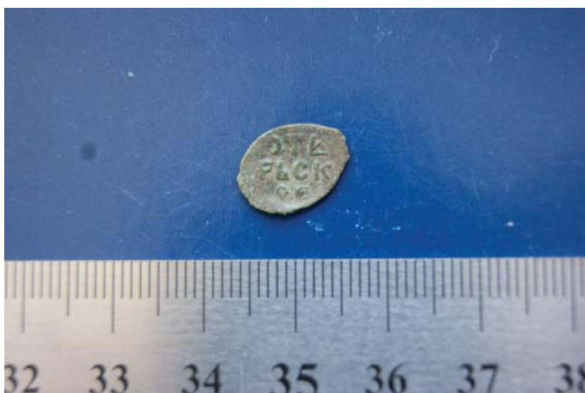
Рис. 9. Тверской пул XV в.