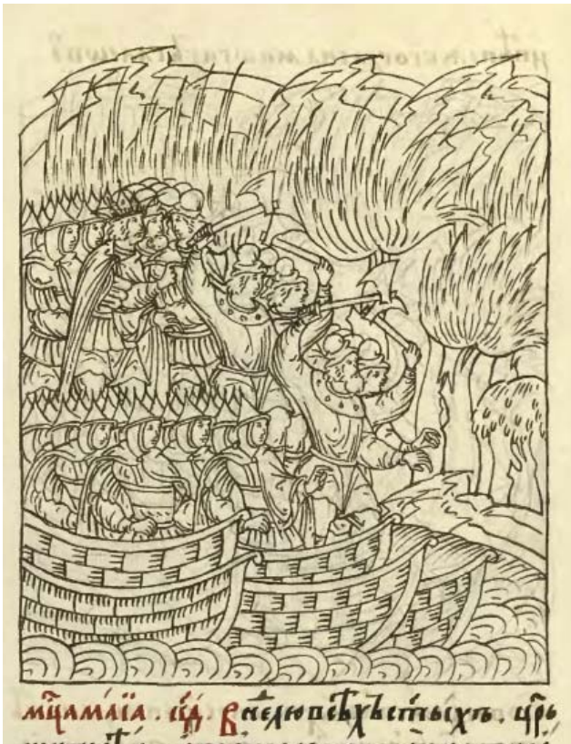
Рис. 2. Миниатюра из Лицевого летописного свода XVI в. С. 472. Fig. 2. Miniature painting from the Illuminated Compiled Chronicle of the 16th century. P. 472.