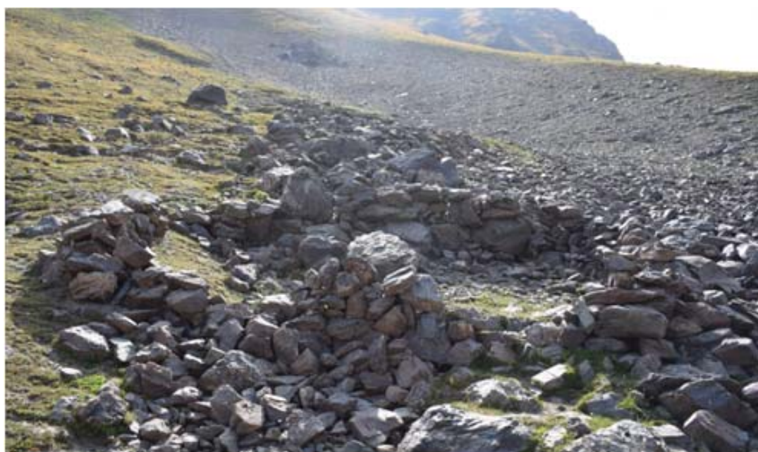
Рис. 7. Курганы на Саймалы-Таш 2 и каменное ограждение (стоянка?) в верховье ущелья Аубек (восточная часть природного парка Саймалуу-Таш) Fig. 7. Mounds on Saimaly-Tash 2 and a stone fence (parking lot?) in the upper reaches of the Aubek Gorge (eastern part of the Saimaluu-Tash Nature Park)

Каждые исследования памятника Саймалы-Таш дают новые данные и возможности раскрыть еще неизвестные нам события истории и культуры населения, проживавшего в районе этого памятника. Поэтому выявление таких объектов, как поселения, стоянки, погребальные и поминальные сооружения, петроглифы, тамги-знаки и т. п. (рис. 7), в окрестностях Саймалы-Таша будет иметь большое значение. Но в настоящее время не