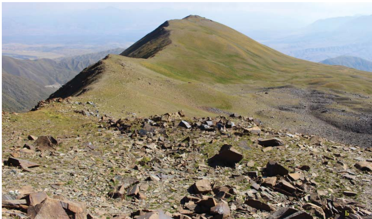
Рис. 2. А – общий вид памятника Саймалы-Таш I с северо-востока. Восточная часть одноименной долины с основным скоплением петроглифов; Б – вид восточного склона водораздела Саймалы-Таш, где расположен памятник Саймалы-Таш II

Fig. 2. А – general view of the monument of Saimaly-Tash I from the northeast. The eastern part of the valley of the same name with the main cluster of petroglyphs; Б – a view of the eastern slope of the Saimaly-Tash watershed, where the monument of Saimaly-Tash II is located