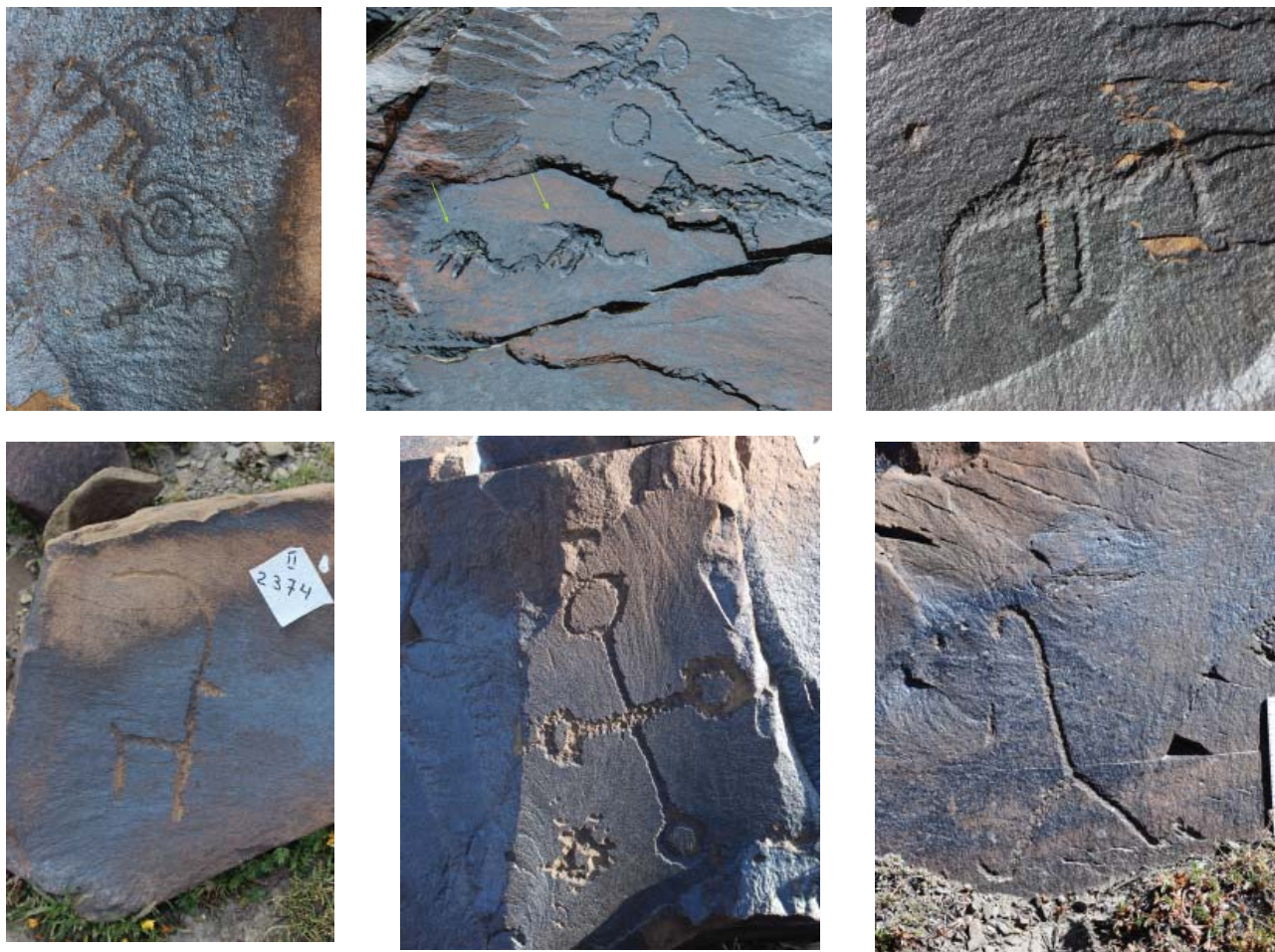
Рис. 6. Изображение птиц и непонятый персонаж. Саймалы-Таш I Fig. 6. The image of birds and a misunderstood character. Saimaly-Tash I

ми изображениями разного стиля и техники исполнения. Это, несомненно, препятствует тому, чтобы проследить стиль, мотив и принадлежность к определенному периоду. При этом нередко встречаются и палимпсесты.