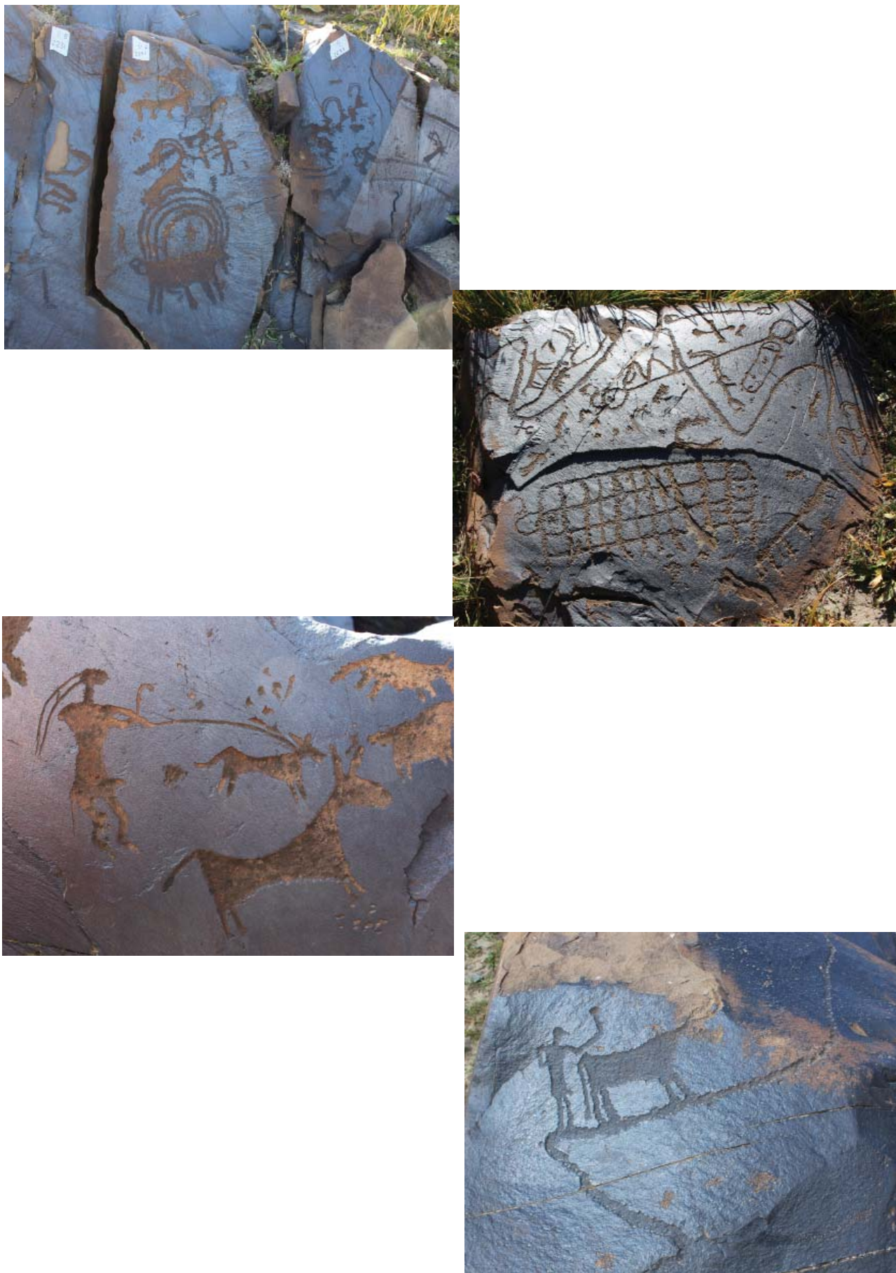
Рис. 5. Петроглифы памятников Саймалы-Таш I и II Fig. 5. Petroglyphs of the monuments of Saimala-Tash I and II