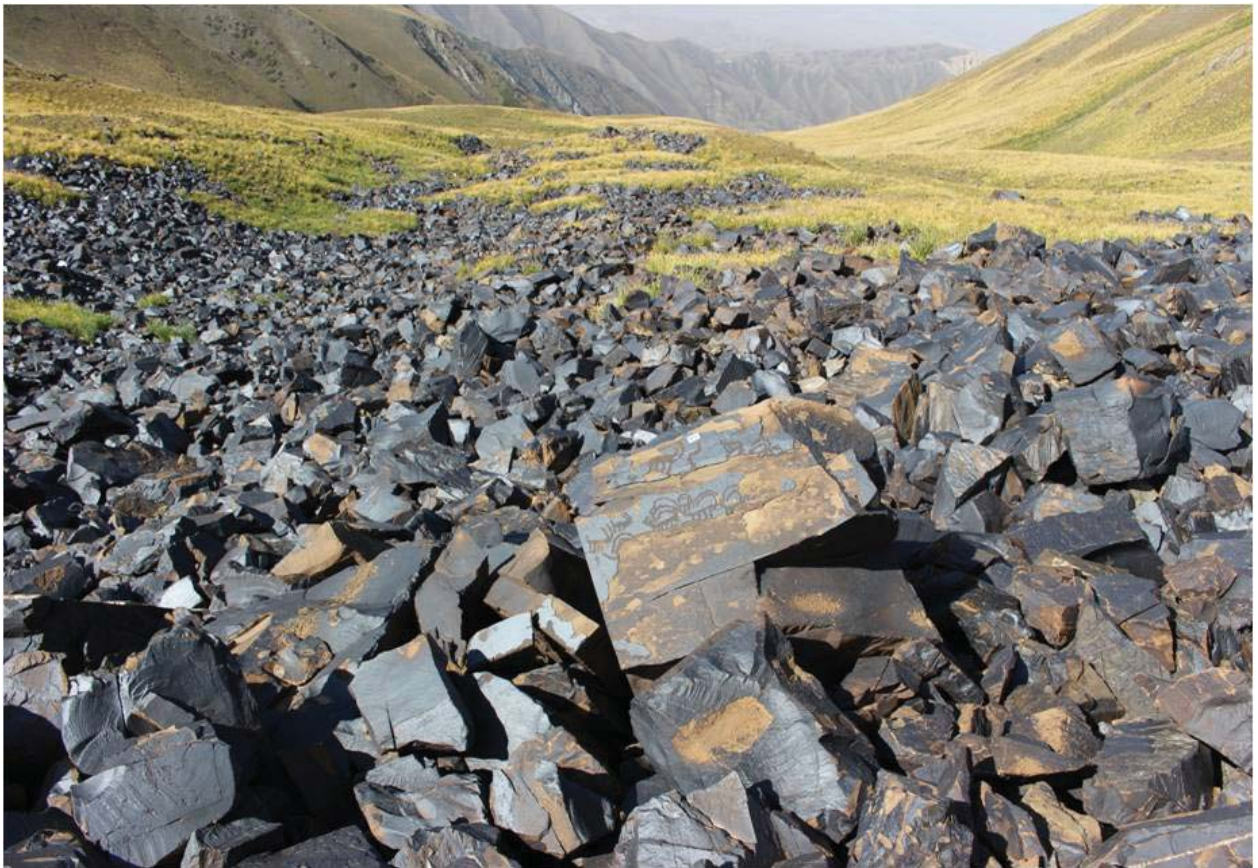
Рис. 4. Каменные обвалы (морена) Саймалы Таша I. Вид с юго-запада Fig. 4. Rock falls (moraine) of Saimala Tasha I. View from the southwest

выделяются сюжеты рисунков, представляющие «повседневный быт» древнего общества и их «восприятие» окружающей среды, «мировоззрение» и «сакральную» сторону жизни. Создателями рисунков Саймалы-Таша вряд ли ставилась задача передать какую-нибудь информацию грядущим поколениям, о важном событии общества того времени и т. д. Однако эти петроглифы доносят до нас представление о «мирной повседневной» жизни людей из далеких ушедших эпох.