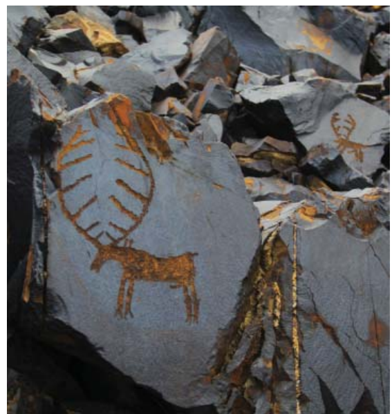
Рис. 5. Петроглифы памятников Саймалы-Таш I и II Fig. 5. Petroglyphs of the monuments of Saimala-Tash I and II