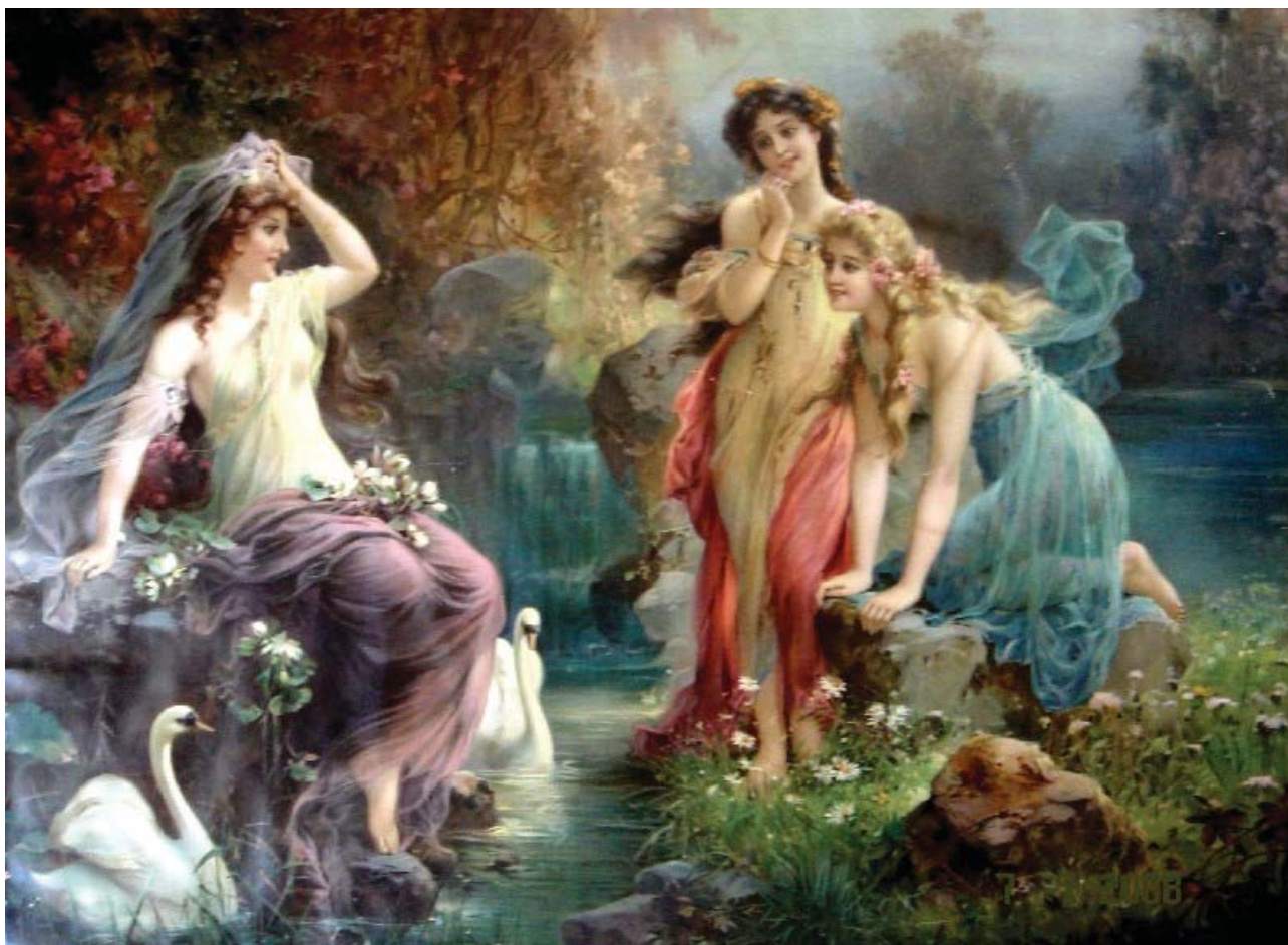
Рис. 1 Ханс Зацка «Девушки у озера».