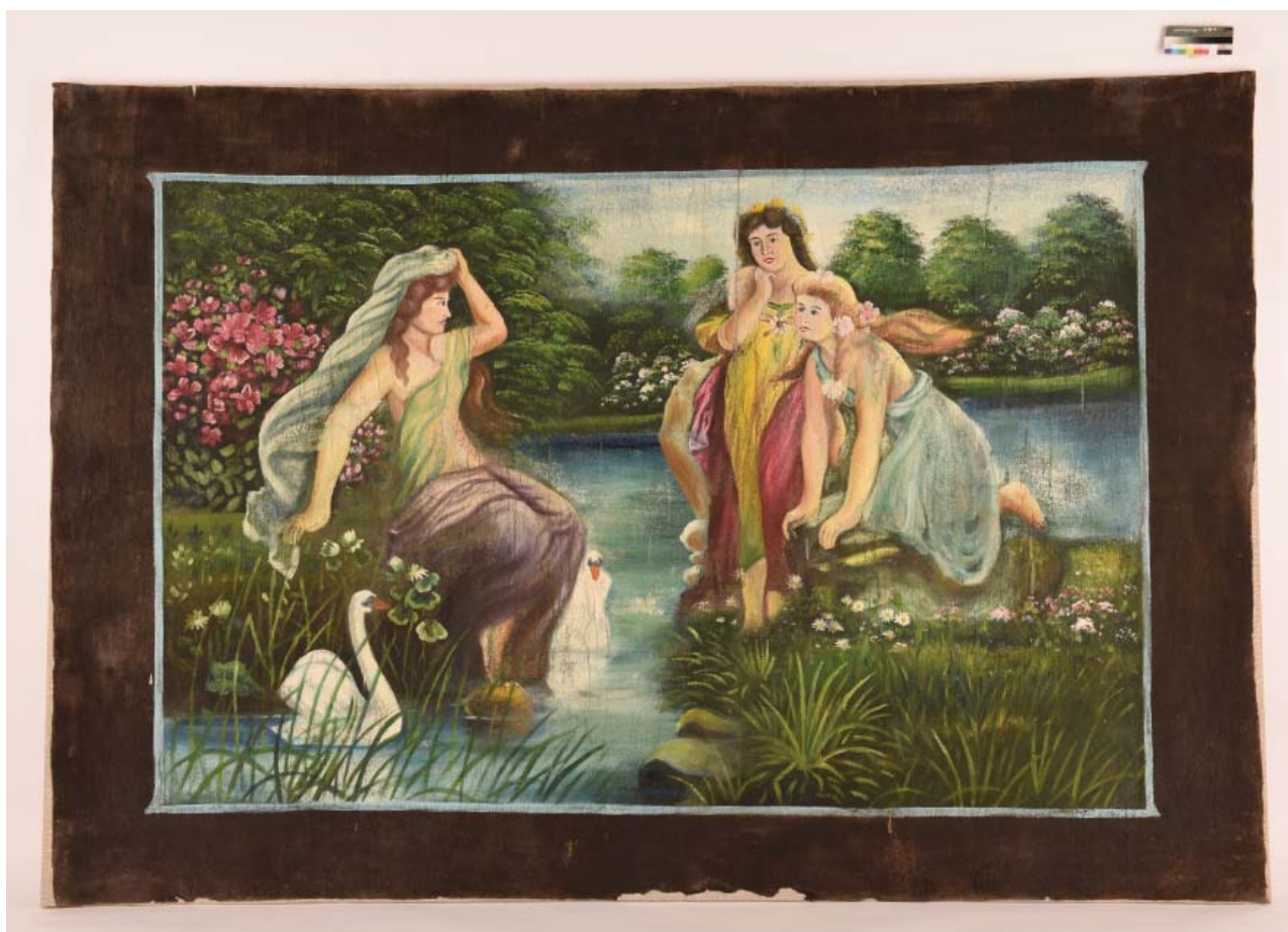
Рис. 7 Тканое полотно с живописным изображением после реставрации. Общий вид. Лицевая сторона. Fig. 7 Woven textile with a pictorial image after restoration. General view. Front side.

кромка была использована льняная ткань. Ширина дублировочных кромок складывается из толщины бруска подрамника, величины захода холста под живопись и размера холста, необходимого для загиба и заделки на оборотной стороне подрамника (Горин, 1977, с. 93). Заход холста на основное полотно был 4 см. На кромки с кисти наносилась акриловая дисперсия Lascaux Acrylkleber 498-20X (Кобякова, 2014, с. 187). Важными требованиями к адгезиву были надёжное склеивание без проникновения в нити холста и не провоцированием усадки. (Федосеева, 2016, с. 99). Дублирование кромок проводилось с помощью проглаживания валиком, фторопластовым шпателем и с последующей термофиксацией электроутюгом при температуре 50 °С через хлопчатобумажную ткань.