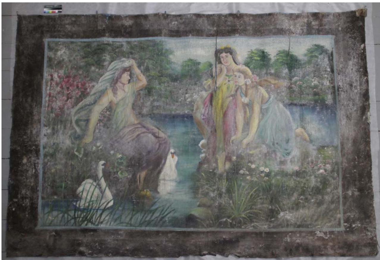
Рис. 2 Тканое полотно с живописным изображением до реставрации. Общий вид. Лицевая сторона.