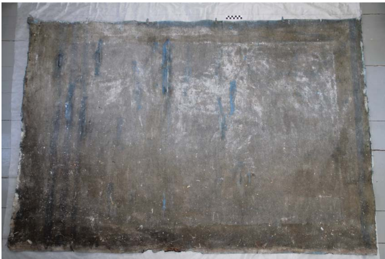
Рис. 4 Тканое полотно с живописным изображением до реставрации. Общий вид. Обратная сторона. Fig. 4 Woven textile with a pictorial image before restoration. General view. Reverse side.

слоя и выборе способа хранения и экспонирования предмета.