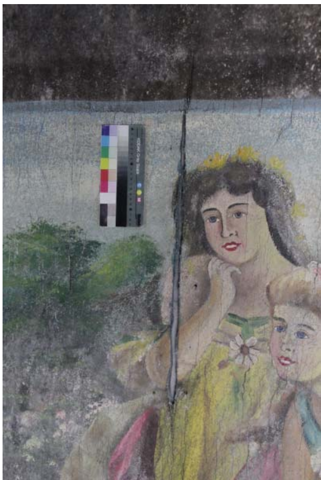
Рис. 3 Фрагмент (разрыв) до реставрации. Лицевая сторона.