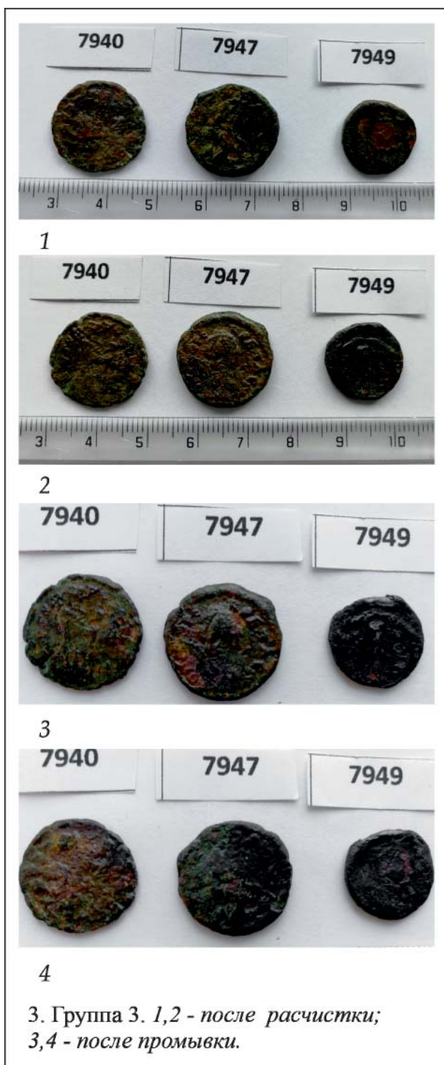
Рис. 3 Группа 3. Стабилизация методом глубокой промывки.