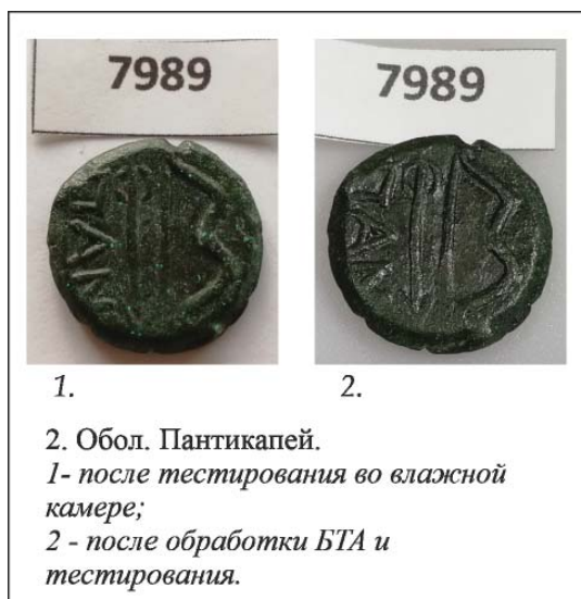
Рис. 2. Обол. Пантикапей. Обработка Бензотриазолом.