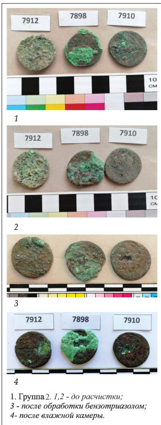
Рис. 1. Группа 2. Обработка Бензотриазолом. Фото С.В. Струковой.